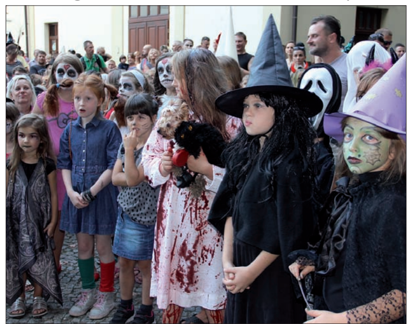
Fot. ELŻBIETA PRZYCZKO