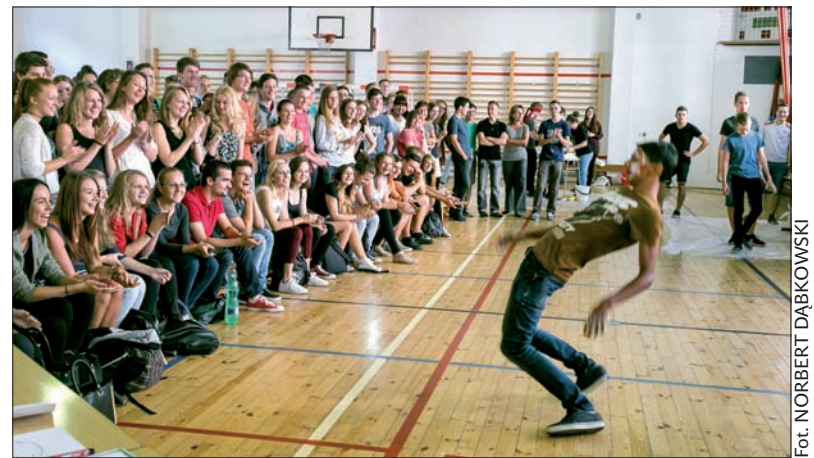
Próba sił w tańcu przed publicznością.

Na koniec twarze pierwszaków zostały specyficznie ozdobione w celu wykonania pamiątkowej fotografii. Wszystkie takie zdjęcia będą następnie zebrane w formie jednolitego panelu, który zawiśnie w przejściu między starą a nowszą częścią szkoły. (endy)