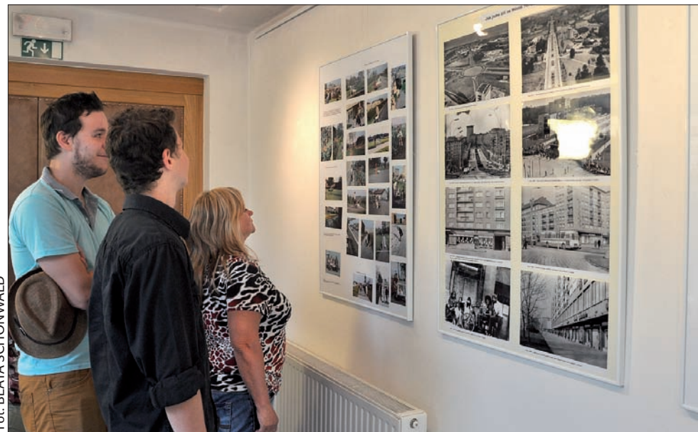
Wystawę o dawnym życiu w Hawierzowie można oglądać do końca września.

Uzupełnieniem wystawy są panele związku filatelistów przedstawiające historię stempli i urzędów pocztowych obecnych dzielnic Hawierzowa, a wcześniej samodzielnych wiosek – Błędowic Dolnych, Szumbarku i Suchej Średniej. (sch)