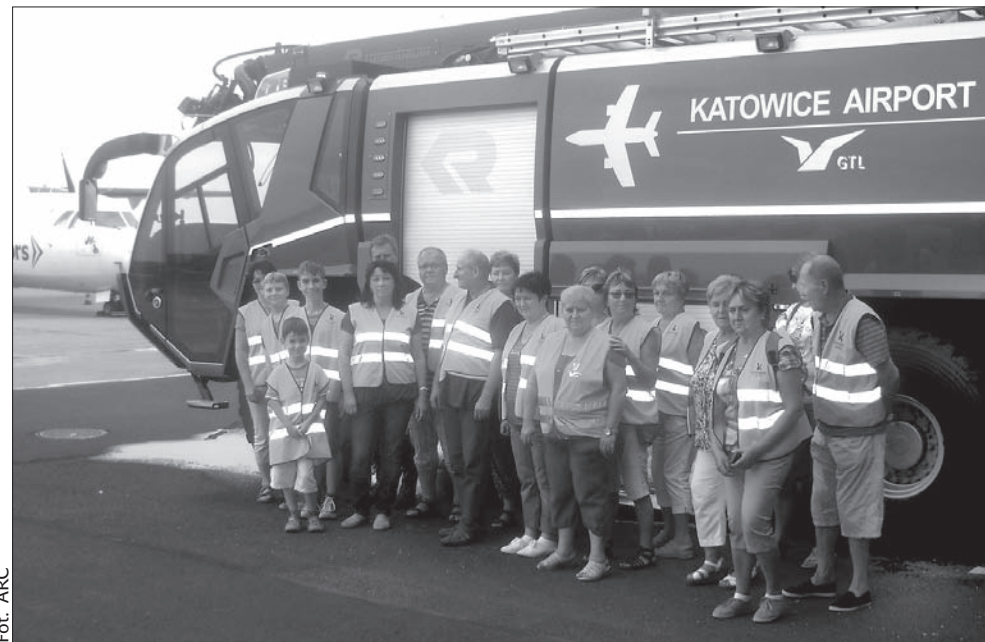
Jednym z punktów programu wycieczki była wizyta na lotnisku w Balicach.