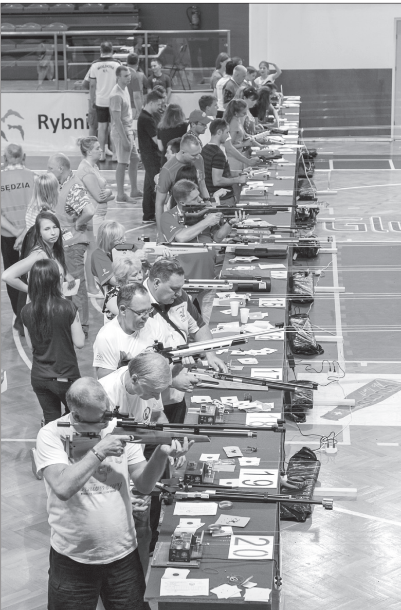
Zaolziańscy strzelcy wywalczyli cztery medale.