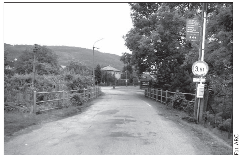
Włodarze Šmílovic apelują, by na ten most samochodem nie wjeżdżać.