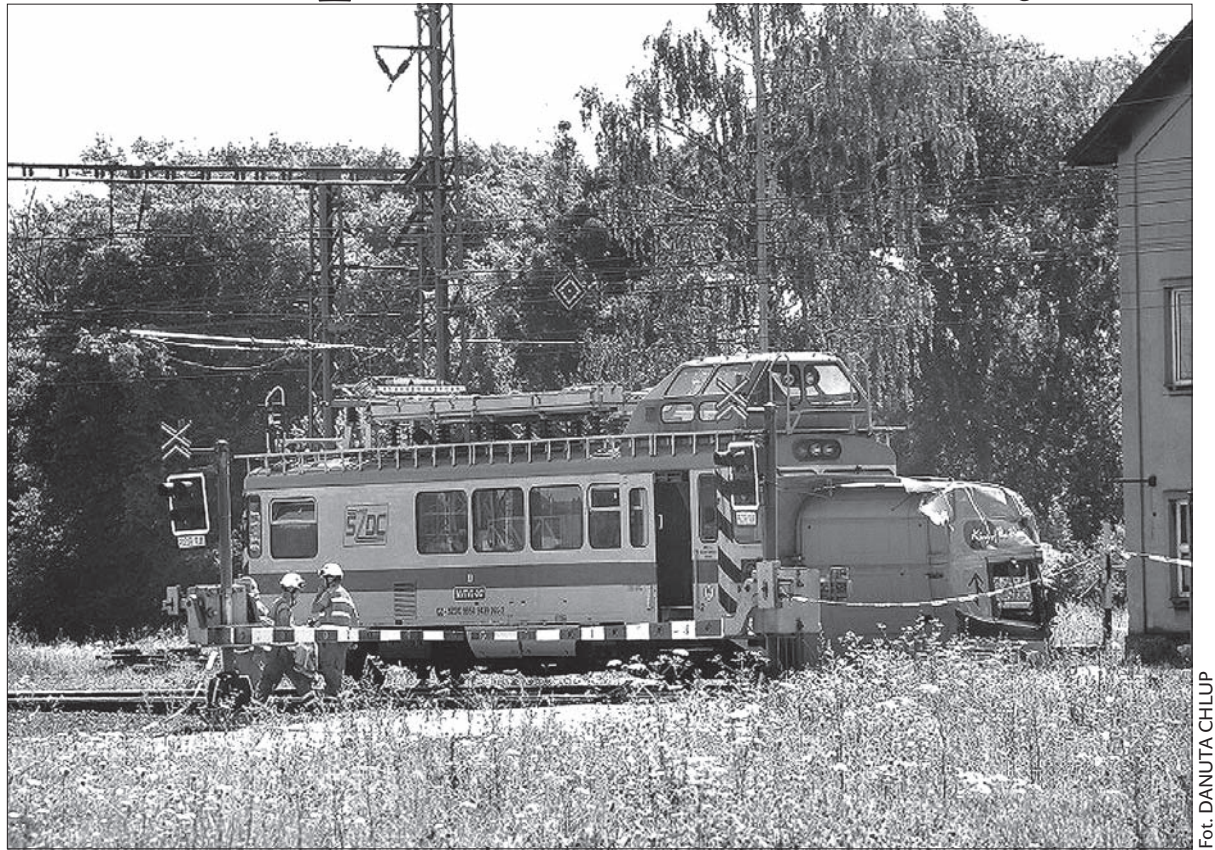
Odszkodowania rodzinom ofiar i rannym wypłaci ubezpieczalnia, w której ubezpieczony jest kierowca tira.

Rodziny ofiar otrzymają ponadto dary finansowe od województwa morawsko-śląskiego. We wtorek zdecydował o tym zarząd województwa.