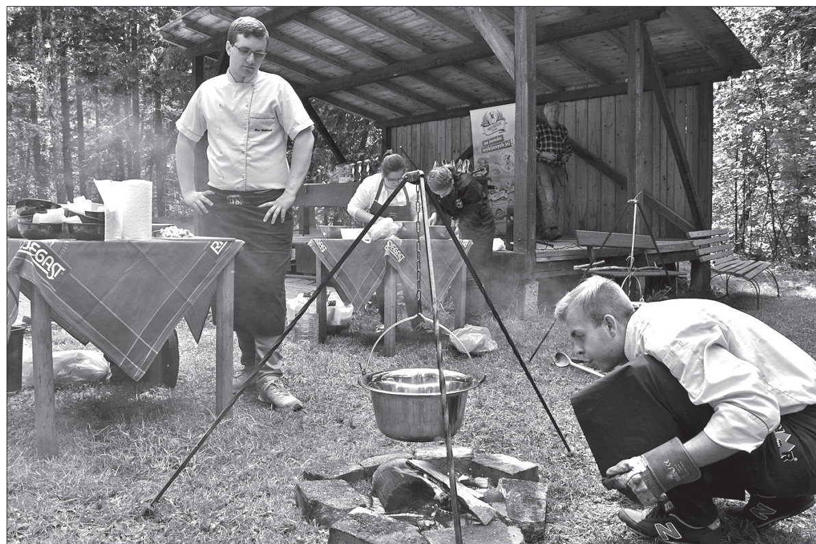
W sobotę młodzi kucharze jak zwykle spotkali się „Na Pasieczkach”, by przygotować kulinarne specjalności w kociołkach.