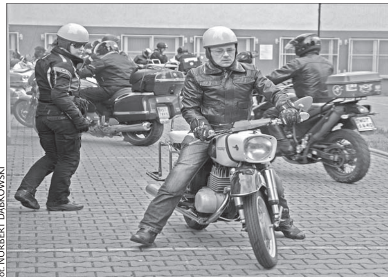
Motocykliści przed jabłonkowską podstawówką.

Doświadczeni jurorzy przyznawali ponadto punkty za technikę, taktykę oraz udzielenie pierwszej pomocy przedmedycznej – powiedział rzecznik Wojewódzkiej Straży Pożarnej, Petr Kúdela. (dc)