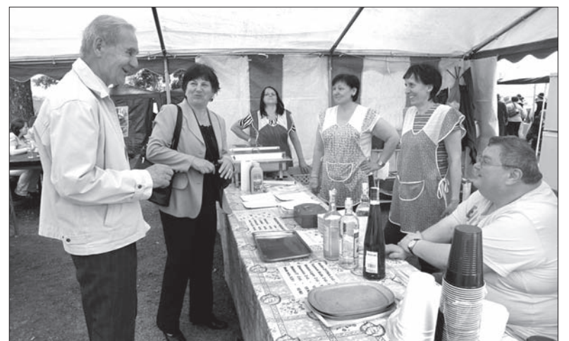
Przy stoisku MK PZKO Olbrachcice można było zakupić m.in. wędzone kielbaski.