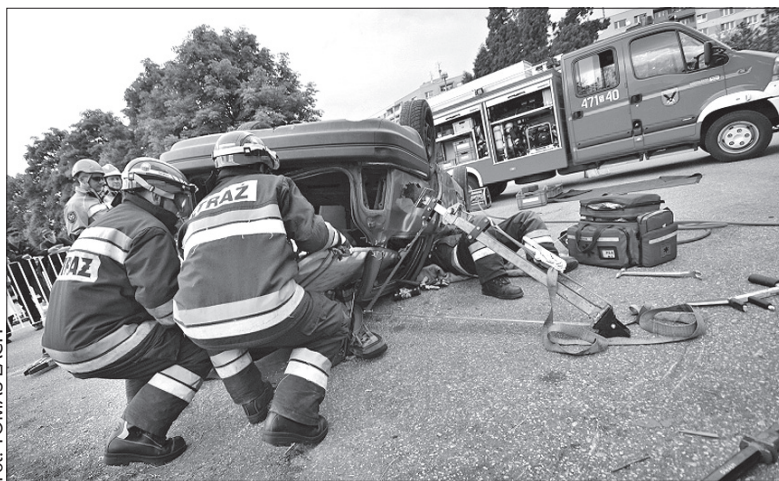
Współzawodnictwo polskich ekip.

Ostrawie, która pokryje 75 proc. inwestycji. Podczas wakacji rozpocznie się też remont chodnika wzdłuż drogi drugiej klasy II/474 w Mostach Dolnych. W tym roku odnowiony zostanie ponadto chodnik w centrum wioski – od budynku byłej szkoły aż po wiadukt oraz od tunelu aż po Urząd Celný Republiki Słowackiej. Wakacje przebiegać będą również pod znakiem pierwszego etapu remontu kapitalnego kompleksu szkolnego. W czerwcu natomiast odnowiony zostanie dach na Drzewiönce. (kor)