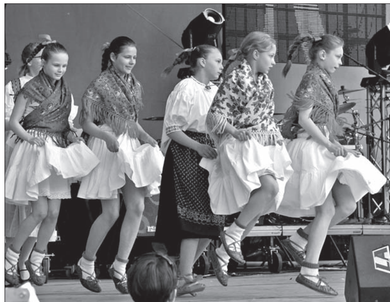
Czesko-cieszyńska „Rytmika”, jedni z najmłodszych wykonawców.

W sobotę na festiwalowych gości czekała oczywiście nie tylko prezentacja dorobku Polaków na Zaolziu. W przerwie między występami uczestnicy Festiwalu chętnie odwie-