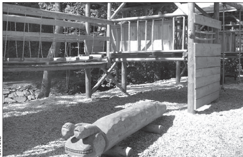
Na tych atrakcjach z drewna dzieciarnia będzie się mogła do woli wysaleć.

Nie zapomniano o tablicach z informacjami o życiu górali, o tym, jak mieszkańcy Łomnej dawniej mieszkali, jak się odżywiali, jak wyglądali ich stroje, gwara, zwyczaje. A to wszystko w językach czeskim, polskim i angielskim. (kor)