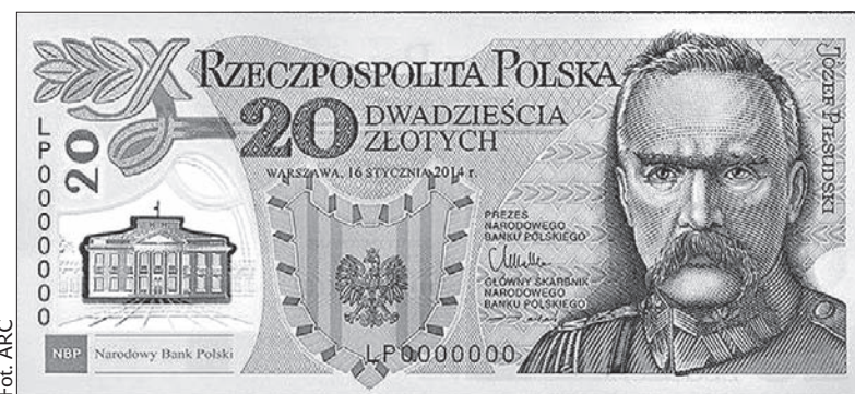
Zwycięski banknot (awers).

W sierpniu tego roku do obiegu zostanie wprowadzony kolejny banknot kolekcjonerski, tym razem wyemitowany przez NBP z okazji 600. rocznicy urodzin Jana Długosza. (wik)