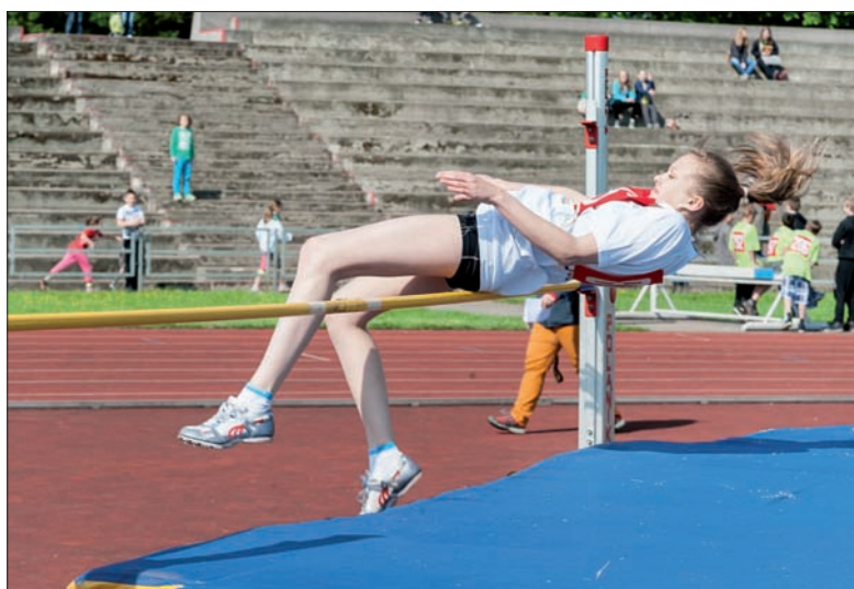
W skoku wzwyż nie było łatwo.