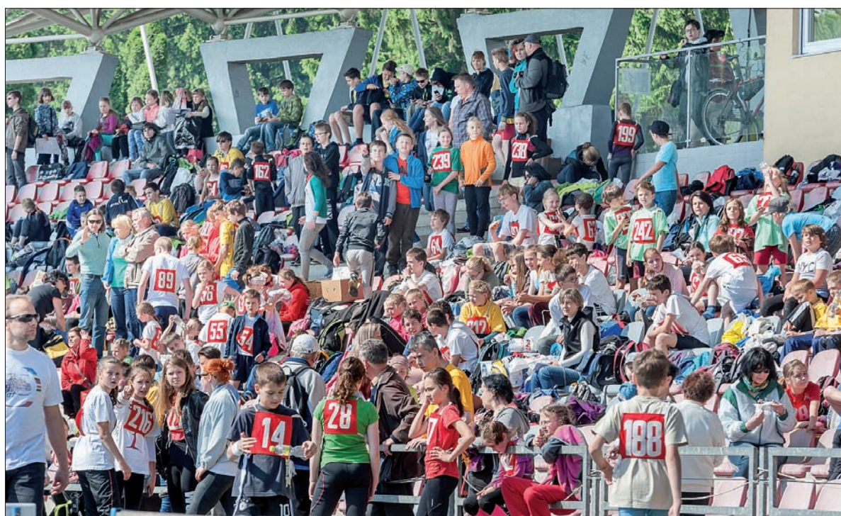
Trybuny stadionu w Trzyńcu pękały w szwach.