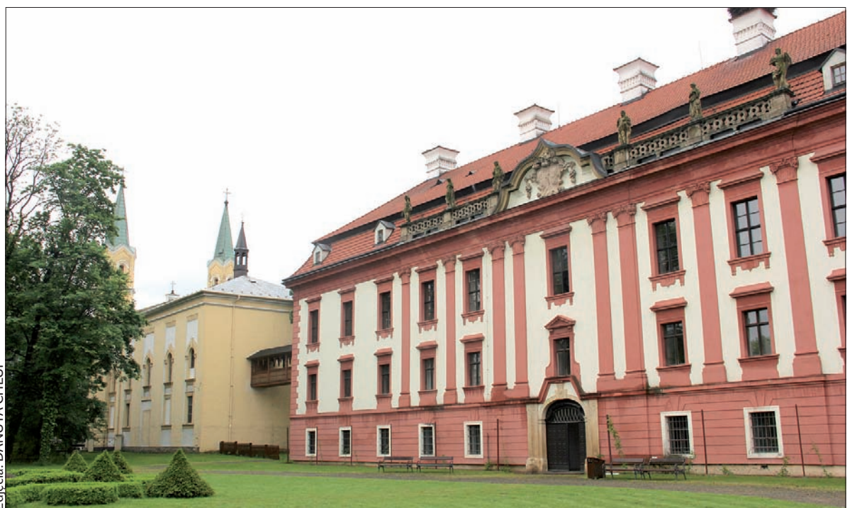
Zamek w Kuninie z przylegającym do niego kościołem.