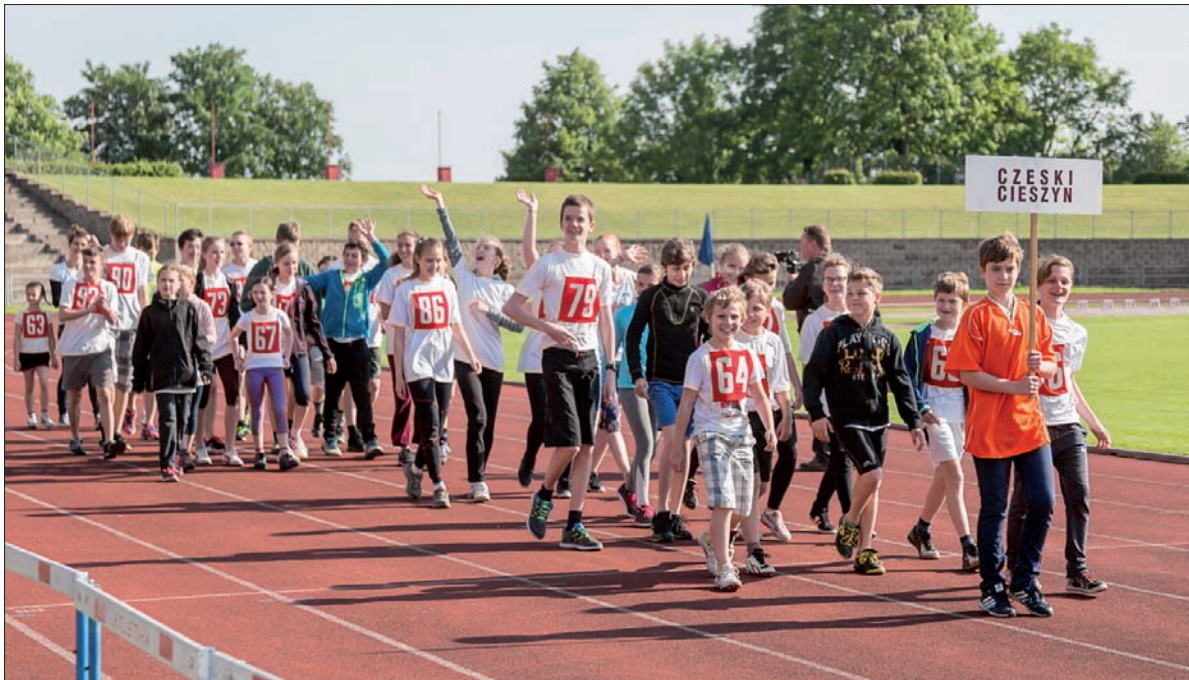
Gospodarze tegorocznych igrzysk podczas defilady.