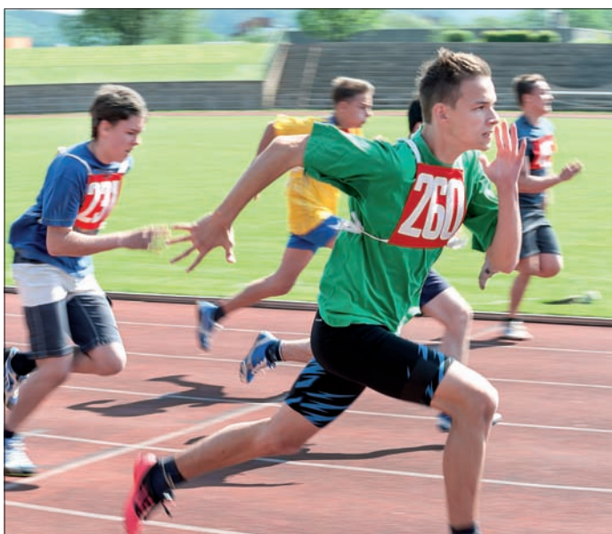
Współzawodnictwo na bieżni było bardzo zacięte.