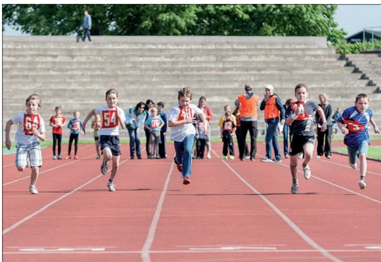
Młodzi sprinterzy przed metą.