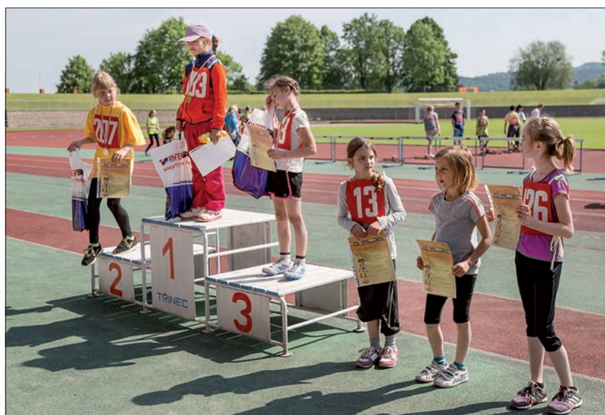
Podium w rzucie piłeczką kategorii dziewcząt.

PIŁKA NOŻNA – SYNOT LIGA: Ostrawa – Dukla Praga (dziś, 17.15). FNL: Trzynieć – Zlin (jutro, 17.00). MŚLF: Orłowa – Hulin (dziś, 16.30). DYWIZJA: Witkowiec – Hawierzów (dziś, 16.30), Slavićin – Piotrowice (jutro, 10.15). MISTRZOSTWA WOJEWÓDZTWA: Wędrynia – Polanka, Cz. Cieszyn – Herzmanice, Szonów – Bogumin, Dziećmorowice – Koberzyce (dziś, 17.00). IA KLASA – gr. B: Stonawa – Datynie Dolne, Olbrachcice – Lutynia Dolna (dziś, 17.00), Bystrzyca – Dobratice (jutro, 17.00). IB KLASA – gr. C: Gnojnik – Dobra, Żuków Górny – ČSAD Hawierzów, St. Miasto – Sucha Górna, Mosty – Piosek (dziś, 17.00), Jabłonków – Luczina, Inter Piotrowice – Sn Orłowa, Śmiłowice – Nydek (jutro, 17.00). MISTRZOSTWA POWIATU KARWIŃSKIEGO: Sj Pietwałd – Orłowa B, Piotrowice B – Bogumin B, V. Bogumin – B. Rychwałd, Łąki – Cierlicko, Zabłocie – Sj Rychwałd (dziś, 17.00), Wierzniowice – Sn Hawierzów, Olbrachcice B – Dąbrowa, G. Błędownice – F. Orłowa (jutro, 17.00). MISTRZOSTWA POWIATU FRYDEK-MISTEK: Ostrawica – Toszonowice (dziś, 10.00), Hukwaldy – Oldrzychowice (dziś, 17.00), Gródek – Rzepiszczce, Niebory – Janowice (jutro, 17.00). ROZGRYWKI POWIATU FRYDEK-MISTEK: Wędrynia B – Nawsie, Milików – Kuńczyce p. O., Bukowiec – Sedliszcze (jutro, 17.00). (jb)