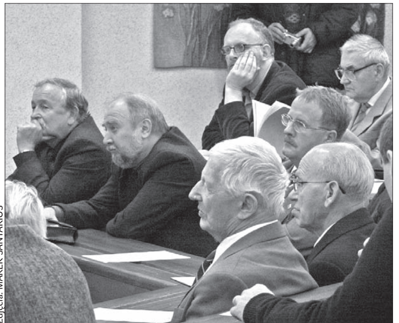
Uczestnicy obchodów 60-lecia „Głosu Ludu” w 2005 roku.