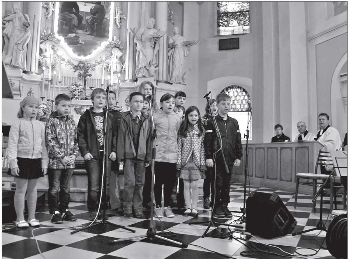
W czasie uroczystego nabożeństwa wystąpiły dzieci ze szkółki niedzielnej.