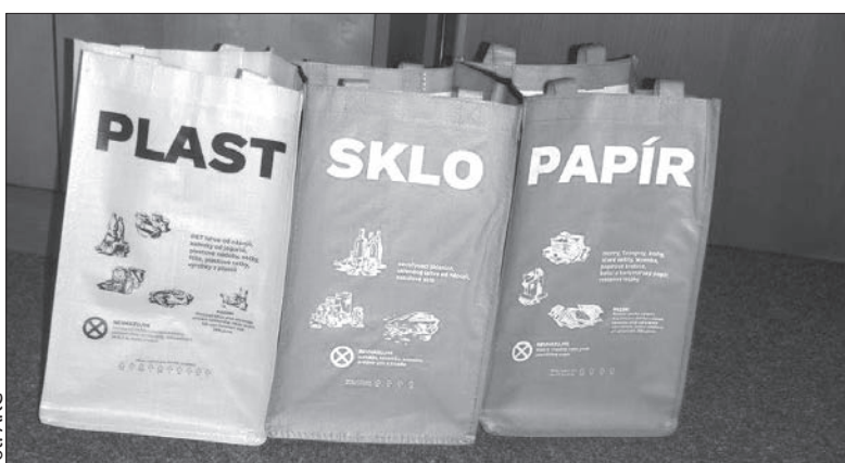
Praktyczne torby do segregowania śmieci czekają na mieszkańców w hawierzowskim magistracie.

Nieduże plastikowe torby okazały się praktycznym pomocnikiem. Z jednej strony nie zajmują zbyt wiele miejsca, z drugiej zaś dzięki nim hawierzowianie nie muszą wy-