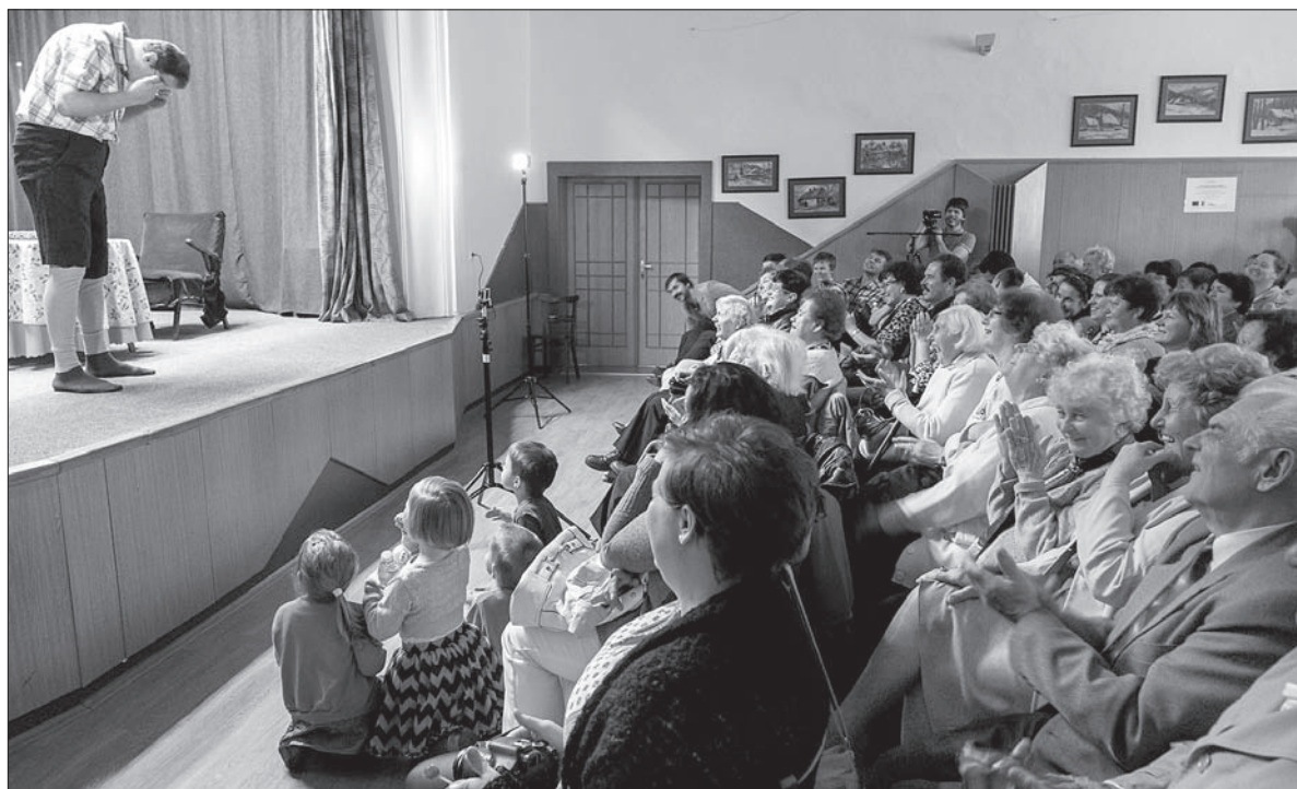
Reakcja widowni na mocno skrócone „fatalne spodnie”.