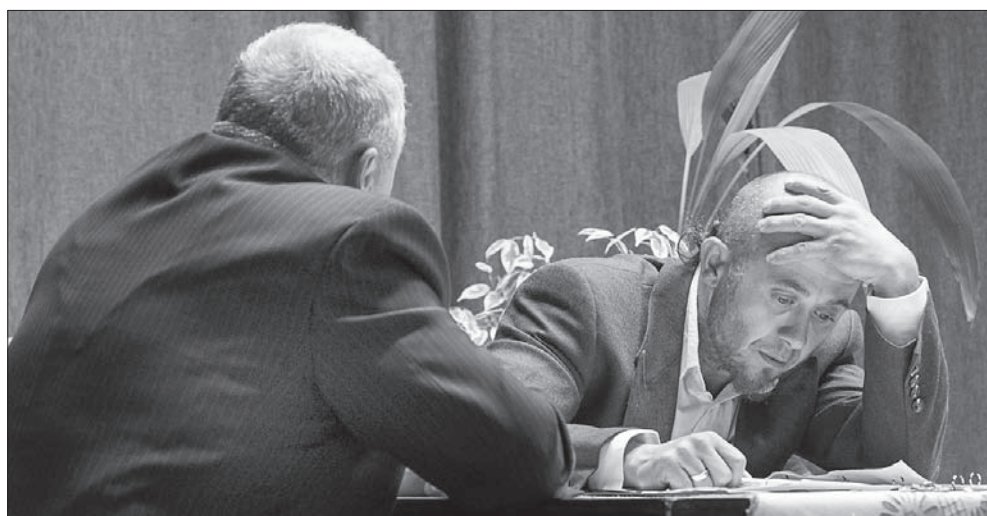
Przygotowania do prelekcji.