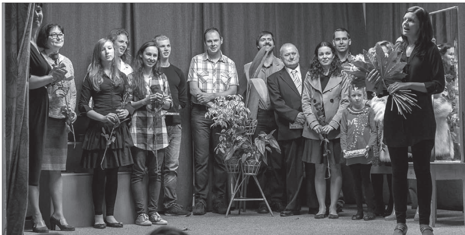
Prezentacja wszystkich aktorów biorących udział w przedstawieniu.

Zapraszamy do obejrzenia fotoreportażu na naszej stronie internetowej www.glosludu.cz