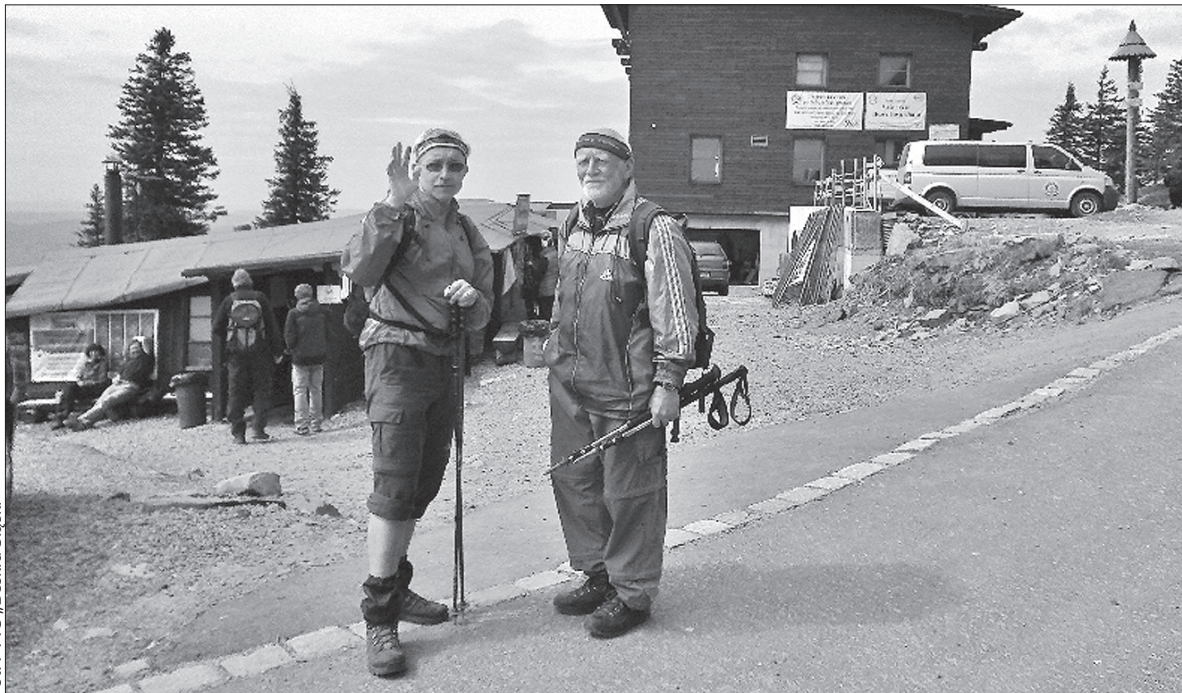
Członkowie „Beskidu Śląskiego” kilka dni temu wspięli się na Łysą Górę.

Na początku maja na Łysą Górę zawitali członkowie PTTS „Beskid Śląski”. – Celowo wybraliśmy się tam w tym terminie, by zdobyć jeszcze pieczętki ze starych obiektów, które potem zostaną zamknięte.