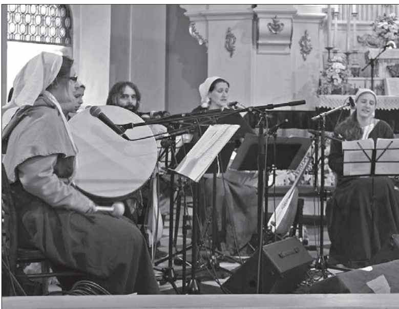
W czasie uroczystego nabożeństwa wystąpił zespół Cithara Sanctorum z Poznania, wykonujący muzykę późnośredniowieczną.