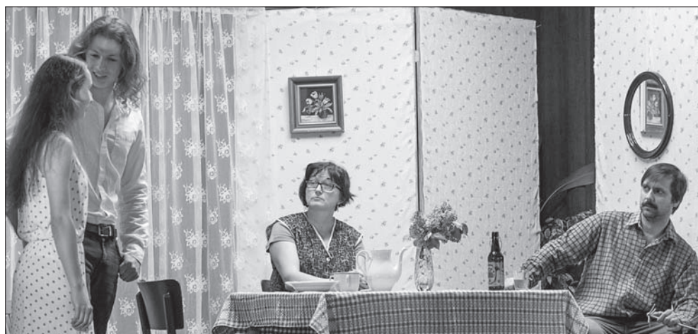
Córka musi wyjść za mąż.