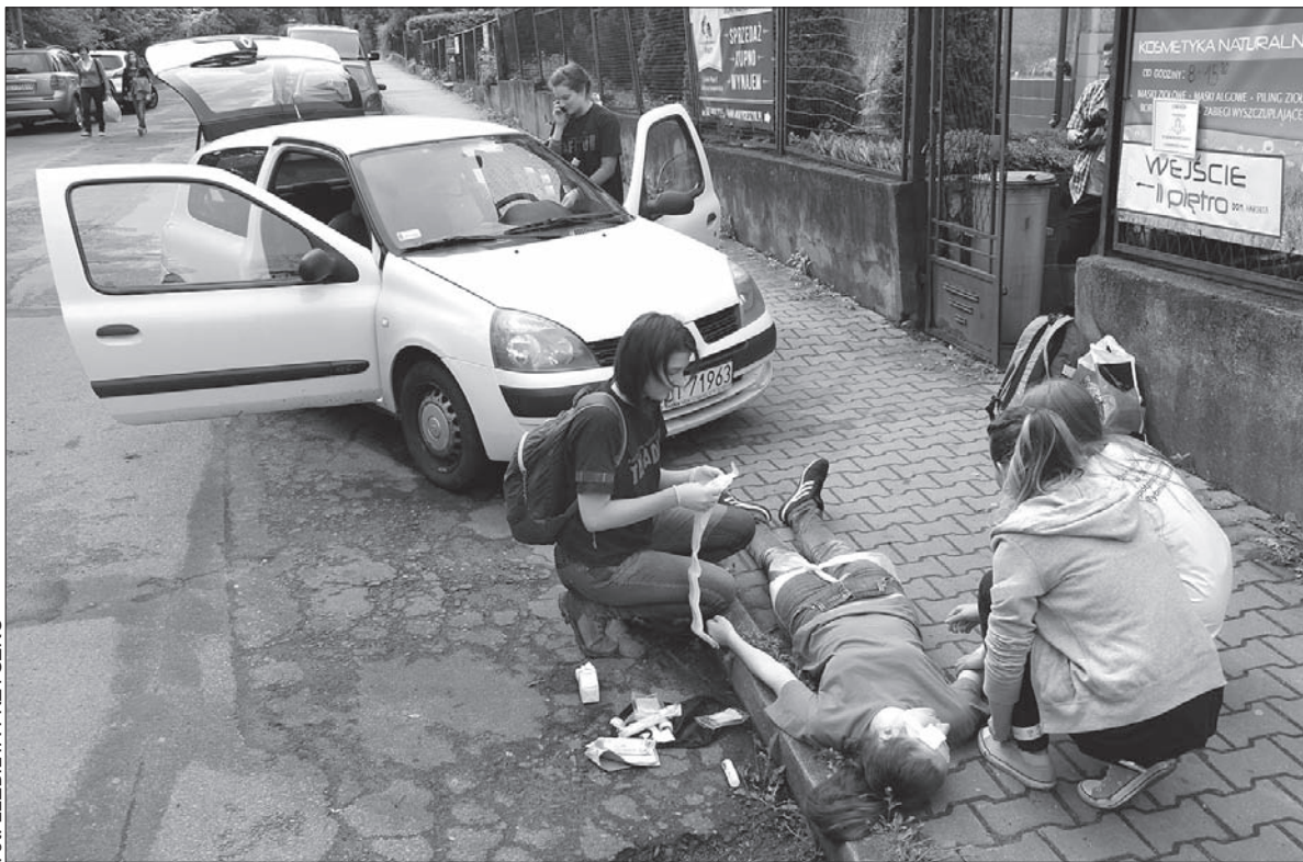
Uwaga, to tylko pozoracja! Tak udana, że przechodnie chcieli wzywać pogotowie.

W mieście czekało na nie oraz na pozostałe patrole aż siedem „niespodzianek”. – Zawody odbywają się w formie gry miejskiej. W Cieszynie