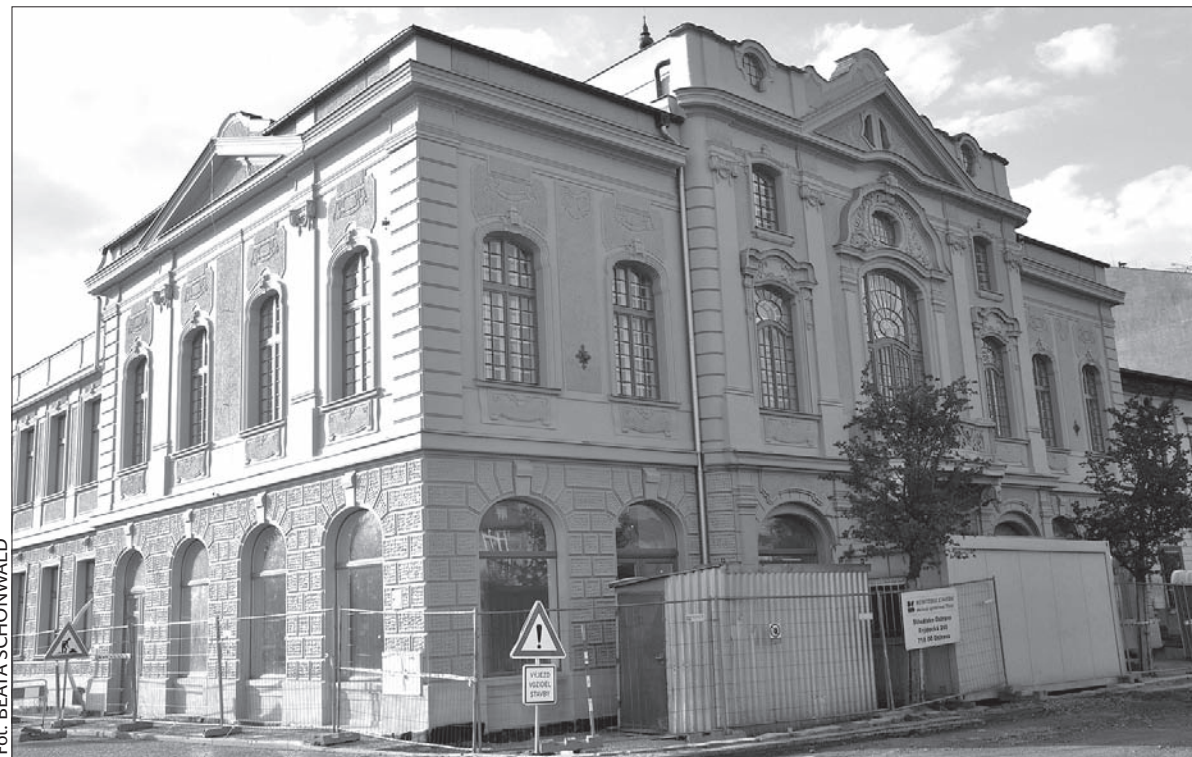
Po remoncie w Domu Narodowym w Starym Boguminie zostanie otwarte muzeum.

W wyremontowanym Domu Narodowym znajdzie się miejsce również na czasowe ekspozycje miejscowych stowarzyszeń obywatelskich. Tymczasową przystań znajdą tu także pochodzące z kościoła w Starym Boguminie dwa historyczne dzwony, które po 73 latach wróciły do swojej parafii. Zanim zawisną na wieży kościoła, można je będzie oglądać właśnie w westybulu Domu Narodowego. (sch)