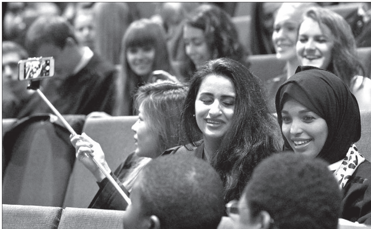
Studenci podczas centralnej inauguracji roku akademickiego uczelni medycznych, jaka odbyła się 10 kwietnia w Centrum Dydaktycznym Uniwersytetu Łódzkiego.

Generuje to też przychody dla krajów goszczących zagranicznych studentów. Według Fundacji Perspektywy rynek studiów międzynarodowych przynosi 100 miliardów dolarów rocznie w skali globalnej. W Polsce wkład zagranicznych studentów do gospodarki wynosi 150 milionów rocznie.