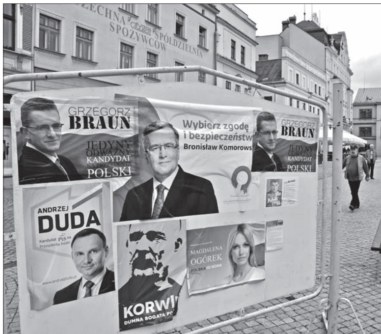
Kampania przed wyborami prezydenckimi jest niemal niewidoczna na ulicach polskich miast.

To samo pytanie o zainteresowanie odbywającymi się nad Wisłą wyborami zadaliśmy dyrektorowi