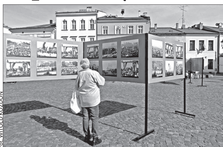
Na skoczowskim rynku można podziwiać wystawę „Jan Paweł II. 20 lat temu był wśród nas”. Ekspozycja została otwarta z okazji Roku Papieskiego, który rozpoczął się pod Kaplicówką w kwietniu. Na wystawę składają się zdjęcia przedstawiające wizytę papieża na tym wzgórzu w 1995 roku.