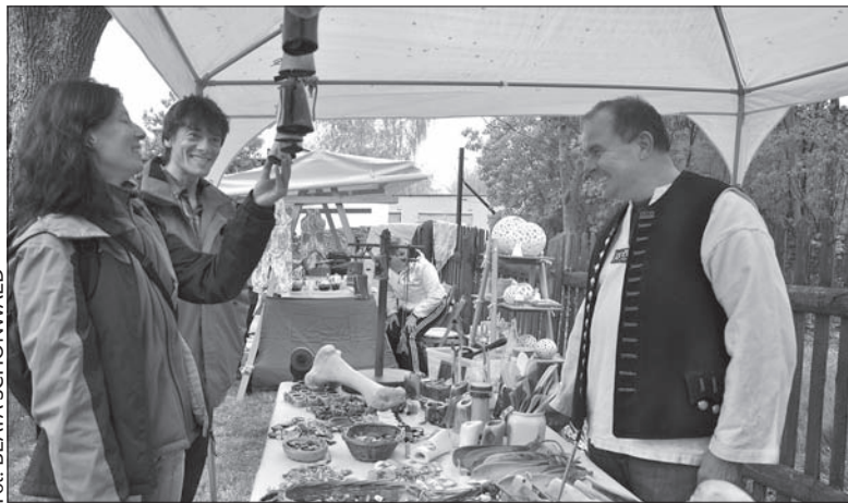
Wyroby z kości cieszyły się sporym zainteresowaniem.

Tradycyjnie w otwarciu sezonu Drzewiönki Kotuli nie mogło więc zabraknąć gości z Kaszarysk. – Pokazujemy wszystkie rzemiosła, które