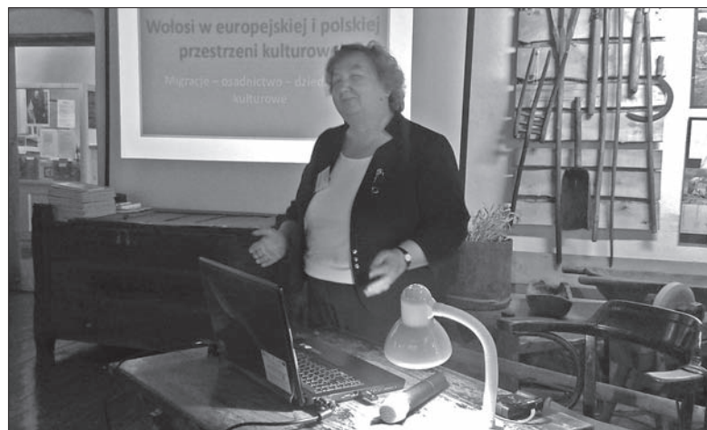
Konferencja naukowa odbyła się w Muzeum Beskidzkim w Wiśle.