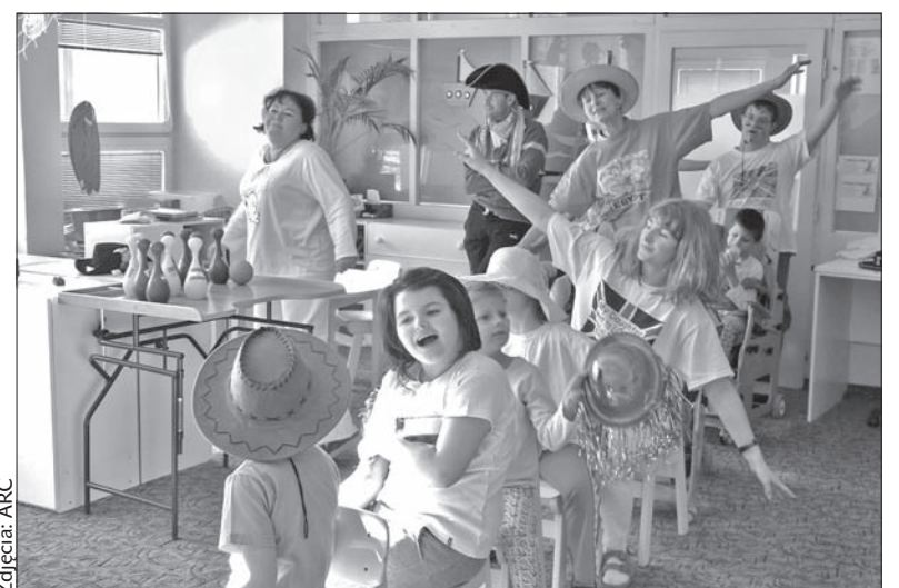
Obecne miejsce pracy fizjoterapeuty.

Wczesna opieka to terenowa forma pomocy rodzinom z niepełnosprawnymi dziećmi od urodzenia do siódmego roku życia. Pracownicy „Salome” odwiedzają rodziny i pomagają im rozwiązywać różnorodne problemy. Z usług tych korzystają przeważnie rodziny z Bogumina, Ostrawy i okolicy. Diakonia Śląska stworzyła ośrodek „Salome” w 1999 roku. Przedtem w budynku znajdował się ośrodek rehabilitacyjny szpitala, jeszcze wcześniej żłobek. (dc)