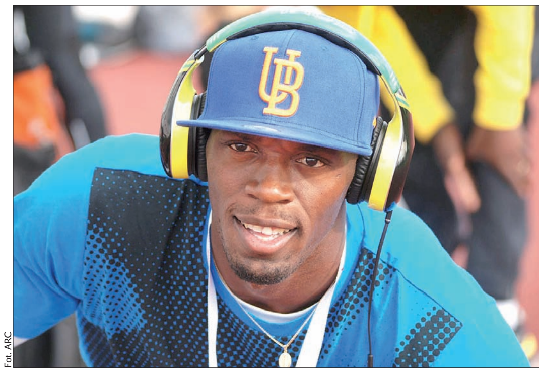
Jamajczyk Usain Bolt w wolnych chwilach uwielbia słuchać muzyki reggae.

Ostrawa nie zdąży jeszcze ochłonąć po hokejowych mistrzostwach świata, których finał zaplanowany jest na 17 maja, a już 26 maja kibice doczekają się kolejnej porcji bezcennych sportowych wrażeń. Jamajczyk Usain Bolt przyjedzie do Ostrawy po raz szósty w karierze, tym razem wystartuje zaś w biegu na dystansie 200 m. – Złata Tretra to jeden z moich ulubionych mityngów na Starym Kontynencie. Zawsze lubiłem tu przyjeżdżać, głównie ze względu na wspaniałą ostrawską publiczność, jak również gościnność organizatorów. Tej wręcz rodzinnej atmosfery zazdrościł wam wielu szefów prestiżowych mityngów w Europie – powiedział Bolt. Rok temu Jamajczyk musiał zrezygnować ze startu w Ostrawie z przyczyn zdrowotnych. W tym roku sytuacja wygląda bardzo korzystnie. Bolta omijają kontuzje, w ten weekend startuje chociażby w barwach reprezentacji Jamajki w prestiżowych zawodach sztafet IAAF. – To