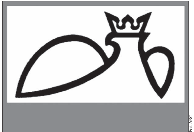
Charakterystyczne logo „Wspólnoty Polskiej”.

„Wspólnota Polska” wspiera struktury związków Polaków na Wschodzie i organizacje polonijne na świecie (565 podmiotów z 54 krajów). Pomaga szkołom polonijnym, zespołom artystycznym, redakcjom mediów polonijnych, klubom sportowym, drużynom harcerskim, parafiom oraz świadczy pomoc charytatywną. W Polsce organizuje