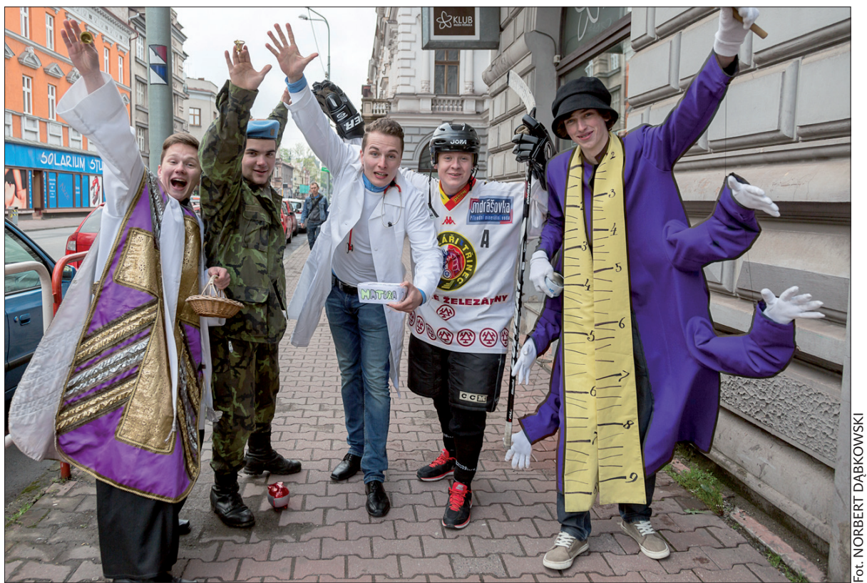
Srodowe szaleństwo czwartoklasistów...

Najbardziej utkwiły mi w pamięci momenty związane z usprawiedliwieniami nieobecności uczniów w szkole. Pewnego razu zapytałam dobrego sportowca, dlaczego nie przyszedł na szkolny dzień sportowy. Chciałam bowiem dociec, co konkretnie kryje się pod uzasadnieniem jego nieobecności zawartym w dość ogólnym stwierdzeniu „sprawy rodzinne”. Okazało się, że uczeń ten