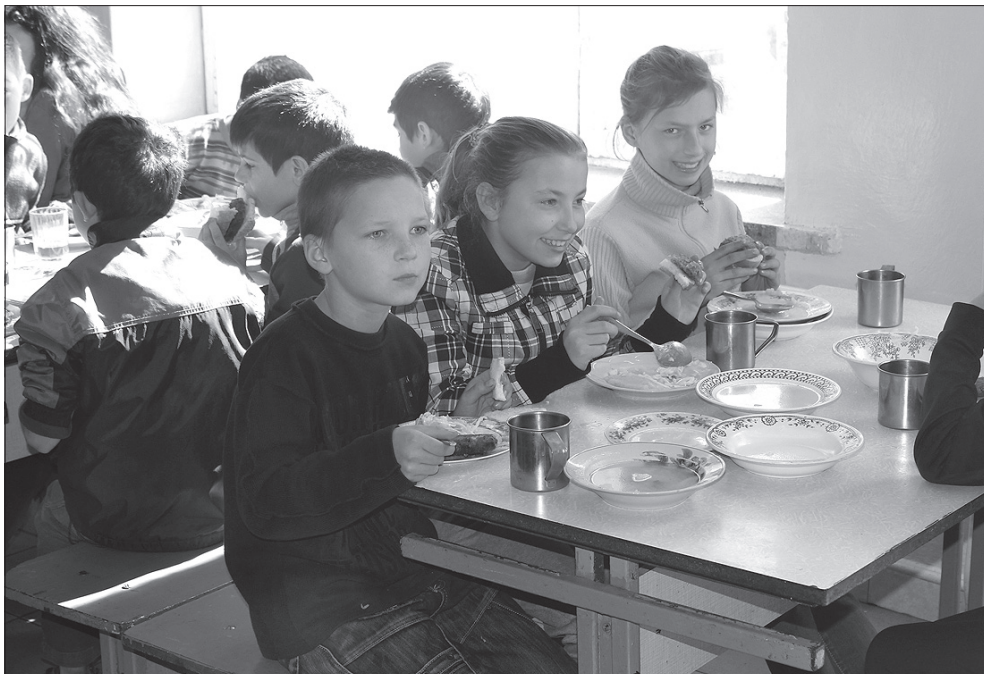
Jeden obiad dla ucznia mukaczewskiej szkoły to tylko 15 hrywien. Pomóc sfinansować dzieciom posiłki może każdy z nas.