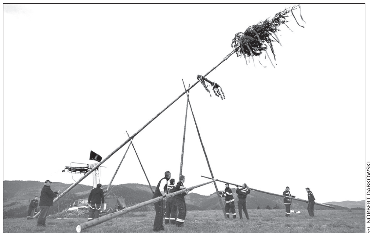
Ostatni dzień kwietnia to pora, by postawić „moja” czy „majkę”, jak to niektórzy nazywają. „Moja”, bo ma stać na 1 maja. Tradycja w Bukowcu została podtrzymana, a impreza odbyła się już po raz ósmy.