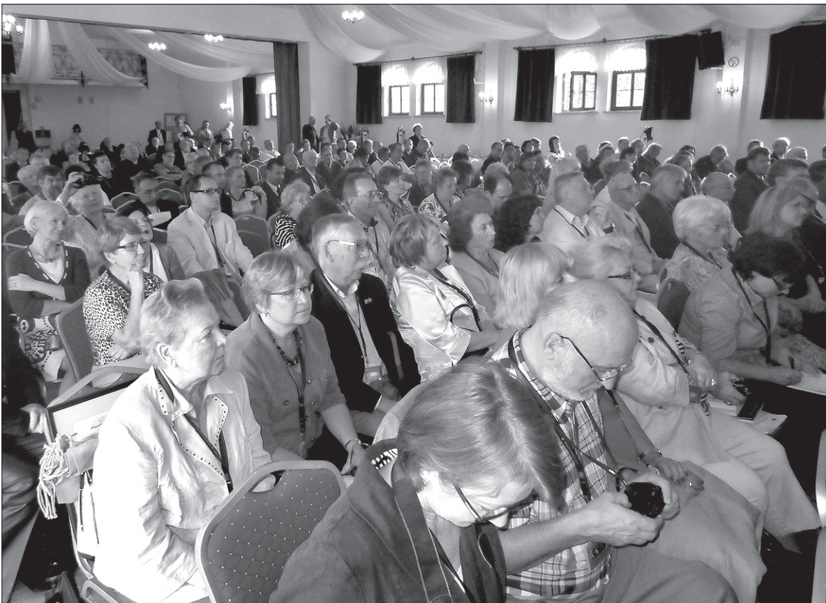
IV Zjazd Polonii i Polaków za Granicą w Pułtusku w sierpniu 2012 roku.

Budowaniu więzi między Polakami na świecie służy, wychodzące od 1991 roku, pismo „Wspólnota Polska”, które dociera do polonijnych organizacji na wszystkich kontynentach, dziennikarzy i naukowców zajmujących się Polonią oraz do instytucji krajowych, m.in. Senatu i Sejmu RP, placówek dyplomatycznych, stanowiąc źródło informacji i dokumentacji działalności polonijnej. Zbiór informacji o środowiskach polonijnych na świecie zawarty jest w Polonijnym Banku Danych i na stronie internetowej Stowarzyszenia, która cieszy się dużą popularnością i jest najlepszym źródłem wiedzy o Polonii. (r)