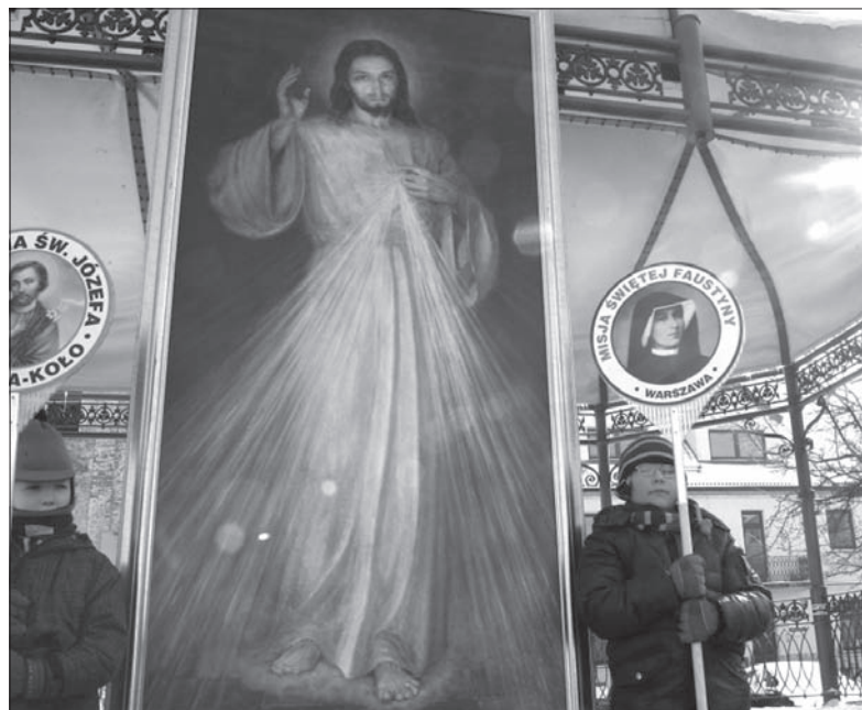
Procesja z obrazem Jezusa Miłosiernego i świętej Faustyny Kowalskiej, z okazji 80. rocznicy objawień Jezusa Miłosiernego.

– Usłyszałem kiedyś mądrą myśl: Wilno jest takim Betlejem Miłosierdzia Bożego – dodał. – Tutaj się wszystko zaczęło, tutaj doszło do spotkania siostry Faustyny z księdzem Sopoćko, tutaj był malowany obraz, tutaj została podyktowana Koronka do Miłosierdzia Bożego. Tutaj, tak naprawdę, były pierwsze obchody Święta Miłosierdzia Bożego. Kraków natomiast jest takim Rzymem, centrum dowodzenia i nikt na pewno nie będzie próbował odebrać mu tego statusu.