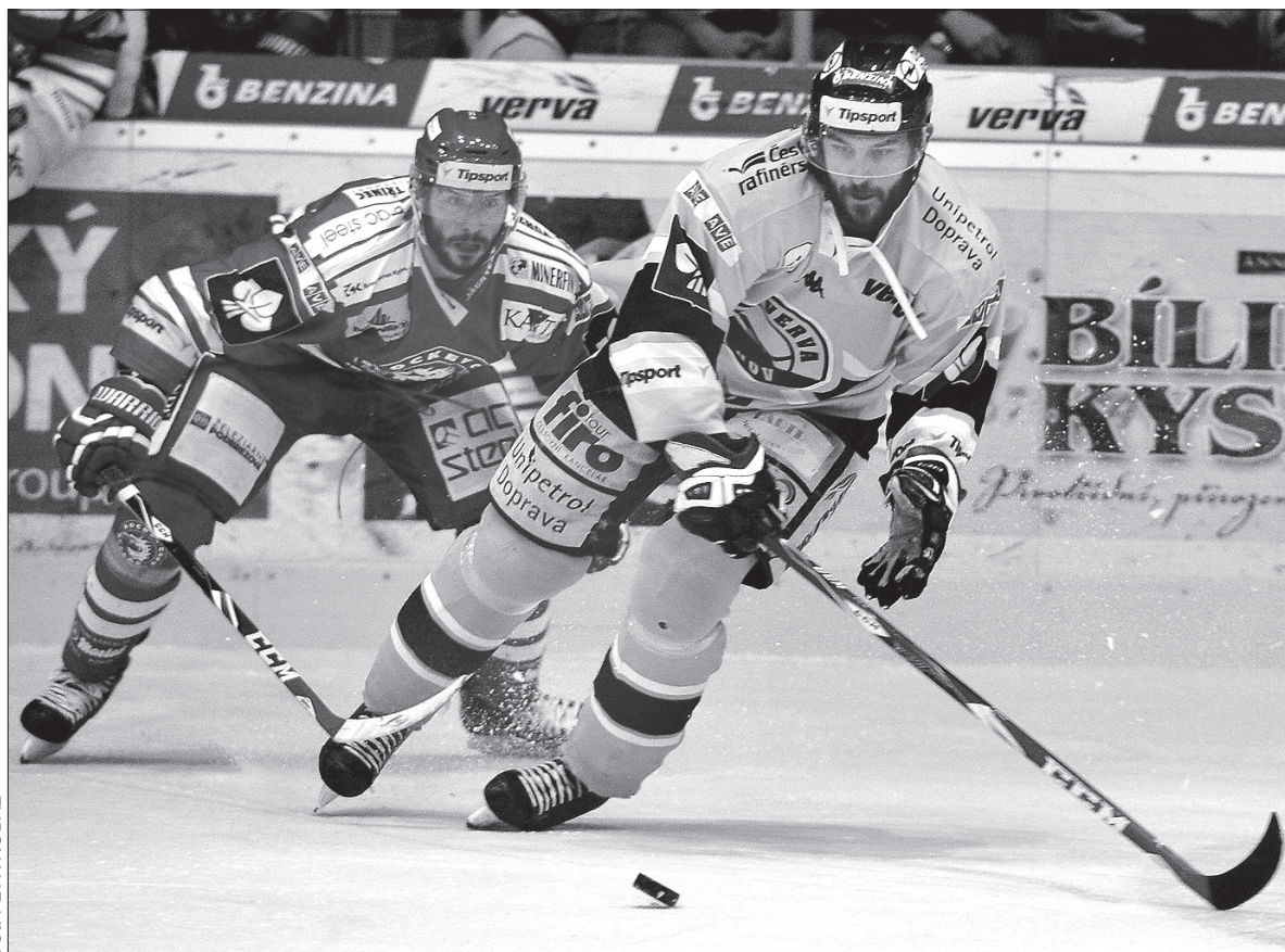
Dziś poznamy zdobywcę Pucharu Masaryka.