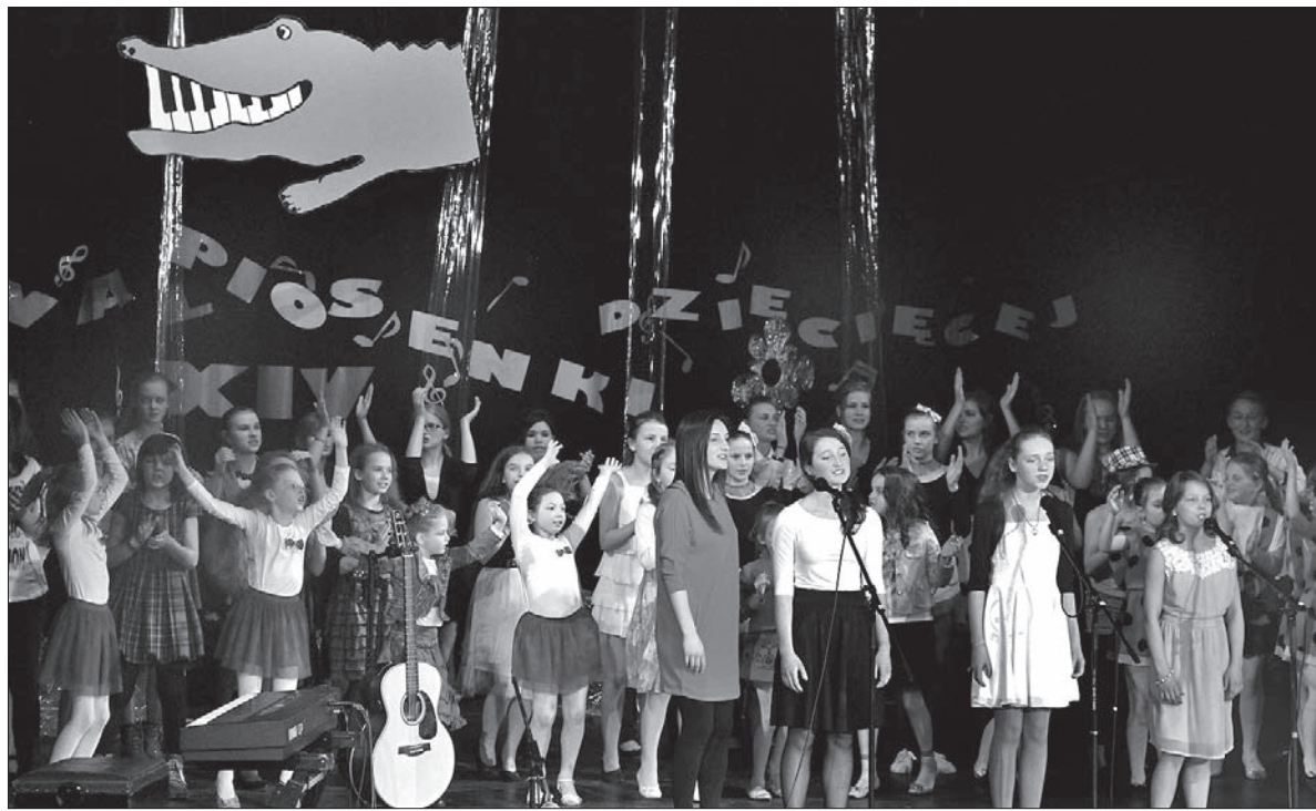
Na finał koncertu jego uczestnicy zaśpiewali piosenkę „Dajmy dzieciom uśmiech”.