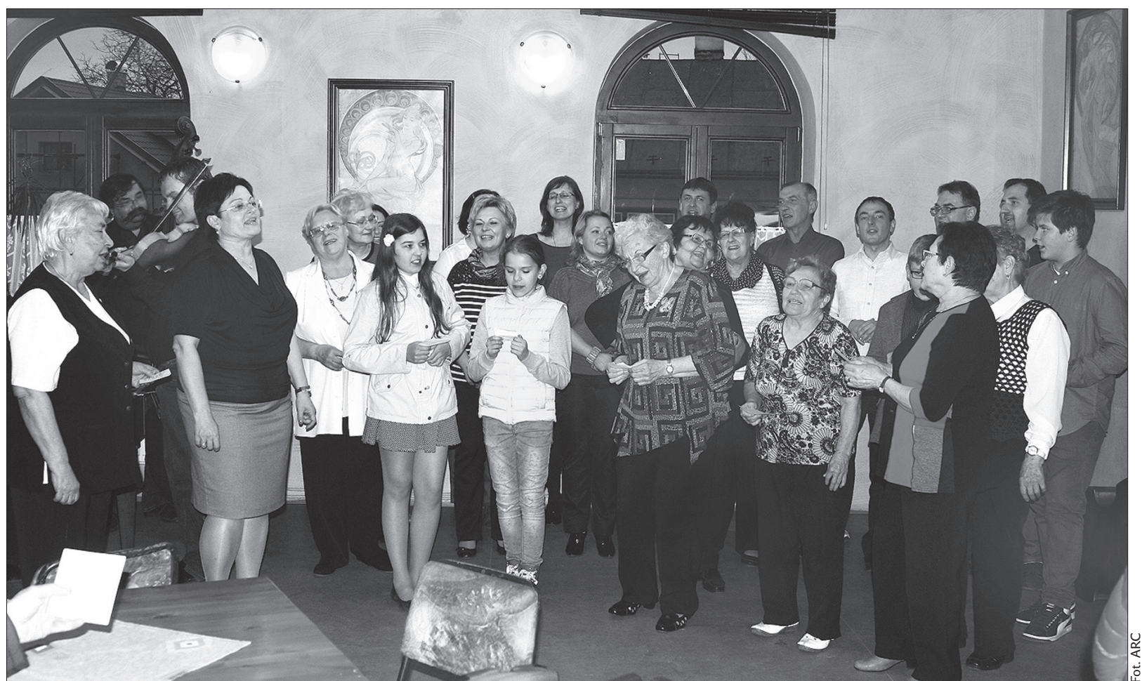
Na koncercie wystąpili przedstawiciele kilku pokoleń.