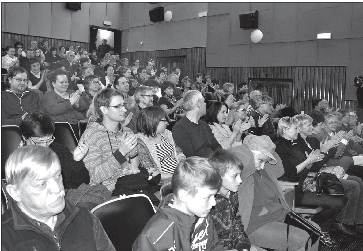
Publiczność nagrodziła film gromkimi brawami.