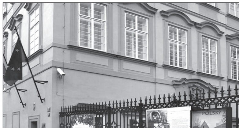
Ambasada Rzeczypospolitej Polskiej w Pradze.

W ramach konferencji przewidziane są dwa bloki. W pierwszym, który poprowadzą dziennikarz „Li-