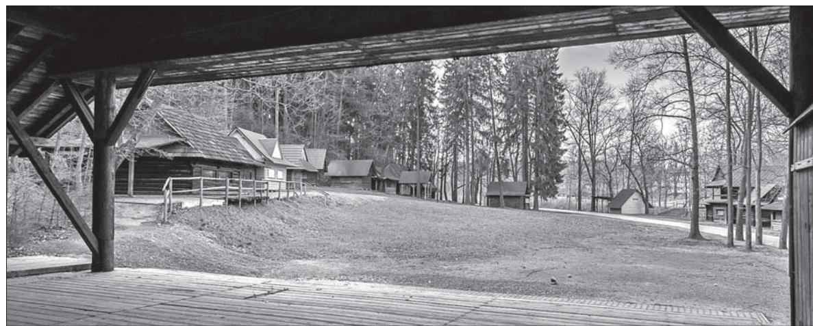
Plac w Lasku Miejskim ulegnie wielu zmianom.

a na sport 300 tysięcy. Największą dotację otrzymał zespół „Zaolzi – Zaolzioczek” w sumie 75 tysięcy koron, które mają zostać przeznaczone przede wszystkim na stroje. Z kolei po 16 500 koron otrzymają zespoły „Lipka” i „Rozmarynek”. Natomiast Fotoklub Jabłonków będzie miał do dyspozycji 20 tysięcy, zespół „Gorol” otrzyma 13 tysięcy, a Polski Chór Parafialny – 5000. (endy)