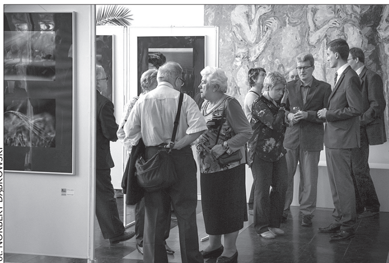
Wystawę można oglądać w Wielkiej Galerii teatru w Czeskim Cieszynie.