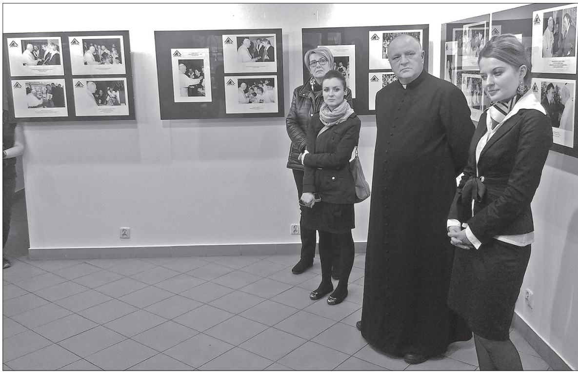
Wystawę można oglądać w galerii miejskiej na skoczowskim rynku.