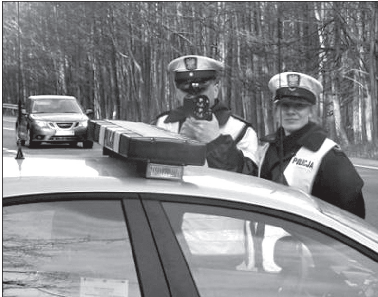
W Polsce wzrosły mandaty za wybrane wykroczenia w ruchu drogowym.

Kwietniowe zmiany w polskim prawie to jednak dopiero początek nowości. Znowelizowany kodeks drogowy przedstawiony przez Ministerstwo Spraw Wewnętrznych zakłada bowiem drastyczne zaostrzenie