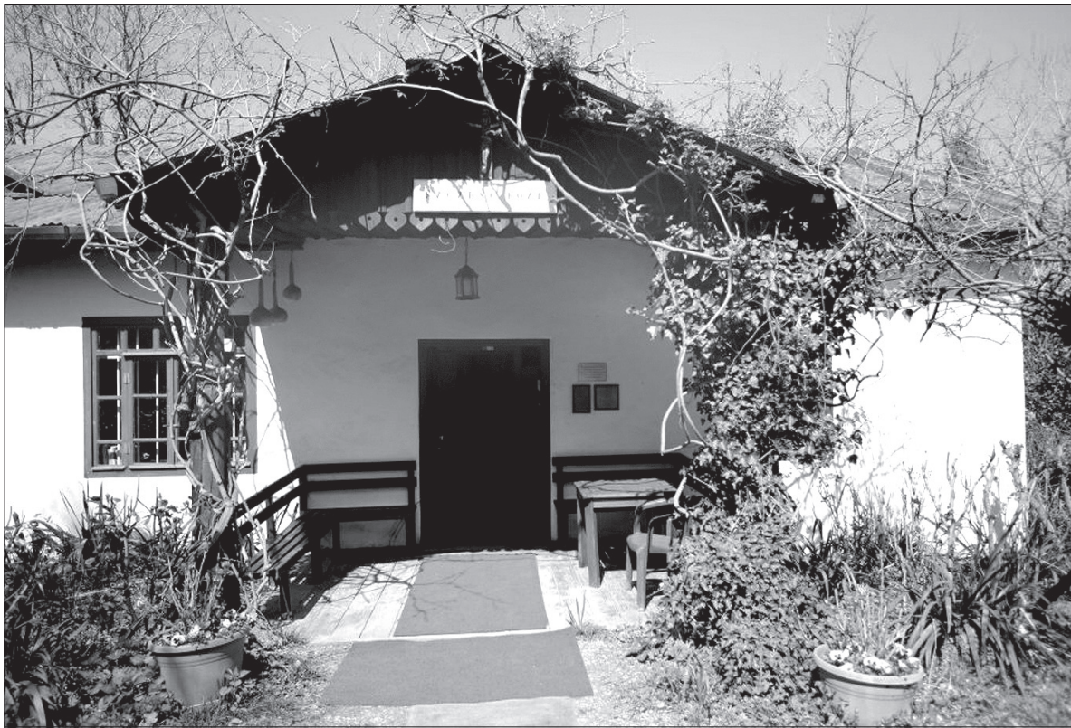
Dom Pamięci Zofii Ryży w Adampolu. Miejscowość w marcu tego roku odwiedził minister spraw zagranicznych, Grzegorz Schetyna.