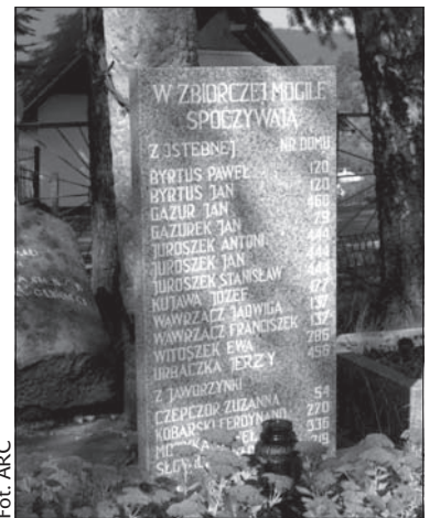
Ciała ofiar zbrodni z ostatnich dni II wojny światowej spoczywają na cmentarzu w Istebej.

Organizatorem uroczystości wspomnieniowych są władze Jabłonkowa i Istebej, Polski Związek Kulturalno-Oświatowy oraz Czeskich Związek Bojowników o Wolność. Uroczystość rozpocznie się o godz. 9.00 mszą św. w intencji pomordowanych w kościele pw. Dobrego Pasterza w Istebej. Po mszy na istebniańskim cmentarzu uczestnicy spotkania złożą kwiaty na grobie pomordowanych, zostanie poświęcona tablica upamiętniająca tamtą tragedię. Jabłonkowska część uroczystości rozpocznie się o godz. 11.30 od spotkania przy pomniku ofiar faszyzmu. Później na murze cmentarnym zostanie odsłonięta tablica pamiątkowa, odczytany bę-