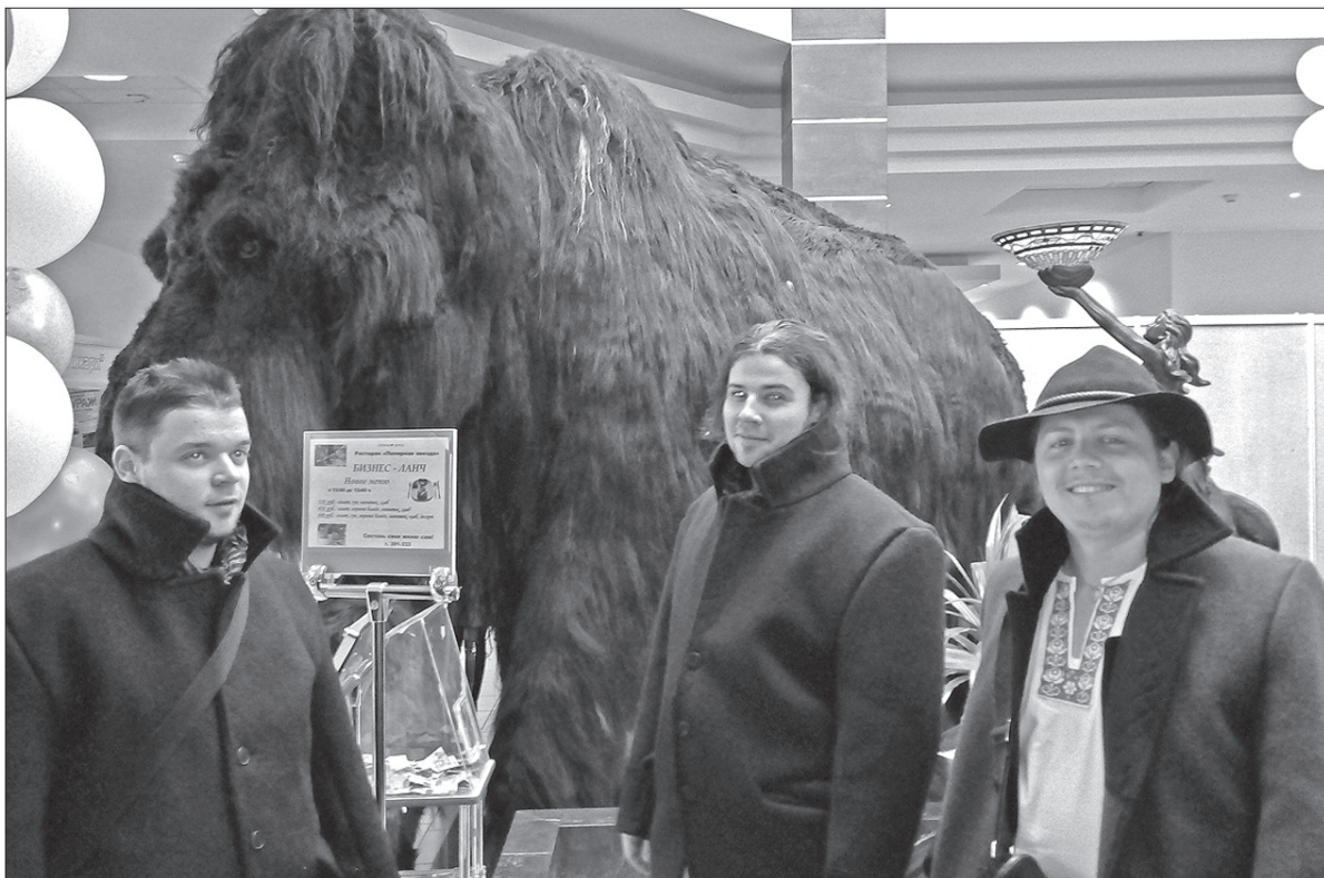
Zaolziacy rzadko mają okazję spojrzeć w oczy mamutowi.