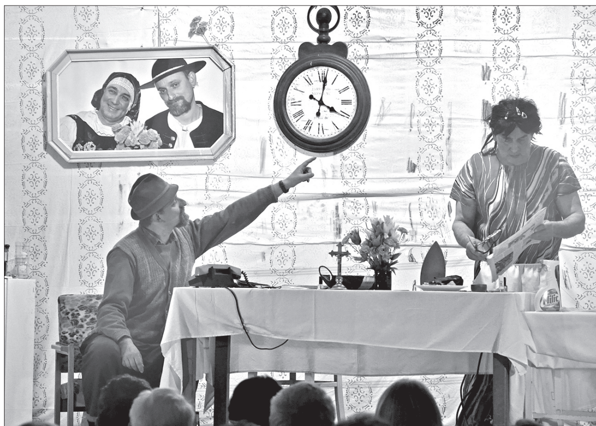
Wielkanocne przedstawienia teatralne w Łomnej Dolnej to już tradycja.

Ostatecznie PZKO-owscy aktorzy odnieśli spory sukces. W trakcie przedstawienia publiczność regularnie wybuchala śmiechem, a występ zakończyły burzliwe brawa. Grupie teatralnej gratulowała też wójt Łom-