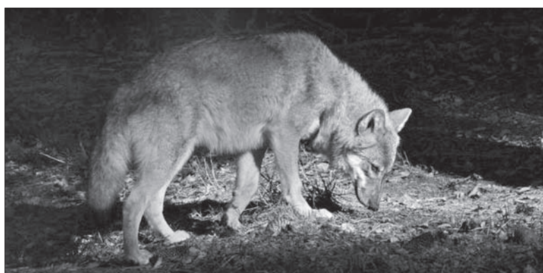
Drapieżniki zaczęły wracać w Beskidy.

Beskidzkie lasy zamieszkiwały kiedyś liczne duże drapieżniki: rysie, wilki, a nawet niedźwiedzie. Zostały przez człowieka wytępione już pod koniec osiemnastego wieku. Dopiero w ostatnich dziesięcioleciach drapieżniki zaczęły wracać w Beskidy. Mieszkańcy Śląska Cieszyńskiego, tak jak ich przodkowie, boją się drapieżników. Powodem tego strachu są fikcyjne historyjki, różne legendy i mity, a przede wszystkim brak wiedzy o życiu niedźwiedzi, rysia lub wilków, o tym, jak zachować się