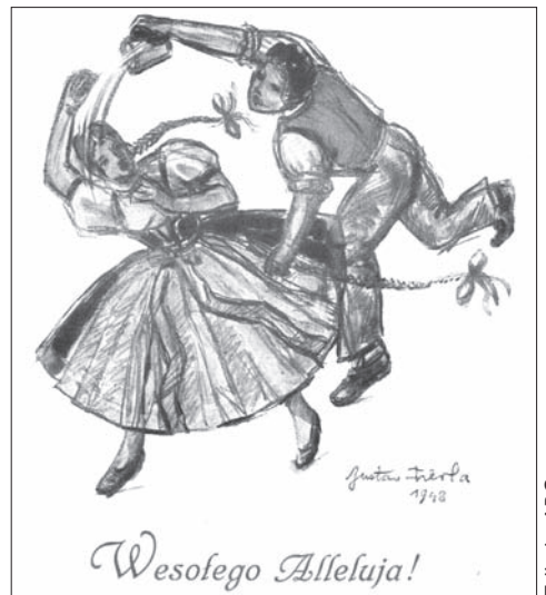
Gustav Fierla: Śmigus – Wydawnictwo Sekcji Literacko-Artystycznej PZKO w Czeskim Cieszynie, 1948 r., nr 5.

Obok tych artystycznych pocztówek rynek zalewany był artefaktami, schlebającymi popularnym gustom, zwanymi niekiedy kiecami. Tu spotykamy np. duże skorupki pisanek, w któ-