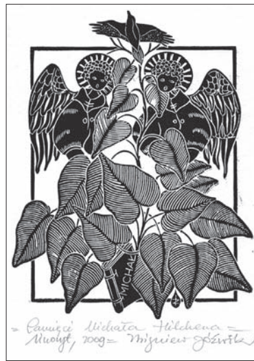
Grafika autorstwa Józefa Józwicka – „Pamięci Michała Hilchema” – linoryt, 2009 r.

Znakiem rozpoznawczym prac Zbigniewa Józwicka są motywy roślinne, które wiążą jego hobby z życiem zawodowym. Ulubioną techniką artysty jest drzeworyt, ale przede wszystkim linoryt, niekiedy sucha igła. – Linoryty cechuje swoista stylizacja i duży ładunek podtekstu literackiego, tak typowy dla wszystkich prac Zbigniewa Józwicka przemawiających w skupieniu do odbiorcy. Te prace, pełne poetyckiej zadumy nad światem, różnią się od wykonywanych przez niego ekslibrisów. Ukrywających często treść satyryczną. Powstały niejako dla siebie, z inspiracji