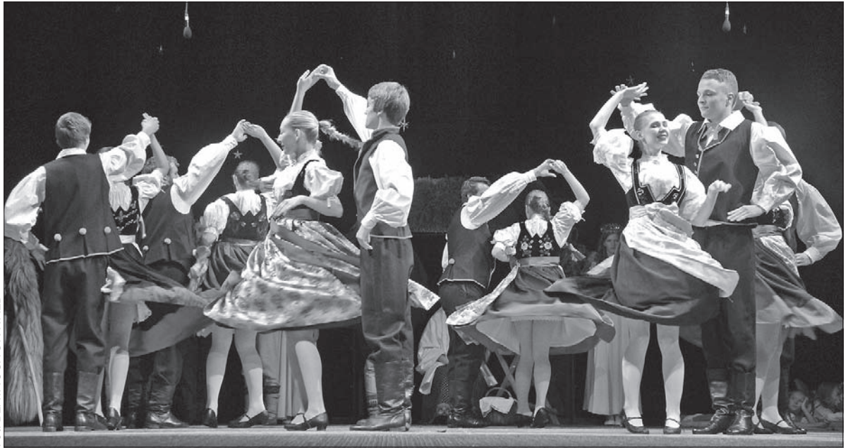
Zespół Regionalny „Błędowice” regularnie korzysta z dotacji miasta.

niez inną ważną dla polskiego środowiska inicjatywę. Działające przy Polskiej Szkole Podstawowej w Błę-