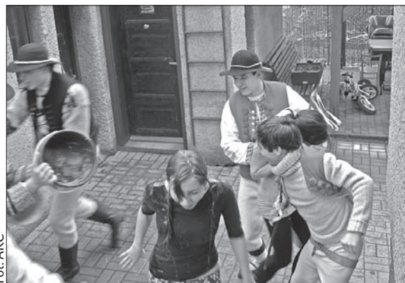
Lodowata, zimna woda z Głuchówki.