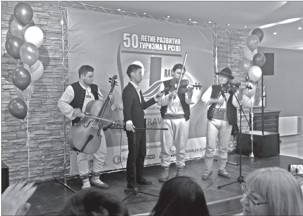
„Lipka” na festiwalowej scenie.

Telefon był niemalże anonimowy, organizatorzy imprezy w Jakucku dowiedzieli się o „Lipce” od jednego z zespołów rosyjskich, którego członkowie spotkali się z Zaolziakami przed kilkoma laty na festiwalu w Czeskich Budziejowicach. Myśleli, że „Lipka” to nadal kapela dziecięca, a impreza w Jakucku była festiwalem właśnie dziecięcym. Któż by pomyślał, że przez te kilka lat muzycy wydorosli, a tamte dziewczynki noszą już stroje kobiece. – W dodatku w ubiegłym roku pożegnaliśmy się z dziewczynami, o dziwo, w zgodzie.