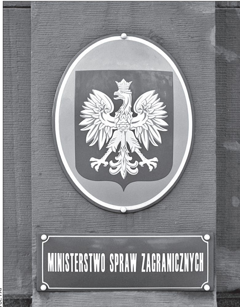
Ministerstwo Spraw Zagranicznych najczęściej pieniędzy przeznacza na pomoc Polakom na Wschodzie.

Na projekty dotyczące infrastruktury polonijnej wydano łącznie 8,8 mln zł. Najwięcej przeznaczono na inwestycje na Litwie, potem w Czechach i na Ukrainie. Na kolonie w kraju dla dzieci polonijnych przeznaczono łącznie 7,5 mln zł; MSZ dofinansowało 24 projekty, dzięki którym na kolonie do Polski przyjechały dzieci z 15 krajów świata, głównie z państw postradzieckich, Europy Środkowej i Niemiec. Największe