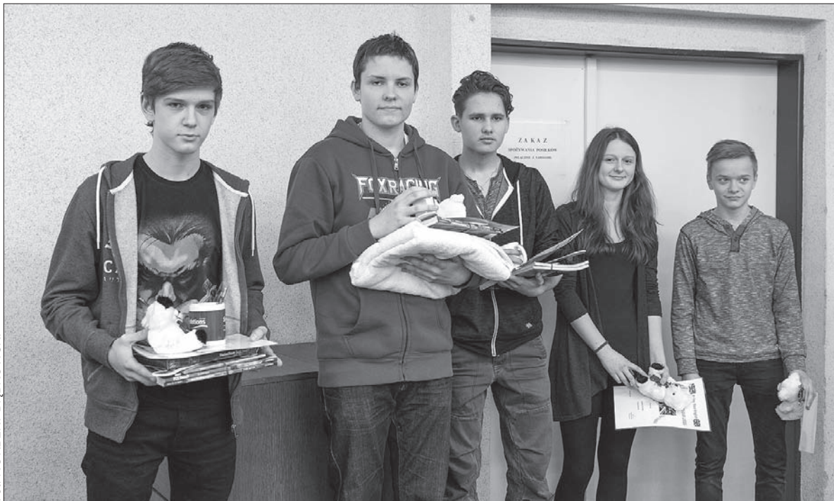
Zdobywcy pięciu pierwszych miejsc konkursu Enjoy Your English 2015.

Orłowski konkurs chórów dziecięcych to część ogólnokrajowego konkursu odbywającego się w różnych miastach Republiki Czeskiej. Do późniejszego krajowego przeglądu, już nie konkursowego, zaprasza się potem po jednym zespole z każdego regionu. Chórzyci polskiej szkoły z Czeskiego Cieszyna dostąpili tego zaszczytu już trzykrotnie. (ep)