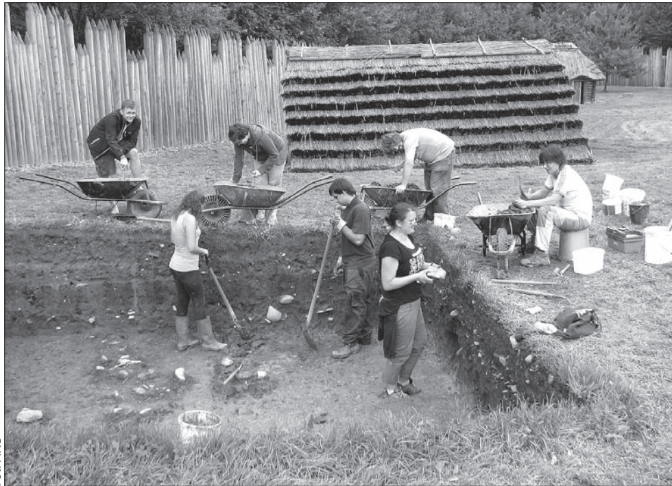
Ekipa archeologów podczas ostatnich wykopalisk w Podoborze.

Sam projekt powstawał znacznie wcześniej, plany budowy Archeoparku stworzono już w latach 90. Kiedy rozpoczęłam tam pracę, projekt był już gotowy i nasze badania poprzedziły budowę tego obiektu. Później także większość badań archeologicznych prowadzono pod kątem budowy przyszłego Archeoparku.