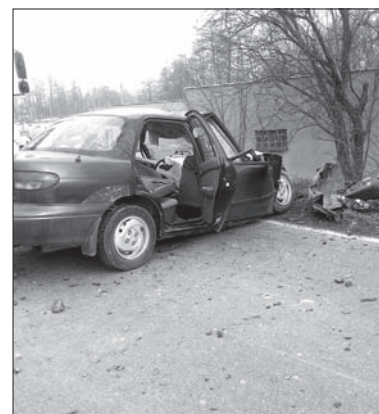
Tragiczny wypadek w Suchej Średniej.

– Test nie wykazał u kierowcy ciężarówki alkoholu w wydychanym powietrzu. Przyczyny wypadku badają funkcjonariusze policji drogowej oraz wydziału kryminalnego – powiedziała rzeczniczka Powiatowej Komendy Policji RC w Karwinie, Zlataše Viačková. (kor)