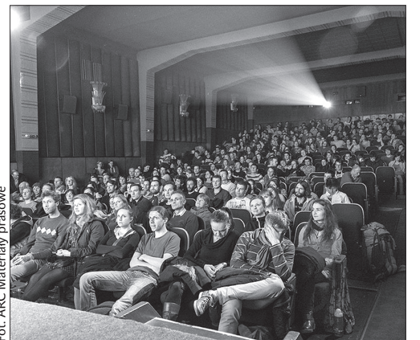
Premierowe seanse „Ekspedycji z kamerą” odbyły się w Pradze.