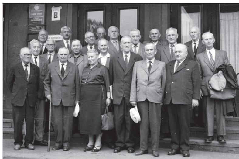
Zarząd KNE przed hotelem „Piast” w Czeskim Cieszynie w 1966 roku.