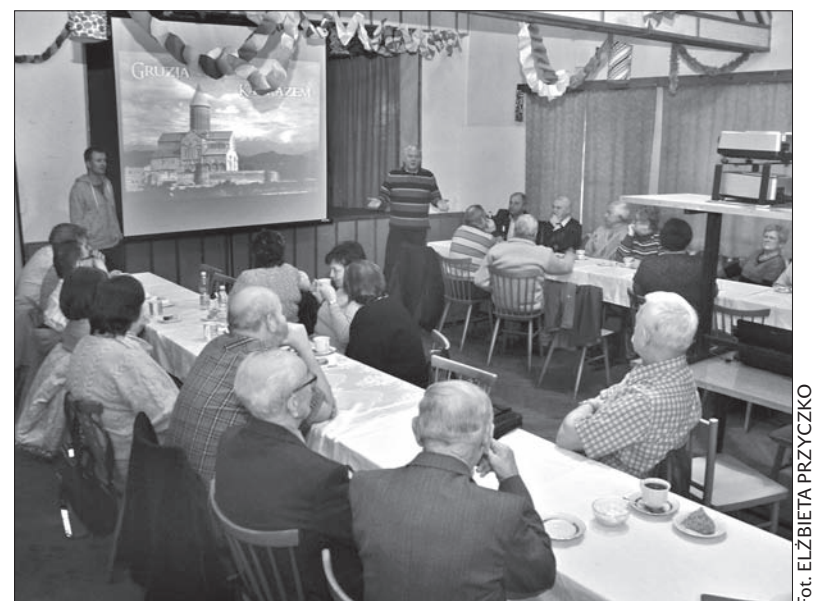
Z audiowizualną prezentacją o podróży po Gruzji „Gorole” przyjechali tym razem do Koła PZKO w Karwinie-Starym Mieście.

W czasie prelekcji słuchacze „odwiedzili” też m.in. jeszcze bardziej opustoszałą niż Tuszettia Chewsurretię, pogranicze Czeczenii i Dagestanu, Osetię Południową, Uplisycche – starożytne skalne miasto czy