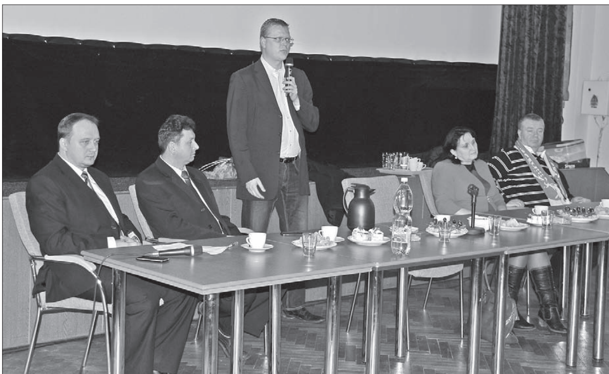
W sobotę z mieszkańcami Jabłonkowa i okolicznych miejscowości spotkał się wicepremier Pavel Bělobrádek, przewodniczący KDU-ČSL.

– W ciągu ostatniego roku, kiedy jesteśmy w rządzie, udało się dosyć dużo osiągnąć m.in. obniżyć podatki dla pracujących rodziców, a przed nami kolejna sprawa: waloryzacja emerytur. W ministerstwach rolnictwa i kultury udało się uzyskać spore oszczędności rzędu setek milionów koron. Kolejny plus jest taki, że się w rządzie nie kłócimy, a na funkcjonowanie i popularność obecnego rządu na pewno ma wpływ także to, że nie zdarzyły się żadne skandale, żadne „wpadki” – mówił Bělobrádek. – Ja w ramach swojej funkcji staram się powołać nowy urząd czy też ministerstwo do spraw nauki i badań naukowych. To jest najlep-