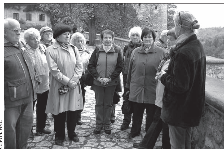
Nauczyciele-emeryci na wycieczce w Ojcowskim Parku Narodowym.