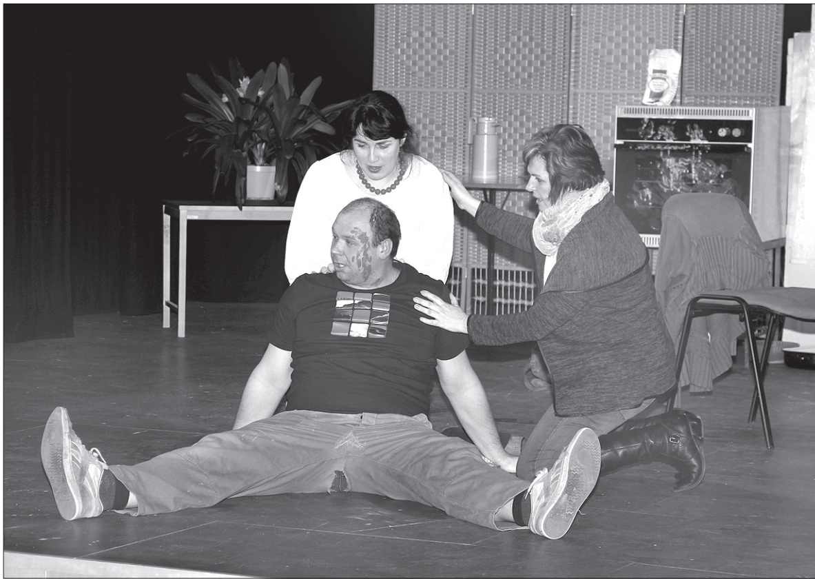
Goście sobotniego „Spotkania z komedią” zaśmiewali się do łez w czasie występu zespołu teatralnego z Ligotki Kameralnej.

Po rozdaniu nagród twórcom najsympatyczniejszego wizerunku Zeflika na gości imprezy czekały dwie jednoaktówki gwarowe w wykonaniu aktorów z Ligotki Kameralnej. Wi-