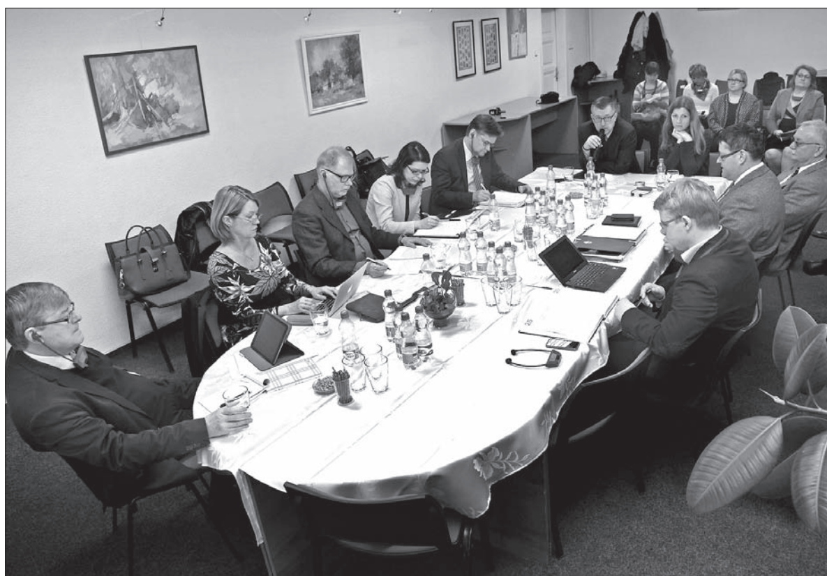
Wczoraj w siedzibie Kongresu Polaków odbyło się spotkanie monitorujące stosowanie w praktyce europejskiej karty językowej.