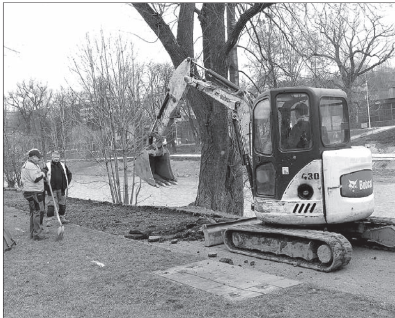
Na nabrzeżu Olzy w Czeskim Cieszynie ruszyły prace budowlane.

Brzegi granicznej rzeki Olzy w Czeskim Cieszynie ulegają kolejnym przemianom. Po zimowej przerwie na nabrzeże powrócili budowlancy, by kontynuować budowę prowadzącej wzdłuż rzeki nowej ścieżki rowerowej. Wszystko w ramach projektu „Ogród dwóch brzegów”. Już podczas tegorocznych wakacji z nowej ścieżki będą mogli korzystać rowerzyści. Rolkarze na pewno z radością przywitają odnowiony chodnik, rodziny zaś dwa nowe