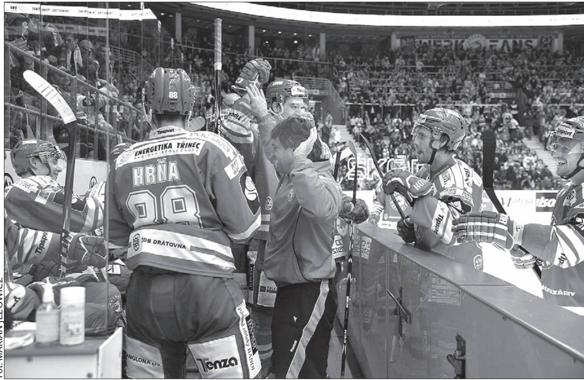
W Trzyńcu panuje pełne zadowolenie. Zespół wypatruje już ćwierćfinałów.

W Trzyńcu celebryją od niedzieli zdobycie Pucharu Prezydenta przyznanego najlepszej drużynie fazy zasadniczej. Dla Stalowników to