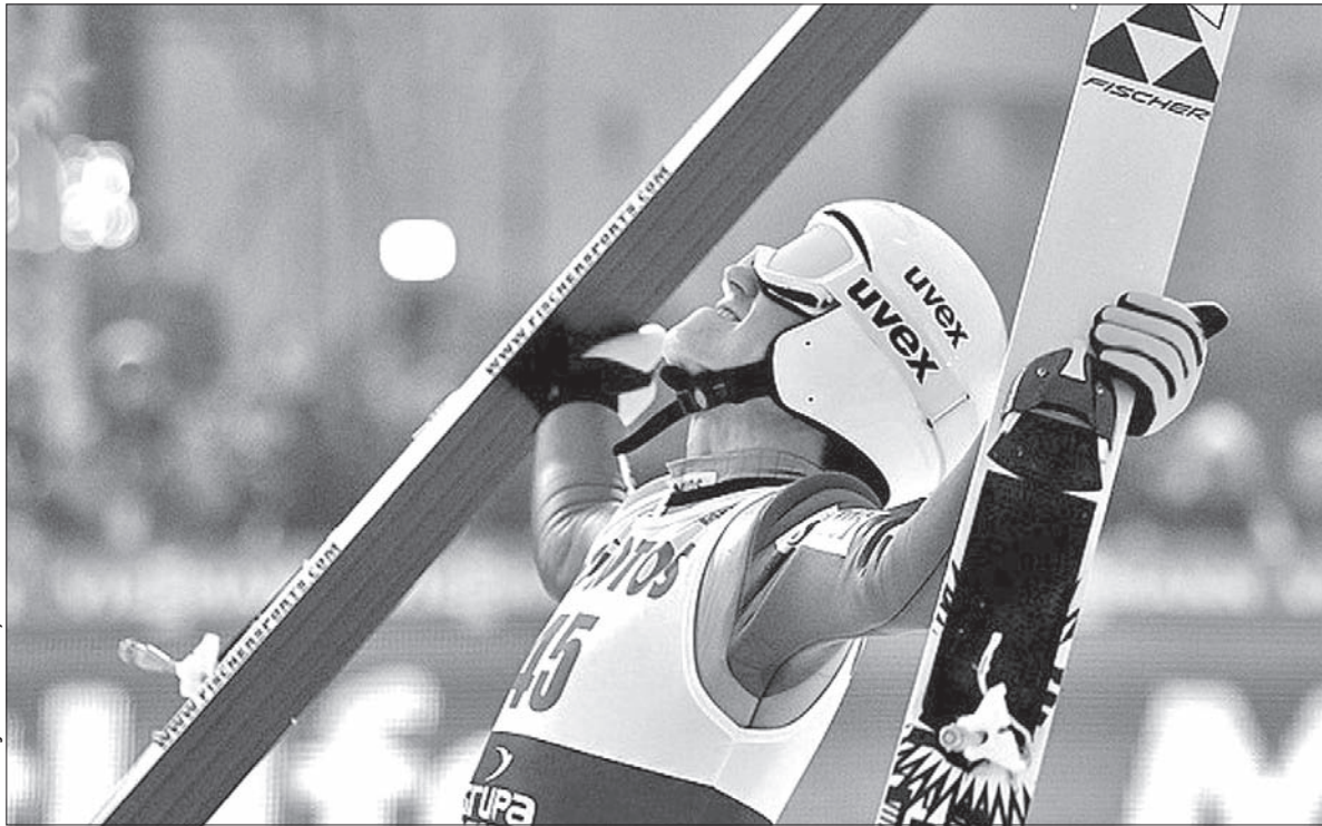
Szczęśliwy Kamil Stoch. Niebiosa tak chciały.

Kamil Stoch wygrał w Zakopanem w pięknym stylu, oddając skoki na odległość 134 i 133 m. – Jeszcze brakuje mi do pełnej perfekcji, ale najważniejsze, że czynię postępy. Chciałem dziś zaśpiewać z kibicami hymn, stojąc na podium. I to mi się udało – podkreślił dwukrotny mistrz olimpijski z Soczi. W Zakopanem odbyła się w niedzielę jedna z najbardziej frapujących odsłon tego sezonu. Wszyscy zawodnicy zgodnie przyznali, że warunki do skakania były prawie idealne. Takiego komfortu w kapryśnym z powodu po-