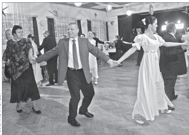
„Olzianie” zaprosili balowiczów do poloneza.