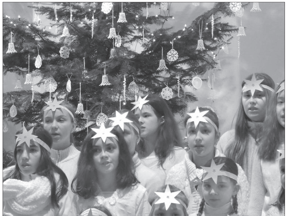
Świąteczny klimat utrzymuje się w Wędrzynie.