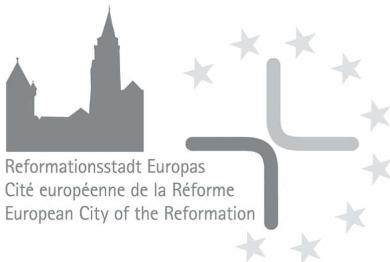
Oficjalne logo obchodów.

Choć głównym partnerem projektu jest parafia ewangelicko-augsburska, ubieganie się Cieszyna o tytuł