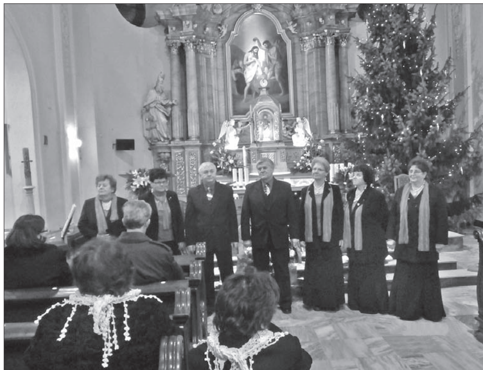
Występ zespołu śpiewaczego „Olzanki”.