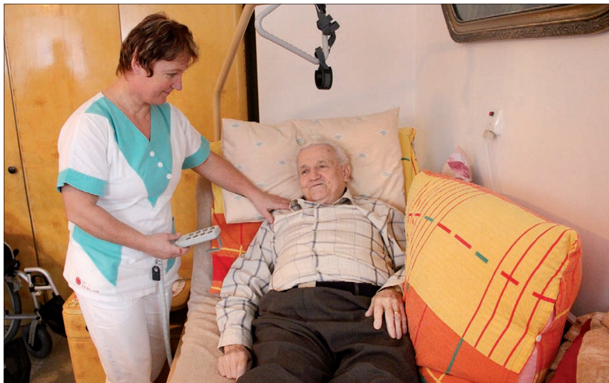
Elektronicznie sterowane łóżka to duża pomoc dla personelu i pensjonariuszy Domu Seniora w Gnojniku.