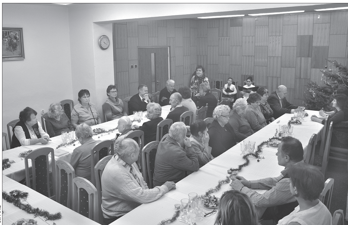
Wigilijka upłynęła w rodzinnej atmosferze.

Z referatu sprawozdawczego wynika, że koło liczy 75 członków, a aktywnie działają chór mieszany oraz zespół kobiet. Do udanych imprez w roku ubiegłym należały Bal Retro, wycieczka do Chlebowic, Sztramberka i Bolacic, świetlica wiosenna z prelekcją i zabawami dla dzieci. Dolnolutyńskie MK PZKO współpracuje z sąsiednimi Kołami w Rychwałdzie, Wierzniowicach i Orłowej-Porębie, członkowie biorą udział w imprezach zaprzyjaźnionych kół. Chórzyści zaliczyli 16 występów, m.in. w kościele w Lutyni Dolnej, Rychwałdzie,