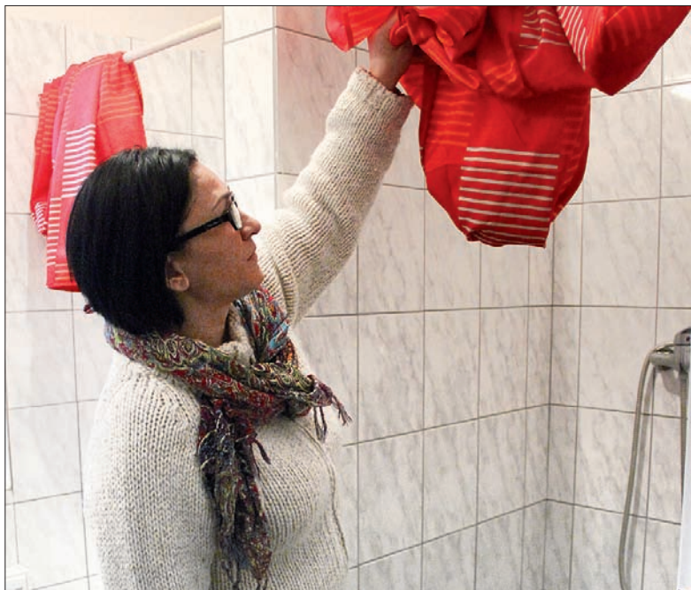
Łazienka w ośrodku dziennym dla bezdomnych w Boguminie służy tym, którzy nie mają się gdzie umyć.