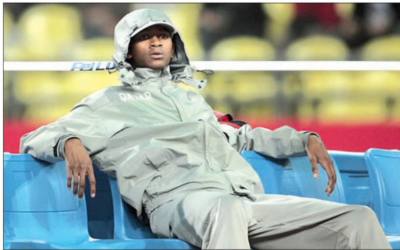
Do gwiazd Beskidzkiej Poprzeczki zalicza się Katarczyk Mutaz Essa Barshim.

Morawska Tour rozpocznie się 24 stycznia w Hustopeczach, finał zaś odbędzie się 8 lutego w Trzyńcu. Hala, która na co dzień rozpieszcza hokeistów, na parę godzin pozwoli sięgnąć po rekordy w jednej z najbardziej popularnych dyscyplin lekkoatletycznych. Każdy z przystanków Morawskiej Tour posiada jedną gwiazdę. W Hustopeczach zaprezentuje się znakomity Rosjanin Iwan Uchow, który w tym