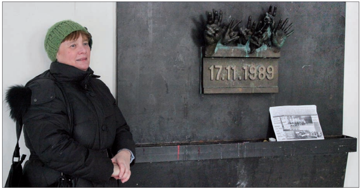
To miejsce powinien znać każdy mieszkaniec Republiki Czeskiej, niezależnie od narodowości.