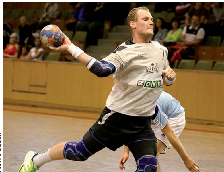
Banik zaliczył zawałowy mecz ze szczęśliwym końcem.

Pierwsza połowa wróżyła kolejny dramat Banika. Karwiniacy prowadzili w statystykach błędów technicznych, słabo spisywali się w ataku, a także w czynnościach defensywnych. Rumieńców nabrała gra Banika po przerwie. Co takiego działo się w szatni w przerwie? – Powiedziałem zawodnikom, że tak dalej być nie może. Chłopcy wyciągnęli wnioski ze swojej słabej gry, ograniczyli błędy do minimum,