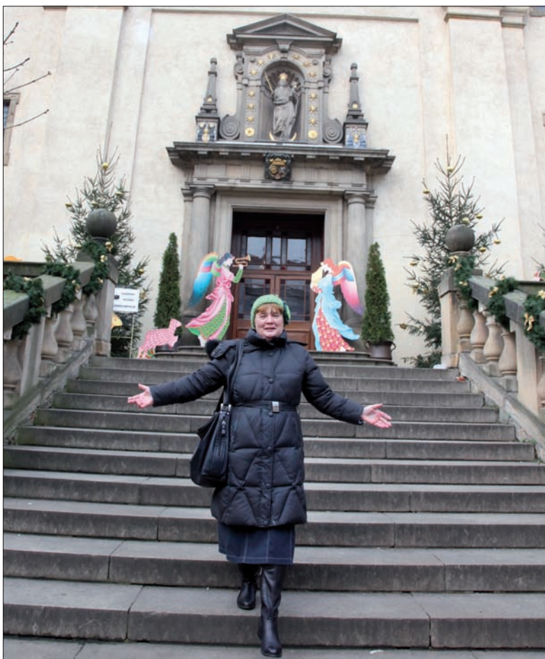
Praskie Jezulątko „mieszka” w kościele Matki Boskiej Zwycięskiej.