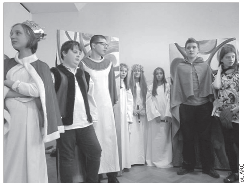
Program artystyczny przygotowała grupa teatralna „Bum-Trach” z podstawówki w Czeskim Cieszynie.