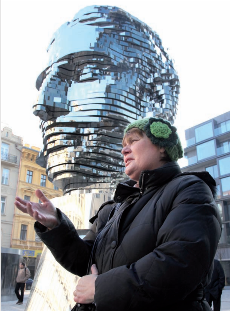
Pomnik Kafki to jedna z najnowszych atrakcji stolicy.

„poaksamitnoremowolucyjna” historia Republiki Czeskiej. To tu 17 listopada 1989 roku milicja brutalnie stłumiła pokojową demonstrację studentów. Przypomina o tym tablica na jednym z domów i wykonane z brązu symboliczne „gołe ręce”.