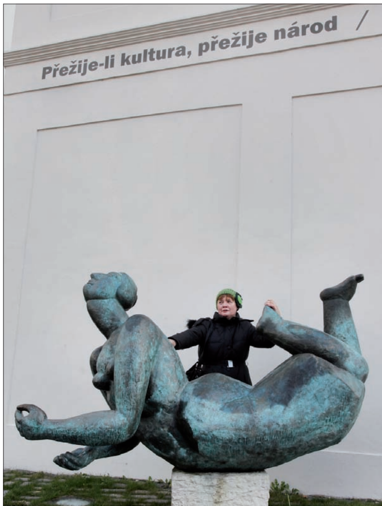
Mlýnský čaroděj przyciągają miłośników sztuki.

miesiącem, po raz pierwszy go widzę i bardzo mi się podoba. To kolejna atrakcja nie tylko dla turystów. Zresztą tzw. Szlak Kafkowski, proponowany przez praskich przewodników, jest wśród turystów z Polski jednym z najpopularniejszych. Bo wycieczki już sobie wybierają, ludzie nie chcą tych klasycznych tras typu „przez Hradczany do Orloja”.