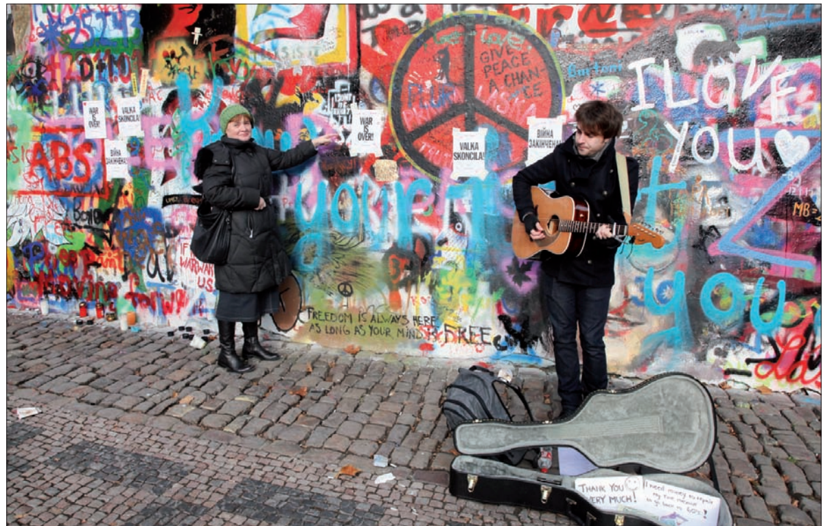
Mur Johna Lennona przyciąga prażan i turystów od ponad trzydziestu lat.

zaś podarował Jezulątku papież Benedykt XVI podczas swojej wizyty w Pradze w roku 2009 – uściśla.