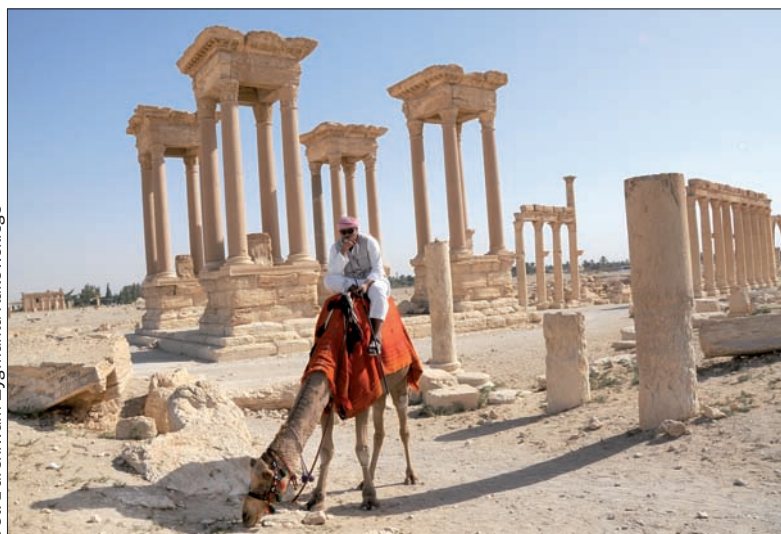
Palmyra – perła pustyni w Syrii.

Pierwszą dłuższą podróż odbyłem w 1974 roku – wyjechałem służbowo na Ukrainę. Wtedy taki wyjazd wydawał się wręcz „egzotyczny”, dziś ma zupełnie inny wydźwięk. W Makiejewce, gdzie mieścił się instytut górniczy, w którym kilkakrotnie bywałem, teraz toczą się walki. W 1974 roku odbył się tam kongres ONZ na temat bezpieczeństwa pracy w górnictwie. Zajmowałem się wtedy niebezpiecznymi erupcjami węgla i gazu w kopalniach, więc wydelegowano mnie na ten kongres razem z czeską delegacją. Na miejscu to była klasyczna wieś potiomkinowska! W życiu nie widziałem tak wypolerowanej kopalni – na dole chodziliśmy po kopalni w białych ubraniach, wszystko było na pokaz.