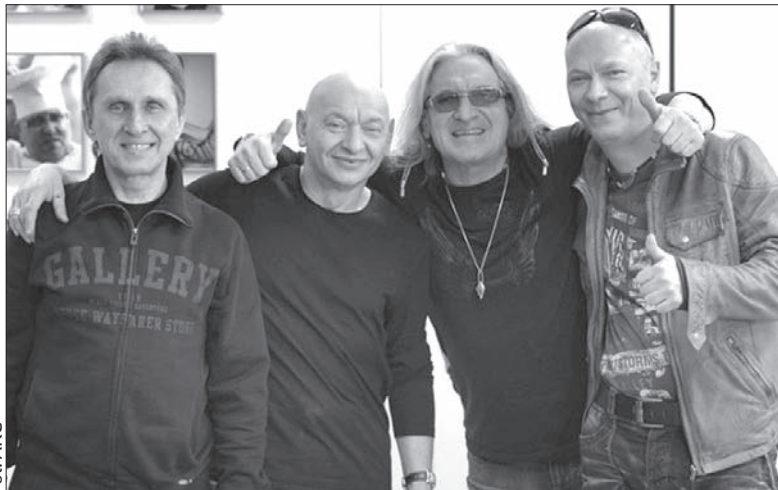
Zespół Perfect zagra 2 maja 2015 w Karwinie.

Bilety na Dolański Gróm 2015 są już w sprzedaży w sieci www.ticketportal.cz . (wik)