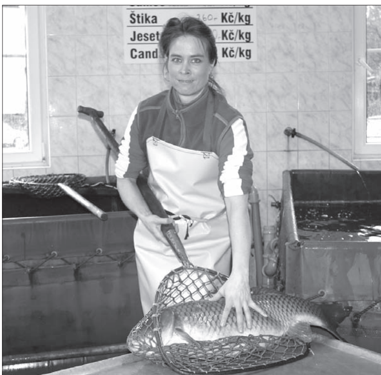
Dziś coraz mniej klientów zabiera do domu żywe karpie. W Kocobędzu tylko dwaj z dziesięciu.