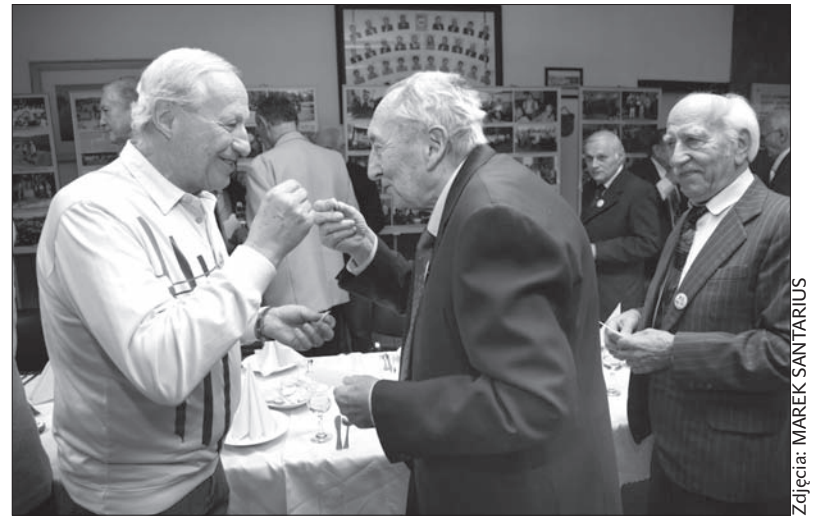
Zdrowia – tego głównie życzyli sobie klubowicze.