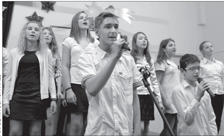
Wykonawcy koncertu świątecznego górnosuskiej szkoły-jubilatki.

wspólną imprezą będzie jubileuszowy bal szkolny w lutym przyszłego