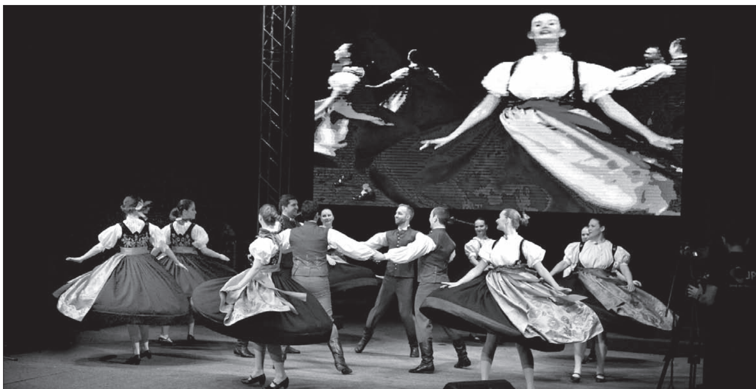
Zespół „Olza” kilka razy pokazał próbkę swoich nieprzeciętnych umiejętności.