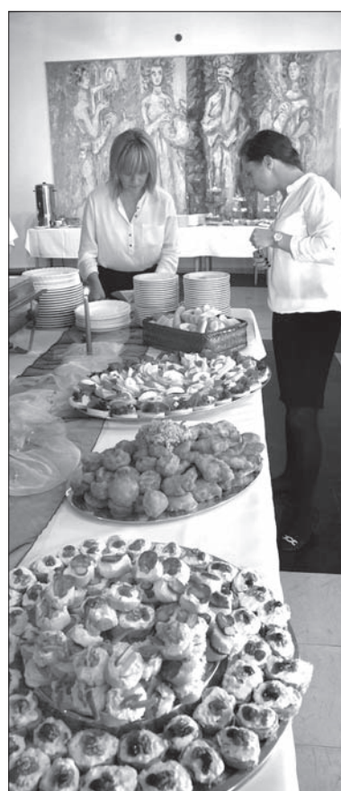
Nie tylko kulturą człowiek żyje...

Zebranych w teatrze widzów, nominowanych i ich rodzin nie trzymał dłużej w niepewności. Nagrody trafiły do zwycięzców, przyszły oklaski, emocje opadły. Jak przy-