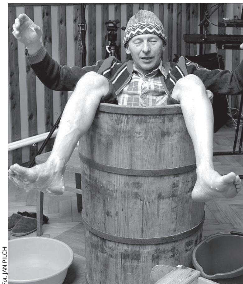
Jak widać na zdjęciu, zabawa była przednia...