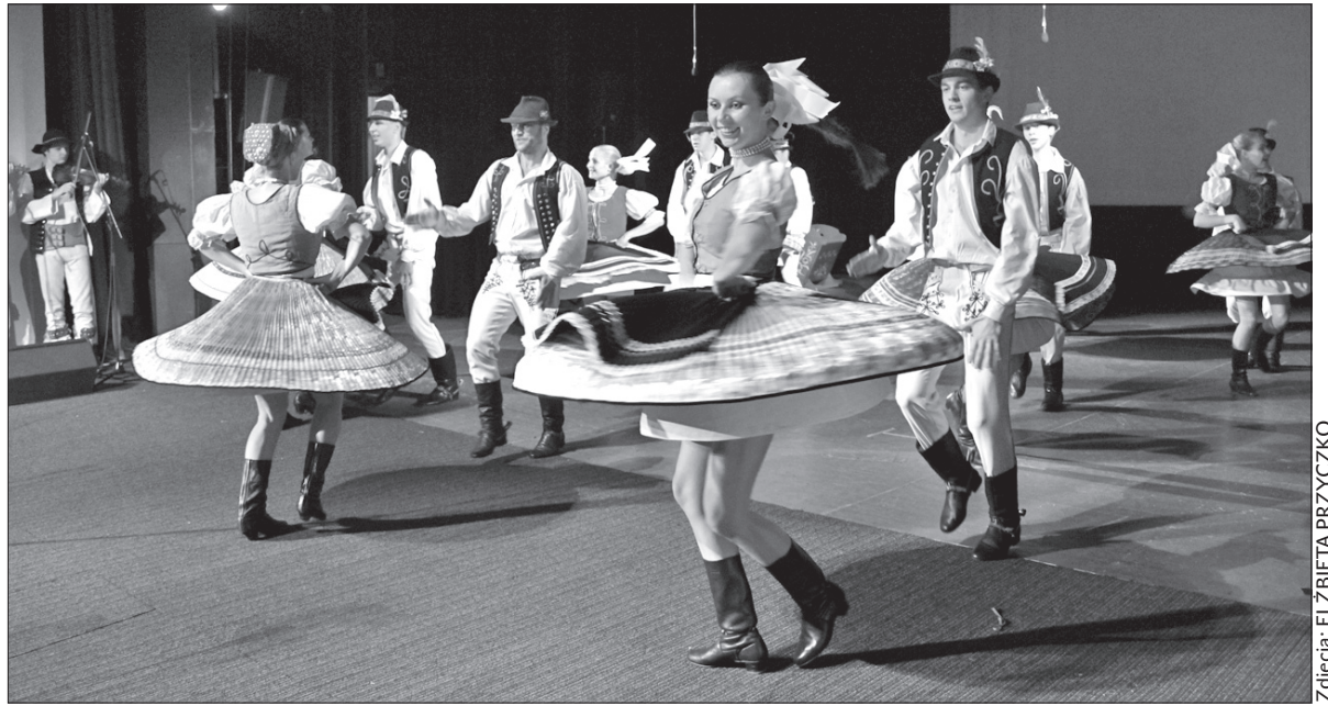
W czasie jubileuszowego występu tancerze „Bystrzyca” zaprezentowali także tańce słowackie.

Na wielki jubileusz obie grupy zaprosiły na scenę także były członków. Przypominano dzieje zespołów, byłych kierowników, choreografów, współpracowników. Tancerze przewracali strony symbolicznych kronik zespołów, pokazywano zdjęcia, wspomniano. Najlepiej jednak wspominało się... przy tańcu. W czasie trwającego ponad dwie godziny występu na scenie spotkały się czasem całe rodziny. Tańczyli i śpiewali starsi, młodszy i maluchy. Były tańce cieszyńskie, żywieckie, podhalańskie, polskie tańce narodowe, tańce słowackie, a nawet hiszpańskie flamenco. W ostatniej części programu zapre-