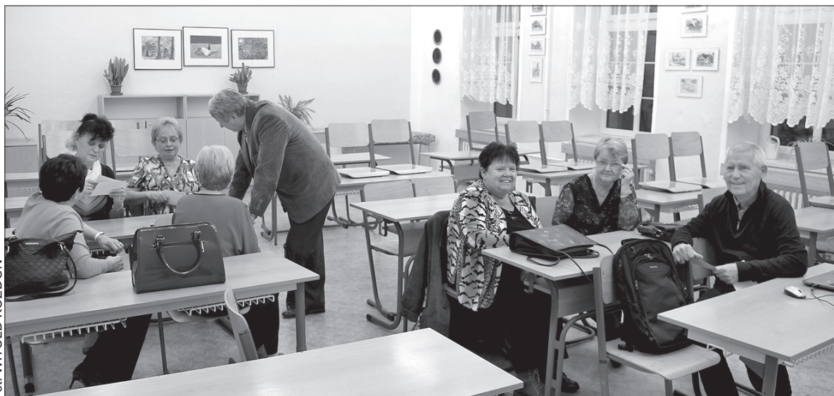
Uczestnicy zjazdu spotkali się w szkolnych klasach w dawnym gronie.

W innej sali spotkali się absolwenci z 1979 roku. – Tam, gdzie kiedyś