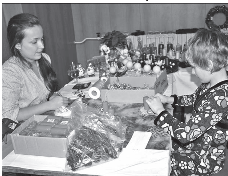
Podczas warsztatów dzieci wykonywały świeczniki.

Już w najbliższą niedzielę rozpocznie się Adwent. Wieńce adwentowe były jednym z głównych artykułów, które można było kupić na przedświątecznych targach w Domu PZKO w Wędryni, połączonych z warsztatami dla dzieci. W stoisku przygotowanym przez kwiaciarnię w Bystrzycy można było nabyć nie tylko klasyczne wieńce z gałązek drzew iglastych, ale też wyroby z alternatywnych materiałów – wikliny, juty, drewna. Nie wszystkie wieńce były okrągłe. – Ja na przykład ustawię u siebie w domu podłużny „wieńiec”, którego podstawa wykonana jest z brzoźowego drzewa – zdradziła obsługująca stoisko młoda kobieta. – Wieńce można zrobić z najróżniejszych materiałów, wszystko zależy od indywidualnego gustu oraz od stylu wyposażenia