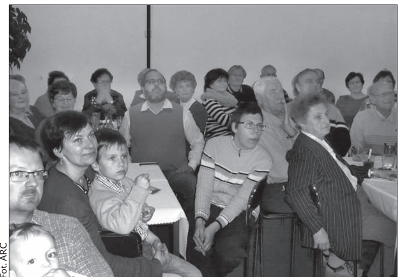
Uczestnicy imprezy z uwagą słuchają opowieści na temat potraw w innych krajach.