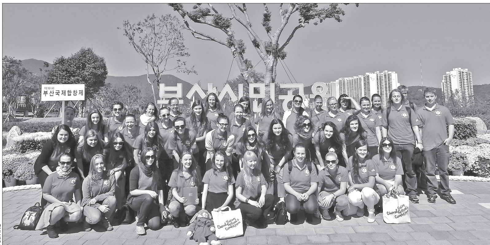
Karwiński „Permonik” w Korei Południowej.

Ola: Na wieczorku powitalnym, na którym spotkały się wszystkie chóry, sam nasz wygląd zwracał uwagę. Bez przerwy chodzili za nami, robili nam zdjęcia, pytali, skąd jesteście. Na ulicy też się w nas wpatrywano. Podczas występów w kategorii etnicznej każdy zespół był zupełnie inny – tam każdy się wyróżniał. To, czym się jednak „Permonik” różnił od zespołów z tamtej części świata, to stroje ludowe. Nasze regionalne stroje są w porównaniu z tymi azjatyckimi bardzo proste – inne chóry miały ubiory niezwykle bogate, kolorowe, świecące, wszystkie chórzystki miały tak samo pomalowane paznokcie, taki sam makijaż, fryzurę.