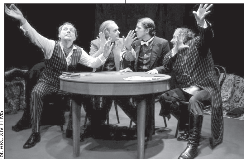
Jutro można będzie obejrzeć „Graczy” Gogola.

W wieczornym festiwalowym programie przewidziano takie sztuki, jak „Piąta strona świata” Kazimierza Kutza, którą wystawi dziś o godz. 19.00 Teatr Śląski im. S.