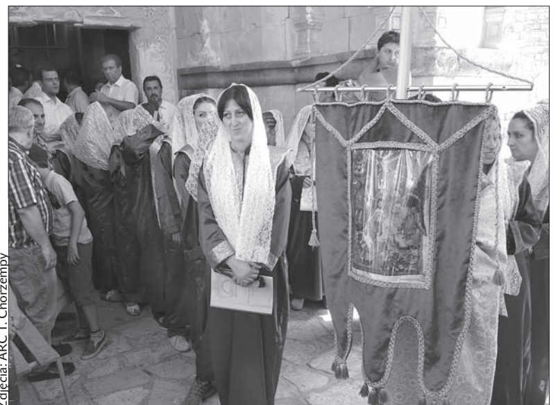
Uroczysta procesja ku czci św. Tadeusza.