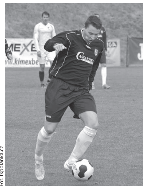
Piłkarze Wędryni zdobyli trzy punkty w Polance.