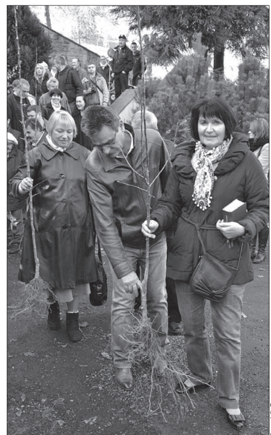
Po takiej akcji wszyscy parafianie byli na pewno zadowoleni.