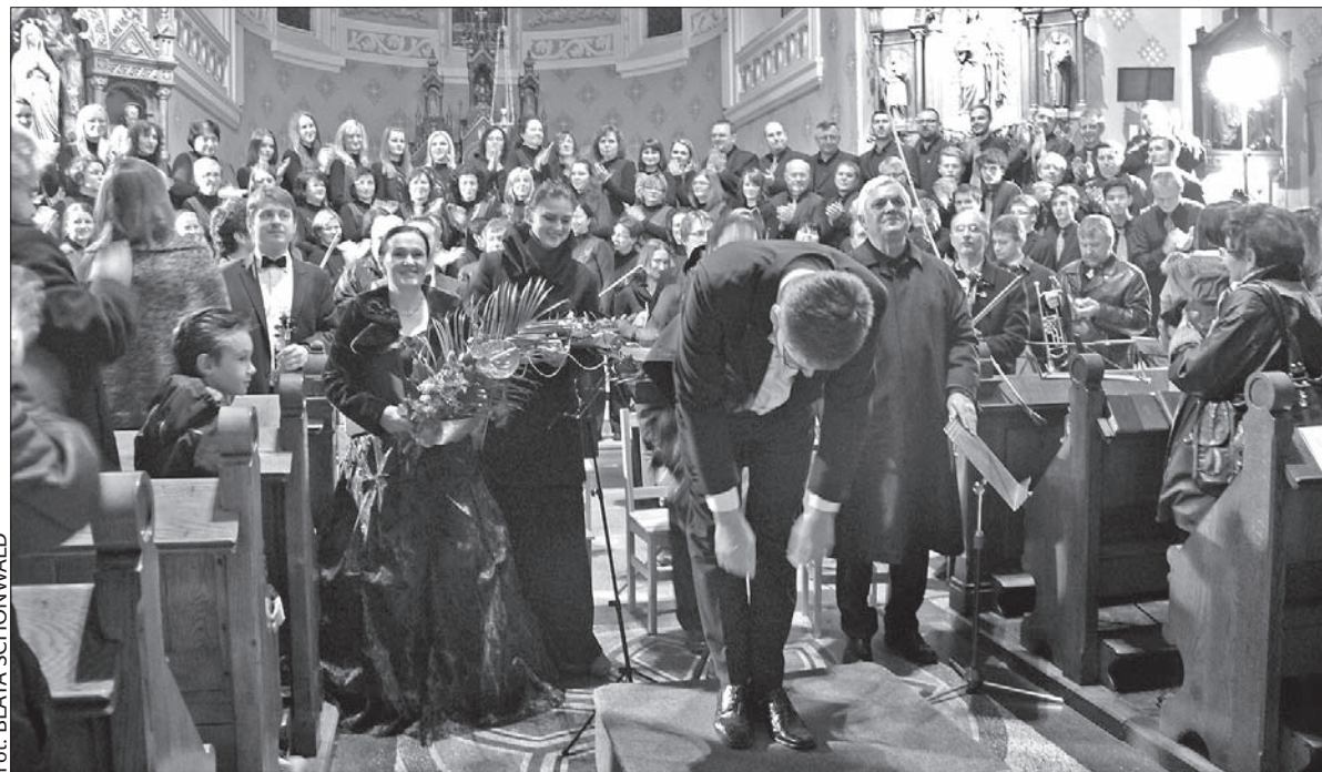
„Requiem” W.A. Mozarta wykonał 80-osobowy chór, orkiestra i soliści.

Projekt jest finansowany ze środków Ministerstwa Edukacji Narodowej przeznaczonych na realizację zadania: „Organizowanie w kraju i za granicą doskonalenia zawodowego nauczycieli prowadzących nauczanie języka polskiego, historii, geografii, kultury polskiej oraz innych przedmiotów nauczanych w języku polskim za granicą”. Zgłoszenia należy przysyłać na adres dwujezycznosc@dompolonii.pl do 20 bm. (sch)