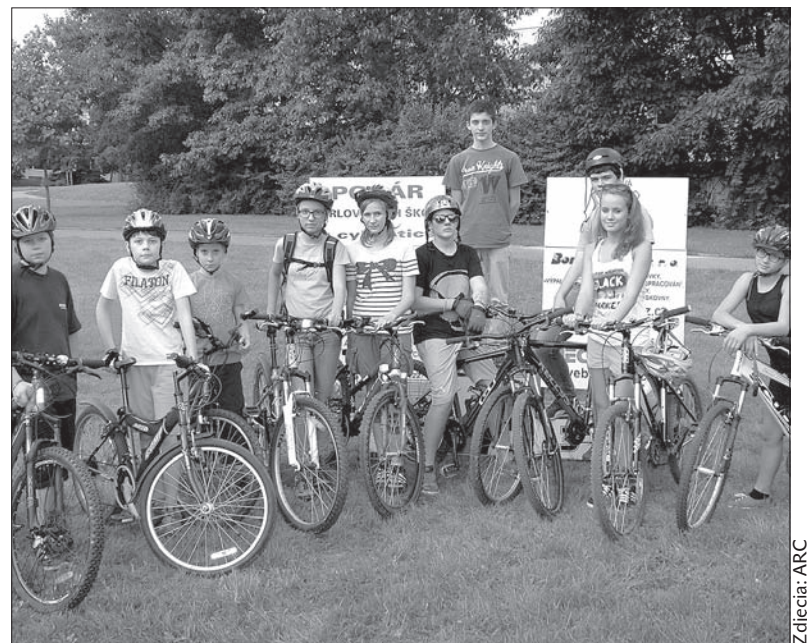
Za kilka lat wygramy Tour de France!