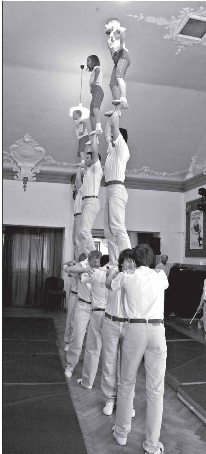
Wędryńscy Gimnastci podczas występu w „Czytelni”.

Gdy było trzeba zbudować dla siebie dom, zbudowali sobie „Czytelnię”. Dla jej obrony nauczyli się już przed wojną sięgać po pomoc do Polski, a dla ratowania jej zbiorów nie wahali się ryzykować i narażać życia podczas drugiej wojny światowej. A było wiadomo – kto dotknął „Czytelni”, dla tego był przeznaczony obóz koncentracyjny, więzienie, wywózki. Dotknięci „Czytelnią” leżą też w Katyniu, Miednoje i Charkowie.