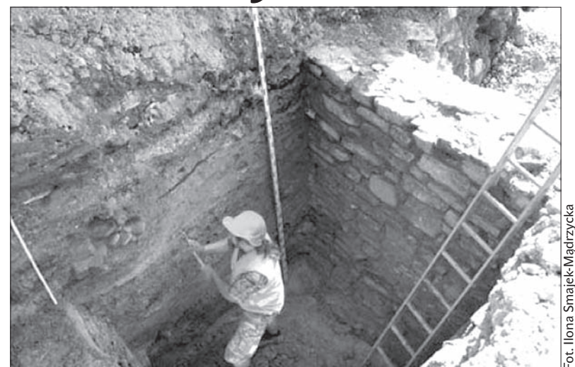
Pod schodami łączącymi ul. Śrutarską z ul. Przykopa odkryto fragmenty murów miejskich.

Prace w tym rejonie zostały wstrzymane i archeolodzy przystąpili do oczyszczenia i dokumentowania odkrytych murów. Prace budowlane ruszyły już jednak dalej i obecnie są na ukończeniu. (ox.pl)