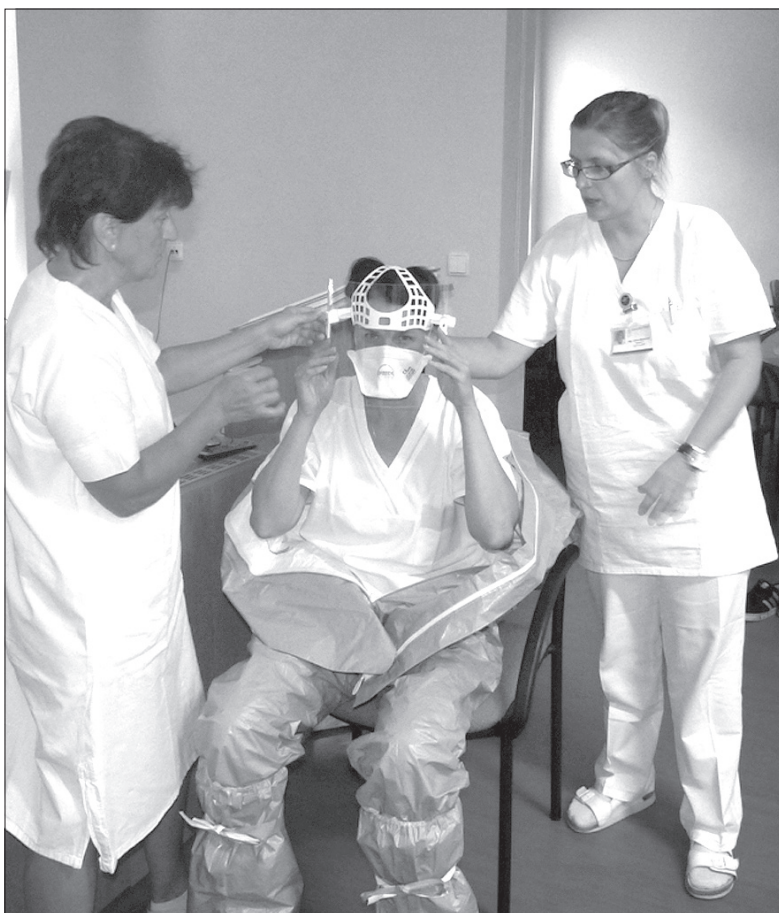
Pracownicy Szpitala Trzinec szkolili się w zakładaniu odzieży ochronnej.

Na stronie internetowej WSSE (www.khsova.cz) na bieżąco są zamieszczane wszelkie informacje nt. eboli – zarówno te przeznaczone dla