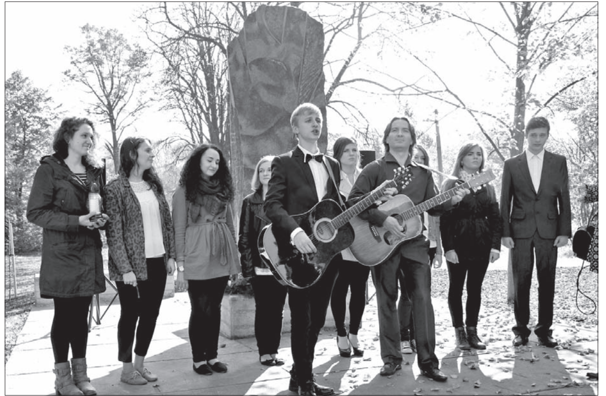
Pod pomnikiem Gimnazjum na Obrokach odśpiewano „Testament mój” Juliusza Słowackiego.