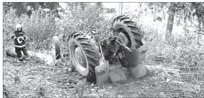
52-letni kierowca nie poskromił swojego ciągnika.