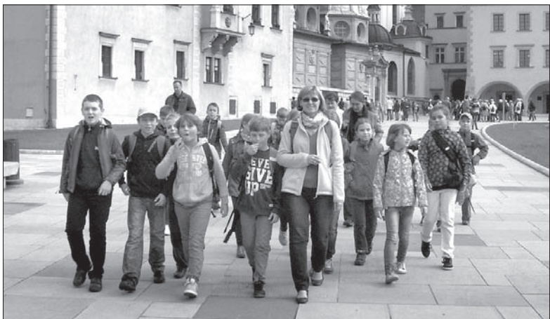
Uczniowie z Czeskiego Cieszyna na wycieczce edukacyjnej.

Uczniowie klasy V szkoły podstawowej w Czeskim Cieszynie prze-