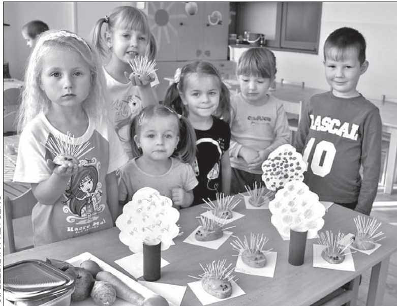
Przedkolaki z Ropicu i ich jesiennie prace.

Właśnie trwa tu „tydzień warzyw”. We wtorek dzieci robiły na przykład języki z ziemniaków. Ich wykonanie jest bardzo proste: wystarczy przekrojony wzdłuż ziemniak z odkrojonym od góry kawałeczką na jednym końcu. Do ziemniaka wbijcie wykałaczki, a do wykrojonej dziurki – oczka i nosek z suszonych goździków. I gotowe! Pannie przygotowały dla przedszkolaków także wiele innych zabaw i ciekawych zajęć o tematyce jesiennej.