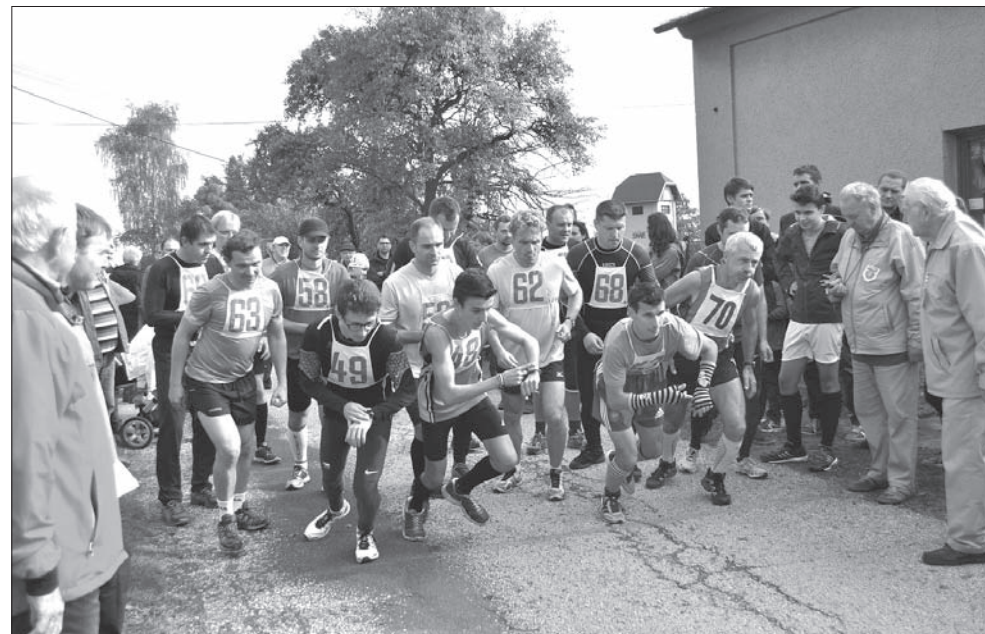
Początek biegu w wykonaniu dorosłych zawodników.