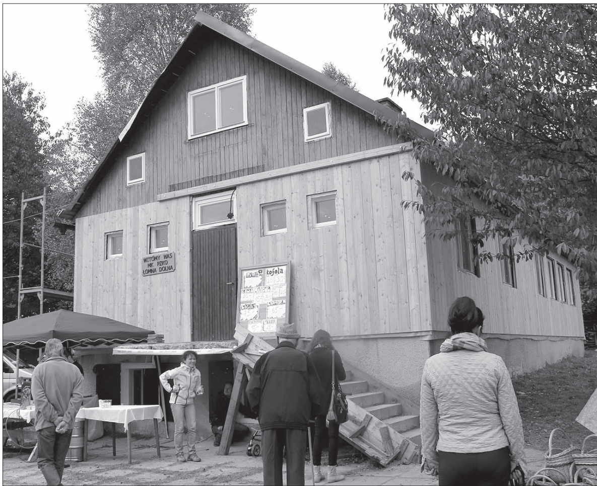
Dom PZKO w Łomnej Dolnej właśnie jest w remoncie.

Prace rozpoczęły się pod koniec sierpnia. Efekty już widać, mogli je zauważyć m.in. uczestnicy Jarmarku Jesiennego, który odbył się w sobotę w Łomnej. Dom PZKO ma odnowione okna, na połowie dachu jest nowe pokrycie, elewacja została ocieplona watą mineralną i w większej części obłożona drewnem. – To modrzew. Celowo wybraliśmy taki gatunek, bo ma bardzo dobre właściwości, nie trzeba go malować. W naturalny sposób szczerwieje i bardzo ładnie to wygląda – tłumaczył prezes.