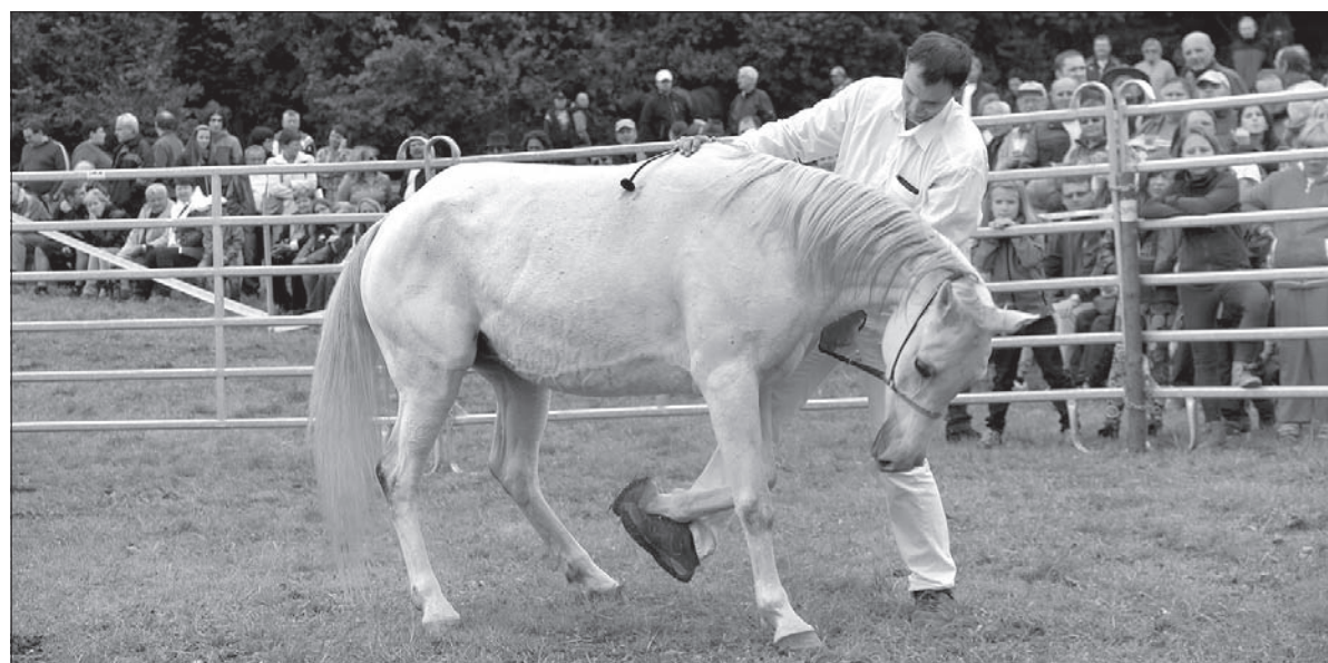
Tak kłania się koń rasy angloarab shagya.