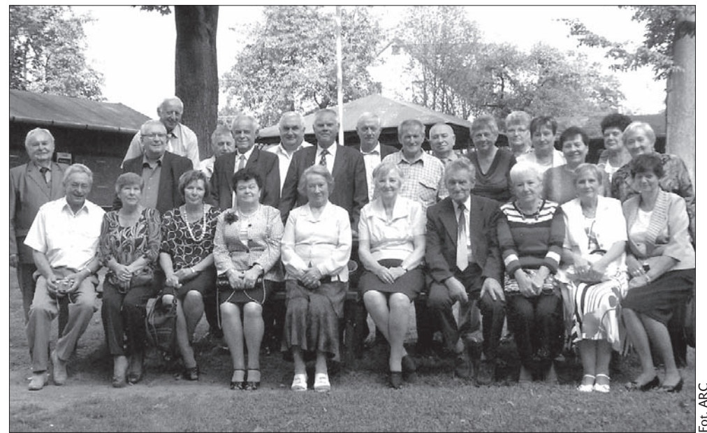
Spotkanie zostało zorganizowane 50 lat od opuszczenia murów PDSP w Stonawie.

Dzwonek. Lekcja się rozpoczyna. Przepraszam, to nie lekcja, lecz kolejne spotkanie absolwentów 9. klas dawnej PDSP w Stonawie na Hołkowicach. Różniło się ono od poprzednich tym, że zostało zorganizowane 50 lat od opuszczenia murów szkolnych. Uczniowie pochodzili ze Stonawy oraz Olbrachcic, gdzie nie było klas 6.-9. Szkody górnicze, zatrudnienie czy sprawy rodzinne spowodowały, że dzisiaj zamieszkują różne miejscowości na naszym terenie. Dlatego też wielu z nich przyjechało do Stonawy nieco wcześniej, żeby odwiedzić