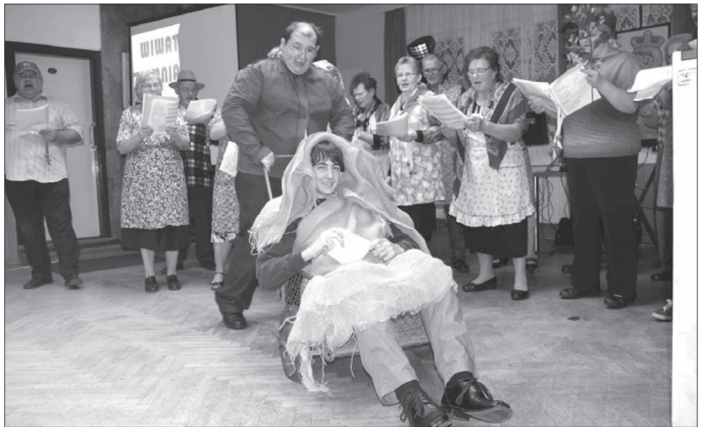
Kampania wyborcza Ziemniaka – kandydata na króla.