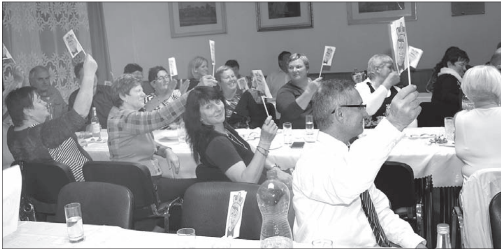
Publiczność witała Króla Jesieni chorągiewkami.