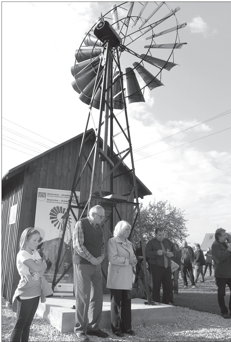
W centrum Gródka ustawiono wiatrak z 1929 roku.