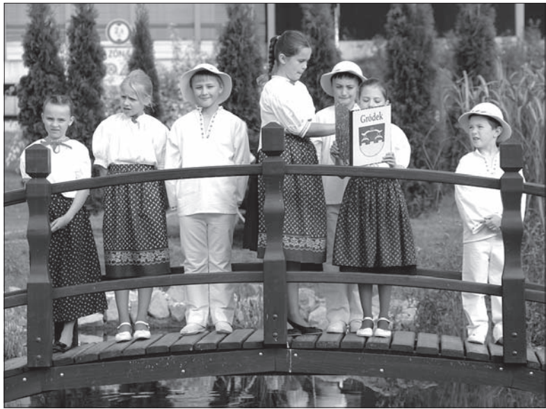
Program kulturalny przedstawili uczniowie polskiej szkoły.

Gródecki wiatrak powstał w okresie, kiedy produkcja tych młynów dobiegała już końca. Najpierw przyszedł kryzys gospodarczy, po wojnie wprowadzono elektryczność i zboże męło się już w młynach elektrycznych. – Ten wiatrak wybudował mój dziadek Jiří Dron, pracownik Huty