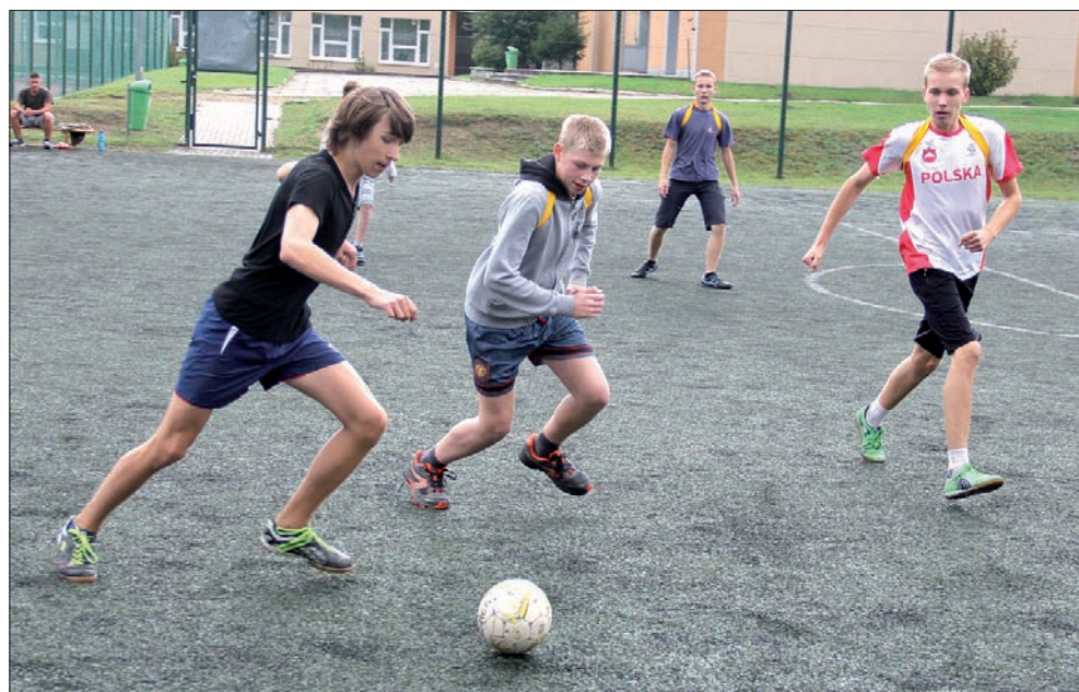
Mecz był wyrównany, ale ostatecznie wygrali gospodarze 6:4.