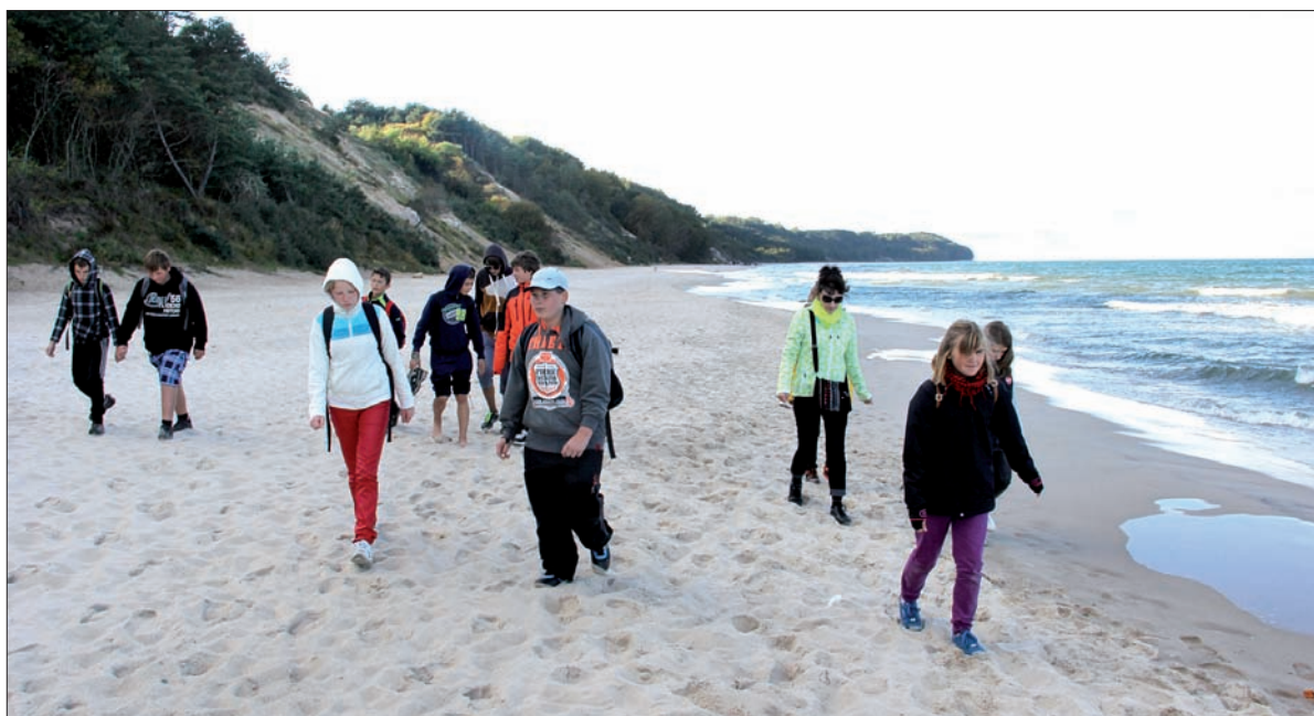
Spacer po plaży to obowiązkowy punkt programu w czasie pobytu nad Bałtykiem, nawet w chłodniejsze dni.