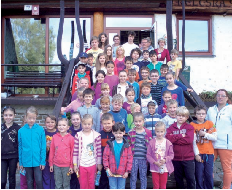
Wspólne zdjęcie uczestników przed ośrodkiem „Ebeka”.

Podczas gdy siódmoklasiści z polskich szkół podstawowych na Zalogiu korzystali z uroków nadbałtyckich krajobrazów, polska podstawówka z Hawierzowa-Błędowic wyjechała na Zieloną Szkołę do Białej w Beskidach. Uczniowie spędzili tam ubiegły tydzień.