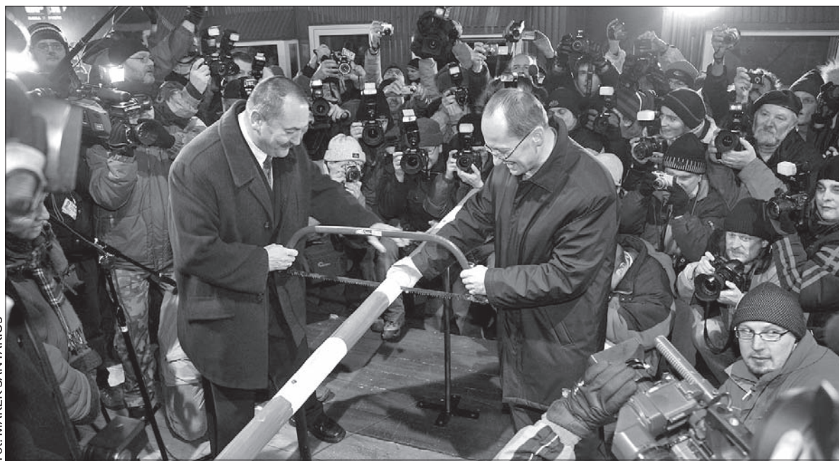
Przecinanie szlabanu na moście Przyjaźni, grudzień 2007 r.