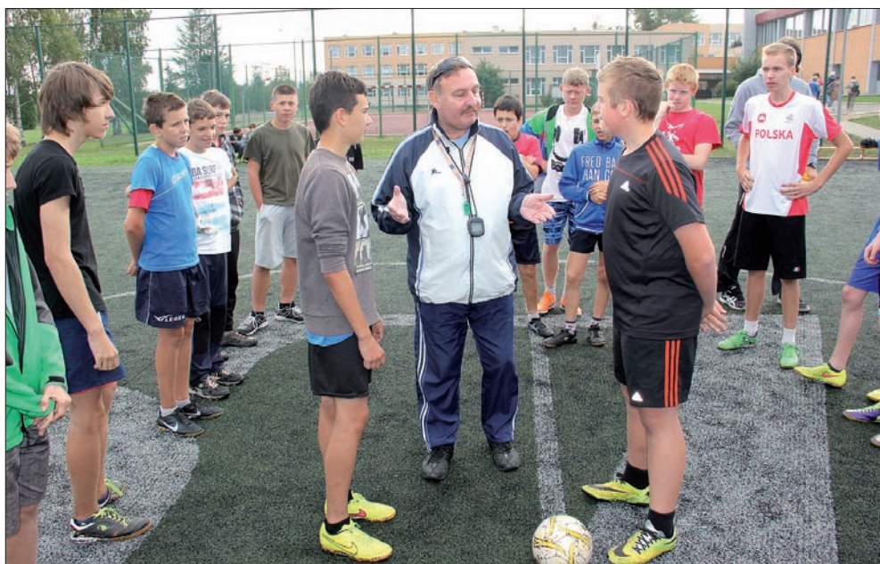
Na boisku spotkały się reprezentacja Zaolzia oraz drużyna miejscowej szkoły podstawowej w Krokowej.