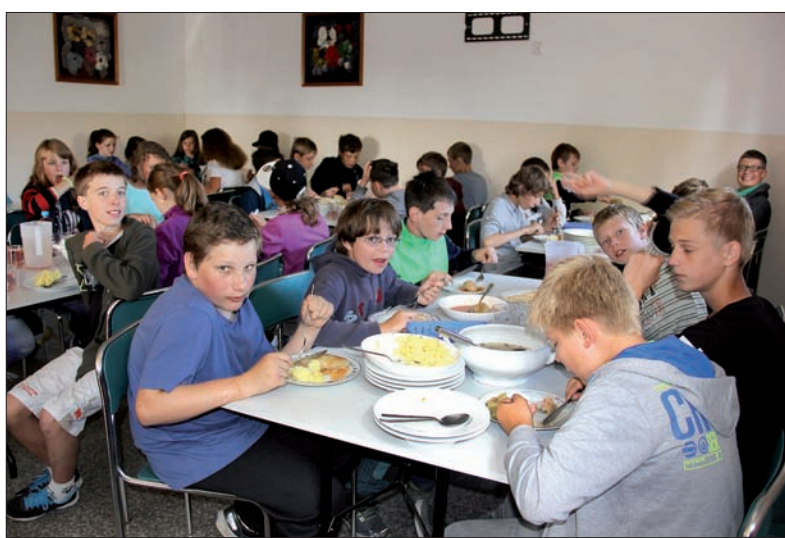
Posiłki serwowane przez właścicieli ośrodka „Korsarz” dzieciom smakowały.