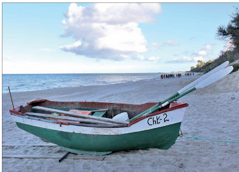
W Chłapowie można znaleźć urokliwe plaże.