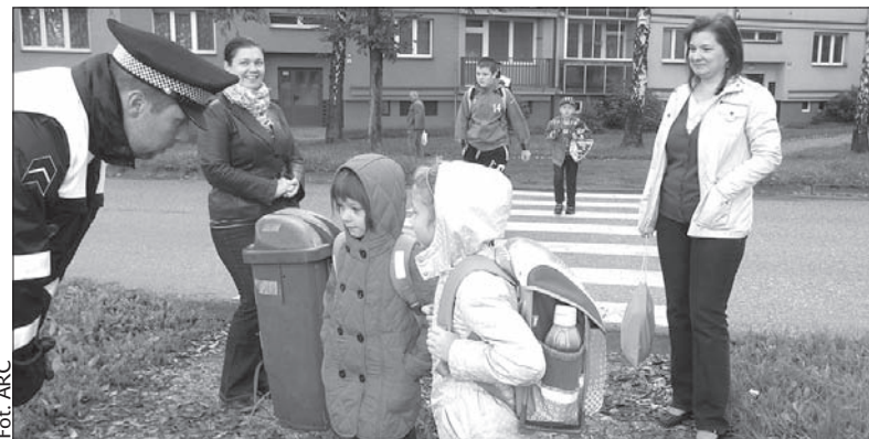
Na przejściach dla pieszych przy ulicach Śląskiej i Słowackiej dzieci z Czeskiego Cieszyna mogły spotkać w tym tygodniu rano strażników miejskich. Straż Miejska przygotowała bowiem – pod hasłem „Zebra moim przyjacielem” – ankietę i krótkie szkolenie dotyczące poprawnego poruszania się po jezdni i przechodzenia przez drogę na przejściach. Każdy otrzymał drobny upominek. (kor)