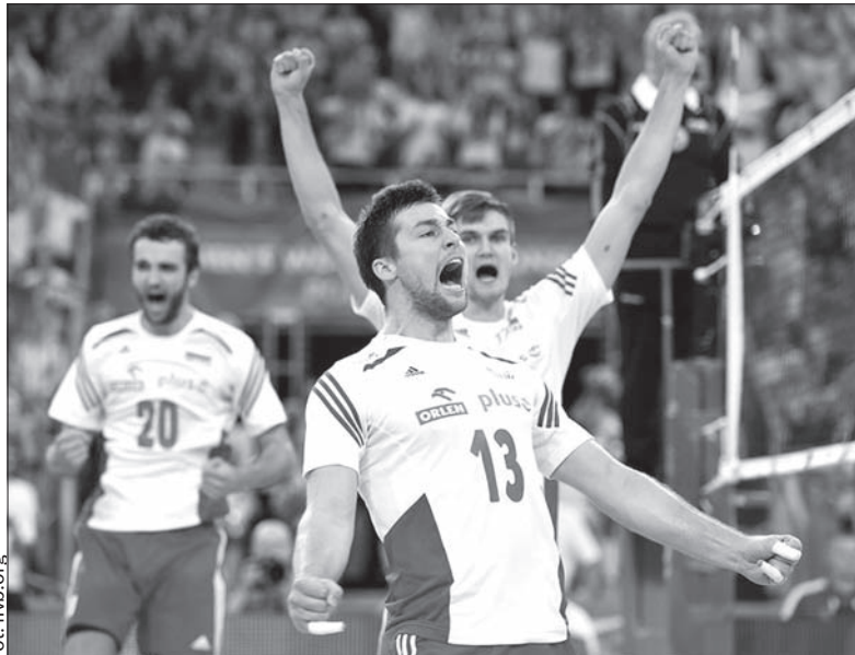
Radość Polaków po decydującej piłce meczu z Brazylią.