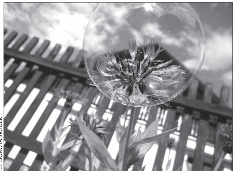
Zdjęcie bańki mydlanej na kwiecie zdobyło brąz w konkursie fotograficznym.

MILSET jest założoną w Kanadzie międzynarodową organizacją pozarządową, popularyzującą naukę i nowoczesne technologie wśród młodzieży. Konkurs fotograficzny, odbywający się pod hasłem „Kiedy sztuka spotka się z nauką”, ma na celu zachęcenie młodych fotografików do utrwalenia zjawisk, z którymi możemy spotkać się na każdym kroku, a które są w gruncie