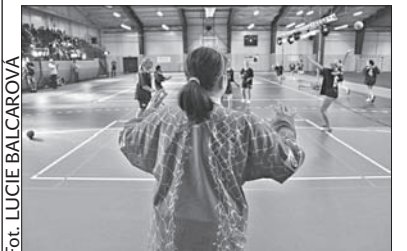
W hali można pograć także w siatkówkę.

Lokaty: 1. Litwinów, 2. Trzyniec po 7 pkt., 3. Ml. Bolesław 6,... 6. Witkowice 6 pkt. (jb)