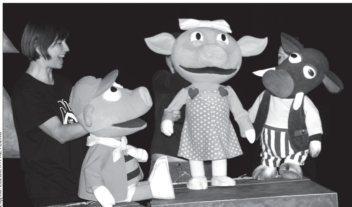
W najnowszym przedstawieniu Bajki dzieci zobaczą trzy świnki.