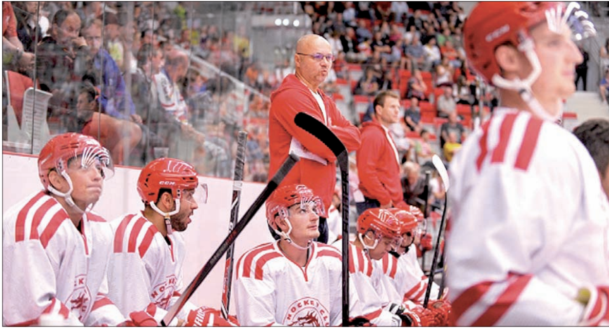
Trzyńczanie wyraźnie polubili szwajcarski klubowy hokej.