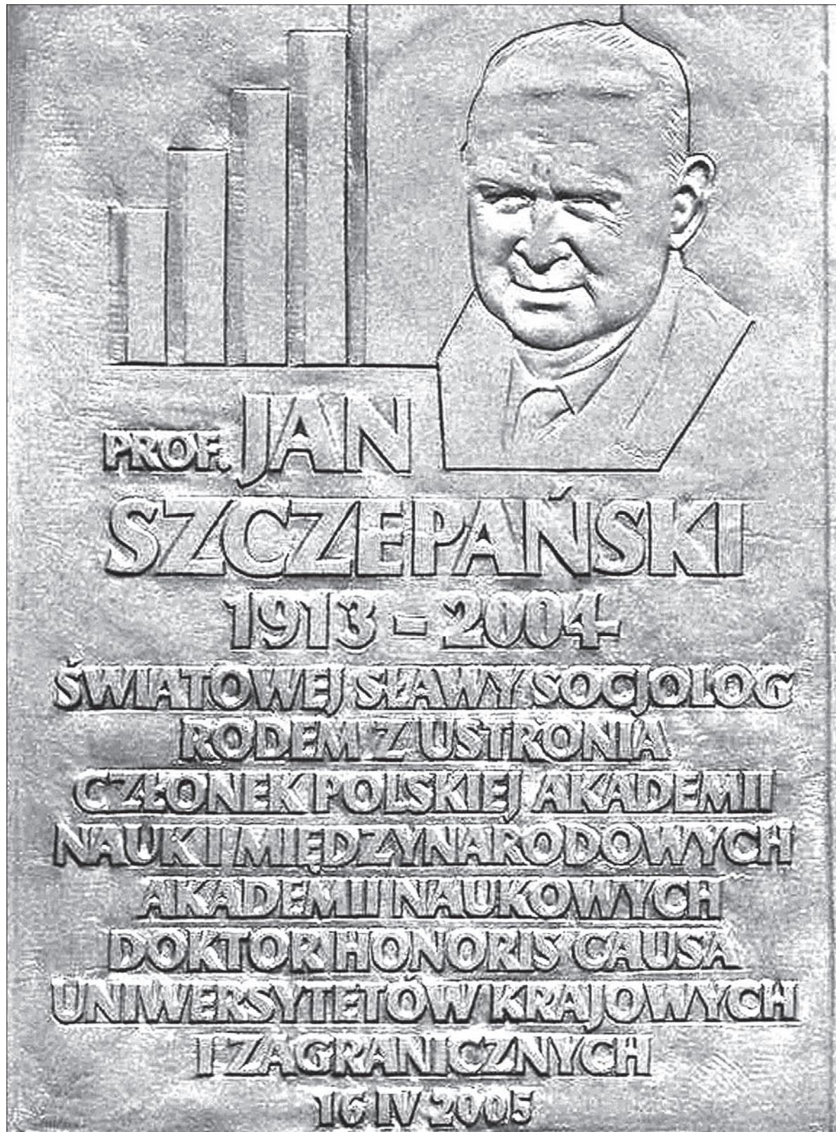
Tablica pamiątkowa poświęcona prof. Janowi Szczepańskiemu na budynku Muzeum Ustrońskiego.

Spółność polska na Zaolziu, jako społeczność pogranicza, jest ostrzej niż dzielnice centralne wystawiona na oddziaływanie kultury ma-