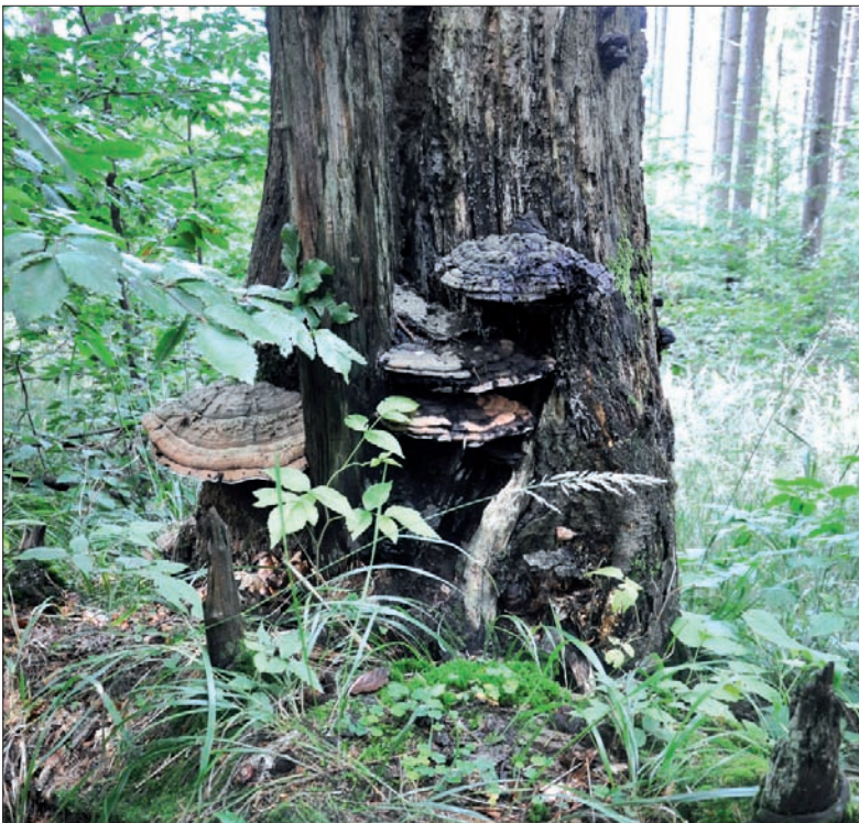
W Mionszu dobrze powodzi się grzybom.

Z roślin warto wymienić: buk zwyczajny, jodłę pospolitą, klon jawor, świerk pospolity, jesion wyniosły, głóg, wiąz górski, wiśnię ptasią, bez koralowy, wawrzynek wilcze łyko, porzeczkę alpejską, agrest pospolity, wilczokrzew czarny, pokrzyk wilczą jagodę, storczyki, które rosną na specjalnie utrzymywanej w tym celu 3-hektarowej polanie, lilię złotogłów, żywiec dziewięciolistny, żywiec cebulkowy, miesięcznicę trwałą, niecierpek pospolity, czerniec gronkowy, przebiśnieg, parzydło leśne, żankiel zwyczajny, szatwę lepłą, żywiec gruczolowaty, trędownik omszony, mieczyk dachówkowaty, goryczkę trojeściową, podejrzon księżycowy, ostrożeń głowacz i dziewięciolistnik bezłodygowy. (sch)