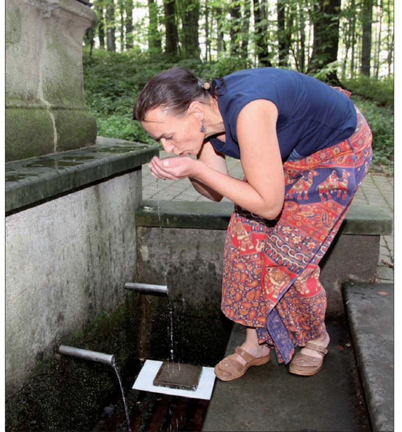
Woda z Hajku ma podobno cudowne i lecznicze właściwości.