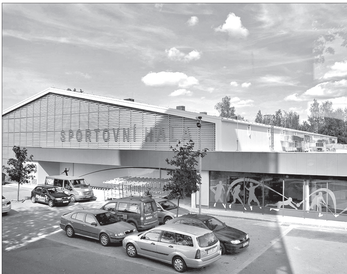
Nowa hala sportowa mieści się na terenie Parku Petra Bezruča, najważniejszej strefy relaksu w mieście.

Nowa hala usytuowana jest w strategicznym miejscu. W sąsiedztwie znajdują się bowiem pozostałe obiekty sportowe w mieście – Aquacentrum, boisko piłkarskie, stadion zimowy, a także coraz popularniejsze pole do gry w adventure golfa. (jb)