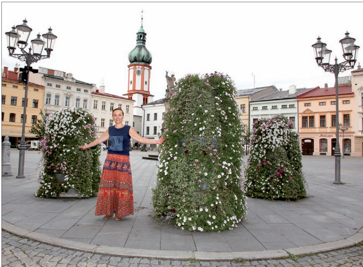
Witajcie na Morawach, czyli na Rynku Wolności w Mistku.