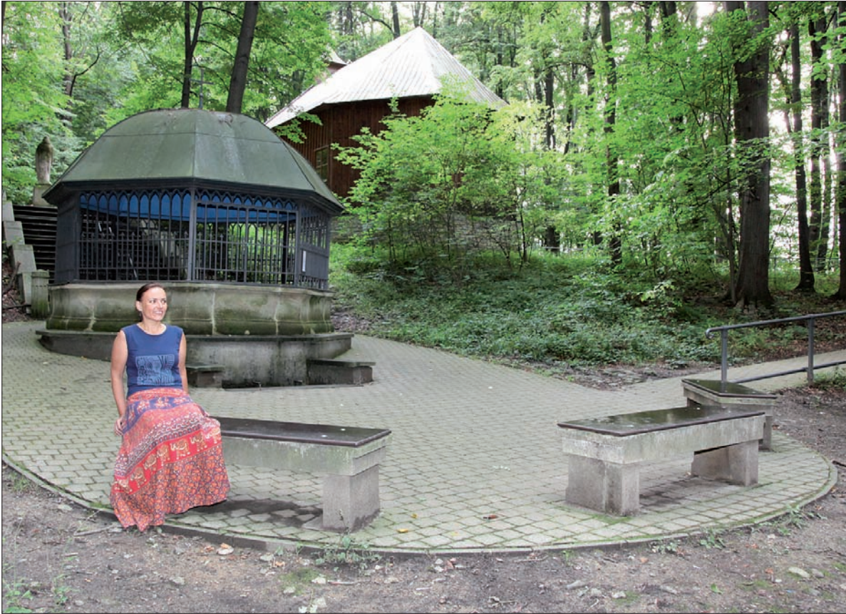
Podfrydecki Hajek do dziś jest miejscem pielgrzymkowym, a także oazą spokoju.