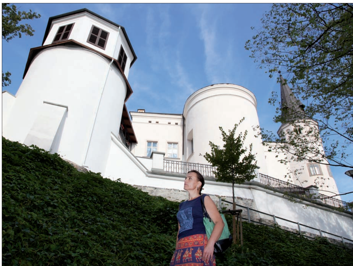
Zamek Frydecki wybudowali Piastowie cieszyńscy, dziś jest siedzibą Muzeum Beskidów.