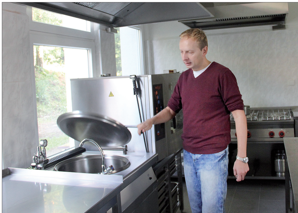
W Koszarzyskach wybudowano w czasie wakacji nowoczesną kuchnię szkolną.