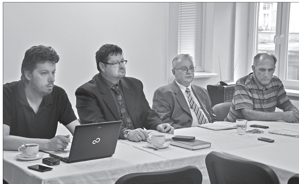
W siedzibie ZG PZKO w Czeskim Cieszynie przedstawiciele polskich organizacji omawiali wspólną strategię wyborczą.

Efektom środowego spotkania przedstawiciele Kongresu Polaków, PZKO i „Coexistentii-Wspólnoty” ma być nie tylko przekazanie polskich wyborców, by poszli w październiku do urn i głosowali na ludzi, o których wiedzą, że są Polakami i sprawy polskie leżą im na sercu, ale także stworzenie listy polskich kandydatów, których polskie środowiska w poszczególnych gminach na Zaolziu mogłyby po wyborach wprowadzić do komitetów ds. mniejszości narodowych. (sch)