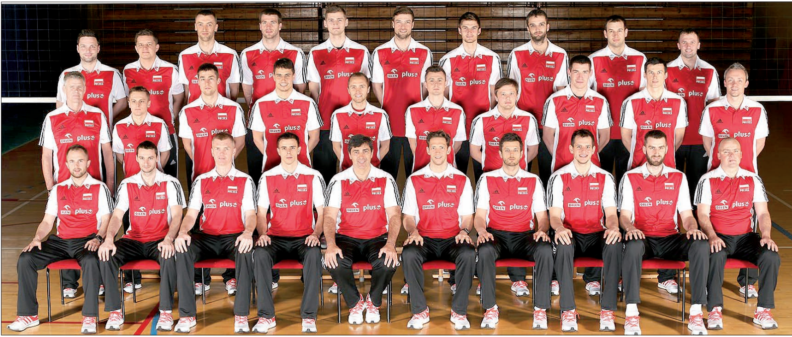
Siatkarska reprezentacja Polski.