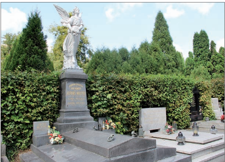
Grobowiec rodziny Matterów.