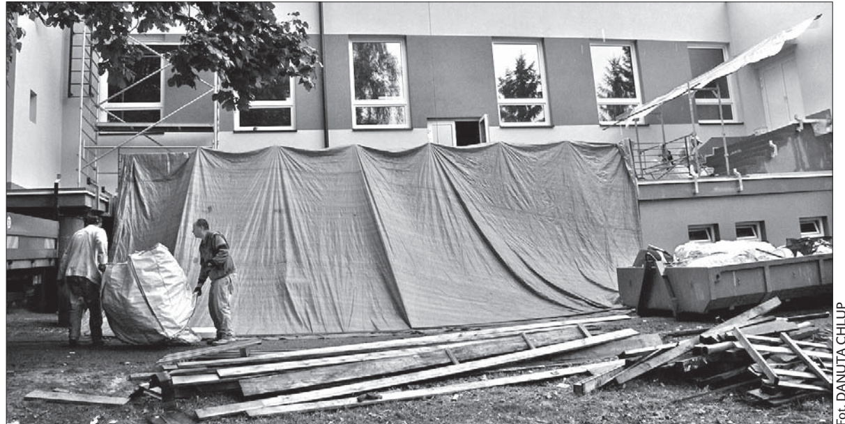
W Grodziszczu trwa remont Domu Kultury, z którego korzysta również Koło PZKO.

W przyszłym roku zostanie przeprowadzony drugi etap remontu, dofinansowanego z Państwowego Funduszu Ochrony Środowiska. Zostanie odnowione wnętrze, m.in.