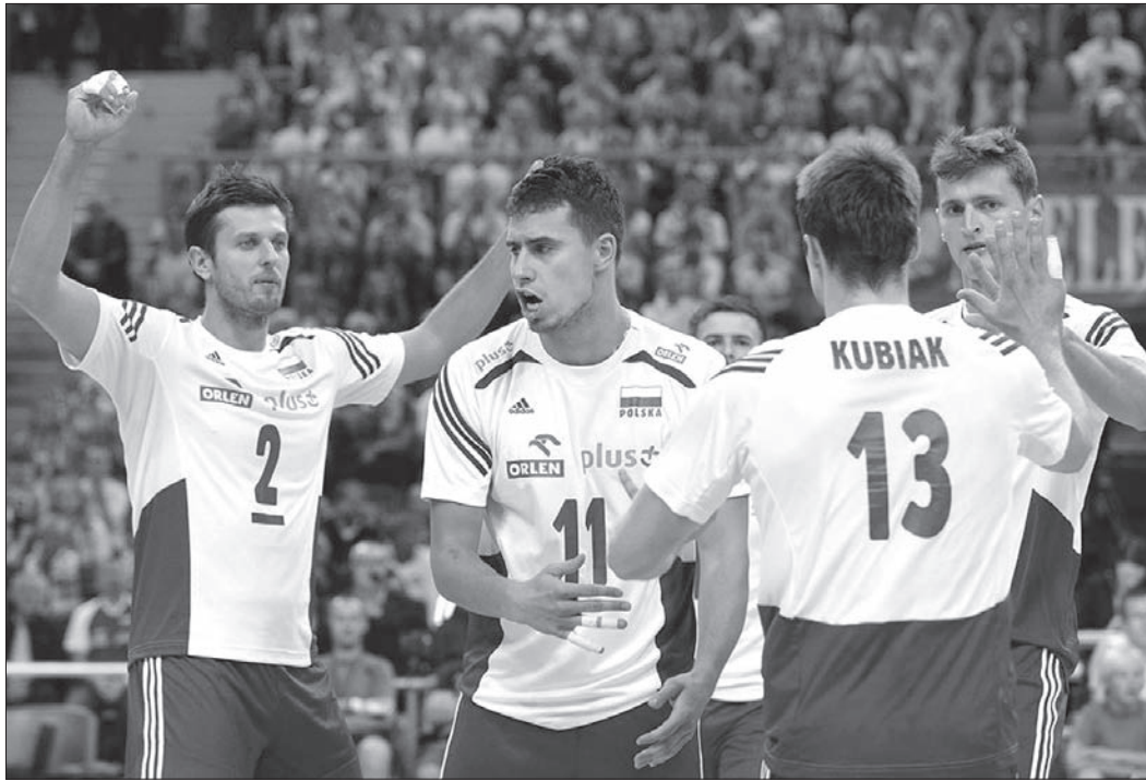
Po jaki medal celują Polacy?

fanów. Doszliśmy do wniosku, że nie chcemy się zamykać. Miały to być gry kontrolne, a okazało się, że zainteresowanie jest bardzo duże. To był ukłon w stronę naszych wiernych kibiców. Liczymy na ich wsparcie w trakcie turnieju – stwierdził Szyszko. Jutro w Warszawie na pewno odbędzie się już zamknięty, oficjalny trening przed sobotnią batalią z Serbią. W kadrze biało-czerwonych wszystko pozapinane jest na ostatni guzik. Według lekarzy, nikt nie narzeka na urazy ani kontuzje. Polacy chcą na jutrzejszym treningu przede wszystkim oswoić się z warszawską halą. Warianty taktyczne, konkretne elementy gry, siatkarze znają już na wylot.