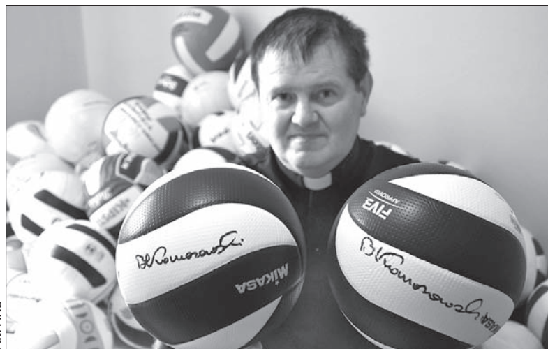
Piłki z autografem prezydenta Bronisława Komorowskiego.

– Zachęcam także mieszkańców Zaolzia do włączenia się do tej inicjatywy, uczestniczenia w nabożeństwach – dodaje pastor. (wot)