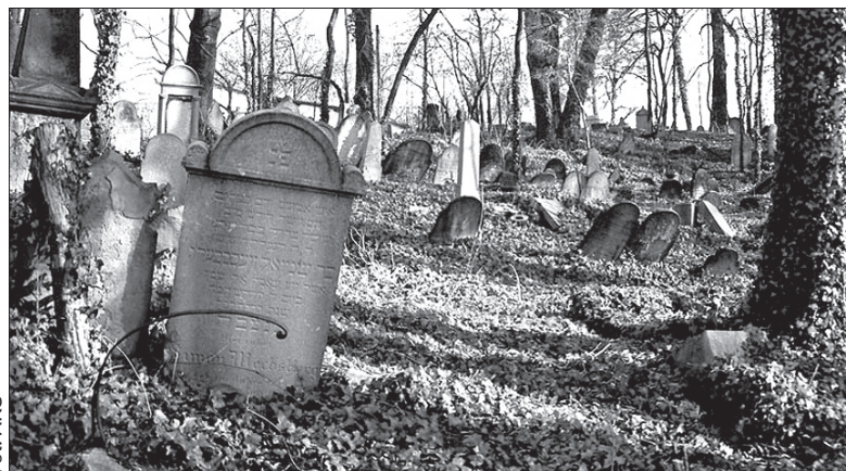
Jedna z macew na cieszyńskim cmentarzu.

Ale najciekawszym zjawiskiem są macewy znajdujące się w bliskości pni, które drzewo wprost wchłonęło, czyniąc je jakby częścią swej cielesnej struktury. Zadziwiają te kamienie grobowe, z widocznymi na nich czytelnymi inskrypcjami, oplecione masą drzewną. W jednym wypadku ma się wrażenie, że drzewo przytuliło kamień przyjacielskim ramieniem, widok wzruszający do głębi”. (ox.pl)