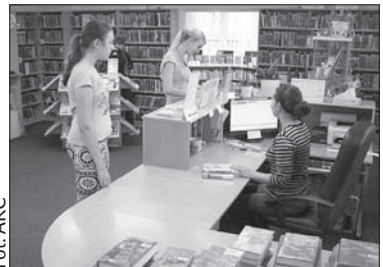
Biblioteka w Boguminie zajęła czwarte miejsce w ogólnokrajowym rankingu bibliotek.

Jedyny punkt, jakiego zabrakło bibliotece, żeby zająć w rankingu trzecią pozycję, jest według Balcara znakomitą motywacją na przyszły rok. Już teraz na przykład wiadomo, że w kolejnej edycji konkursu na rzecz bogumińskiej biblioteki będą przemawiać tegoroczne inwestycje, które zostały przeprowadzone w filiach w Skrzeczoniu i Starym Boguminie, oraz takie nowości, jak tablica interaktywna w sali wykładowej w centrum miasta czy legitymacja rodzinna, która za