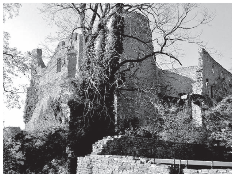
Zamek Hukvaldy – częsty cel wycieczek.

Projekt „MHD za darmo” ruszył w marcu 2011 roku, oferując bezpłatne przejazdy do najbliższych sąsiednich wiosek, takich jak Stare Miasto, Swidnow czy Rzepiszce. Rok później objął swoim zasięgiem kolejne dwie, tym razem turystycznie atrakcyjne miejscowości – Hukvaldy i Wisalaje, a od grudnia ub. roku bezpłatne połączenia z Frydku zaczęły docierać również do Starzycza, Paskowa, Žabnia, Baszki i Janovic. Teraz przyszła kolej na Palkowice, Kozłowice, Metyłowice, Fryczowice, Pržno, Bruszperk i Nową Bielą.