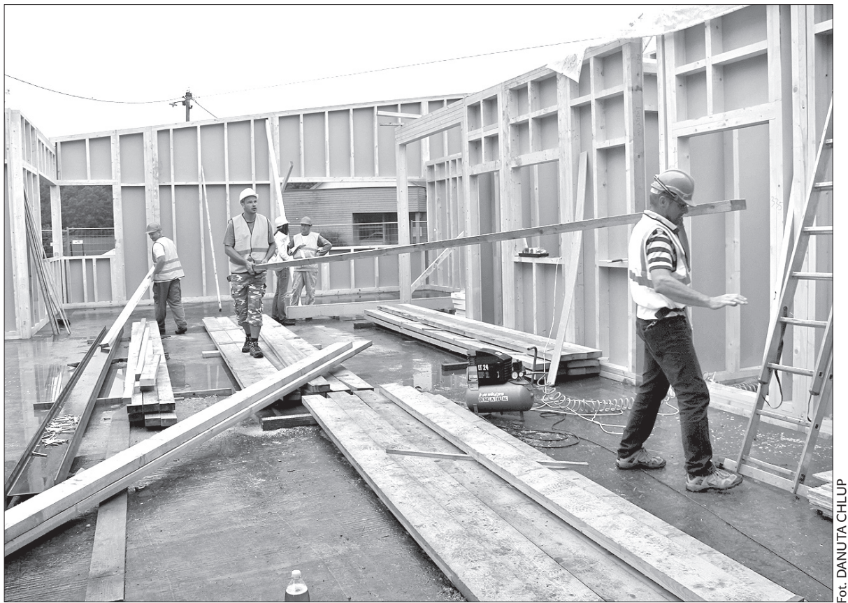
Gotowe są już ściany przyszłego przedszkola.

– Inna jest konstrukcja ścian, inny będzie system ogrzewania. Zamiast kondensacyjnego pieca gazowego zostanie zastosowana pompa ciepła. Kolejną większą zmianą to ta, że zrezygnowaliśmy z zaplanowanego zielonego dachu, ponieważ doszliśmy do wniosku, że jego utrzymanie byłoby problematyczne i kosztowne. Być może zostanie wykonany w