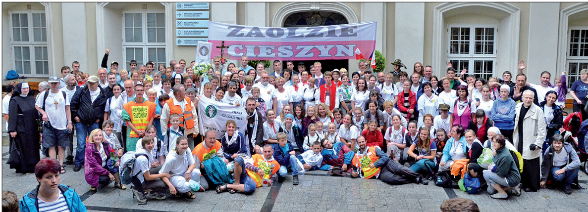
Na Jasnej Górze spotykają się w czwartek uczestnicy zaolziańskich pielgrzymek: pieszej, rowerowej i autokarowej.