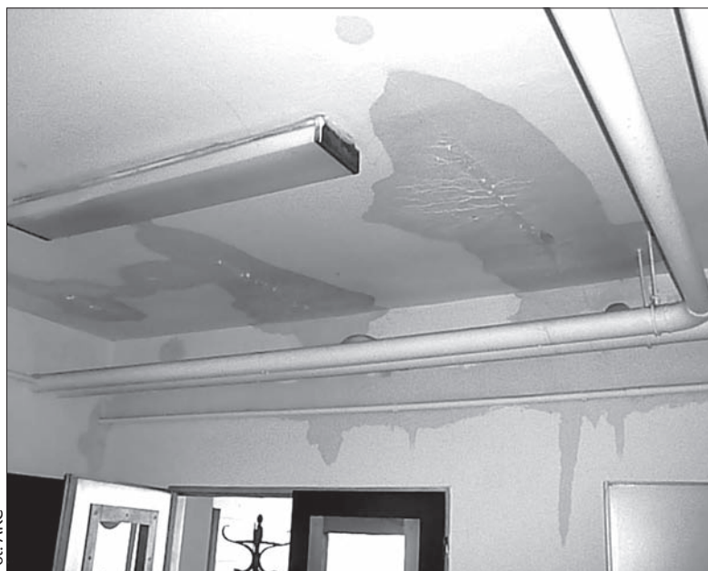
Zaciek na suficie w Domu PZKO w Cierlicku-Kościelecu.

Okazało się, że pękł wężyk doprowadzający wodę do spłuczki w jednej z ubikacji. Woda zalała toalety, rozlała się po niemal całym parterze, a potem po schodach aż do pomieszczeń w kawiarni IKAR w suterrenie. Wdarła się ponadto częściowo do głównej sali, przez sufit do kuchni, a uszkodziła też częściowo ściany Izby Pamięci. – Udało mi się