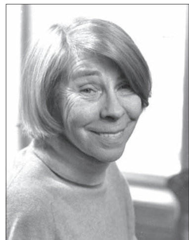
Tove Marika Jansson

Na początek mała, choć chyba trudna zagadka: w przyszłą sobotę minie setna rocznica urodzin znanej na całym świecie pisarki? Ręce w górę, kto zna odpowiedź. Jeżeli jednak podpowiemy, że pochodziła z północy i stworzyła krainę, w której żyją sympatyczne stworki o zaokrąglonych brzuskach, to pewnie będzie już trochę łatwiej. 9 sierpnia 1914 roku w Helsinkach przyszła na świat Tove Marika Jansson, pisarka, malarka, rysownicza, która zasłynęła serią książek o przygodach Muminków (zmarła 27 czerwca 2001 roku w tym mieście). Pierwszy ich zarys pojawił się w zimie 1939 roku, kiedy II wojna światowa zbierała już tragiczne żniwo. Jansson przyznała, że