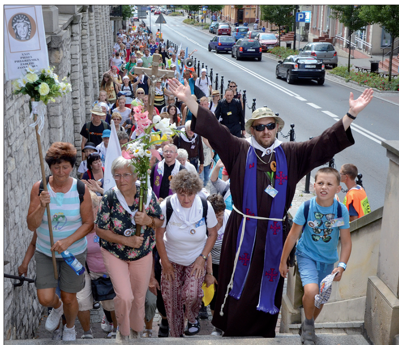
Zaolziacy na ulicach Częstochowy.