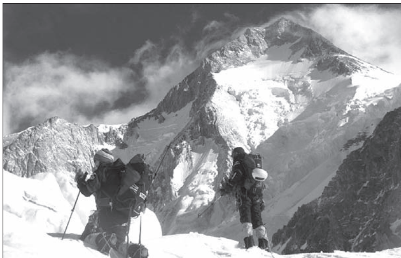
K2 uznawana jest za najtrudniejszą do zdobycia górę na świecie.

Tegoroczna wyprawa na K2 odbywa się w ramach programu Polski Himalaizm Zimowy. Ma na celu rozpoznanie góry przed ewentualną wyprawą zimową. Drugi najwyższy szczyt Ziemi jest też drugim – obok Nanga Parbat, niezdołanym jeszcze zimą ośmiotysięcznikiem. (kor)