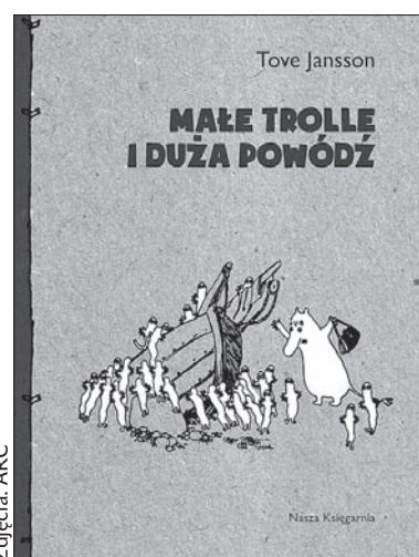
Okładka książki otwierającej przygodę Muminków.

– Zrezygnowałam z książąt, księżniczek i małych dzieci, wybierając