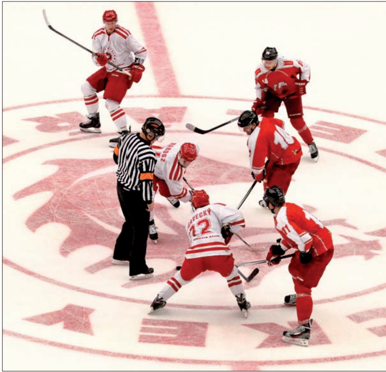
Na środku tafli widnieje duże logo ze smokiem – symbolem trzynieckiego klubu.

Trzynieczanie w czwartkowym meczu nie pozostawili nic przypadkowi. Chcieli za wszelką cenę wygrać historycznie pierwszy pojedynek w nowej hali i wygrali go w stosunkowo łatwym stylu 6:2. – Chciałbym podziękować chłopakom za determinację. Włożyli w ten mecz wiele wysiłku. Fantastyczni byli też kibice, którzy zatroszczyli się w hali o niesia-