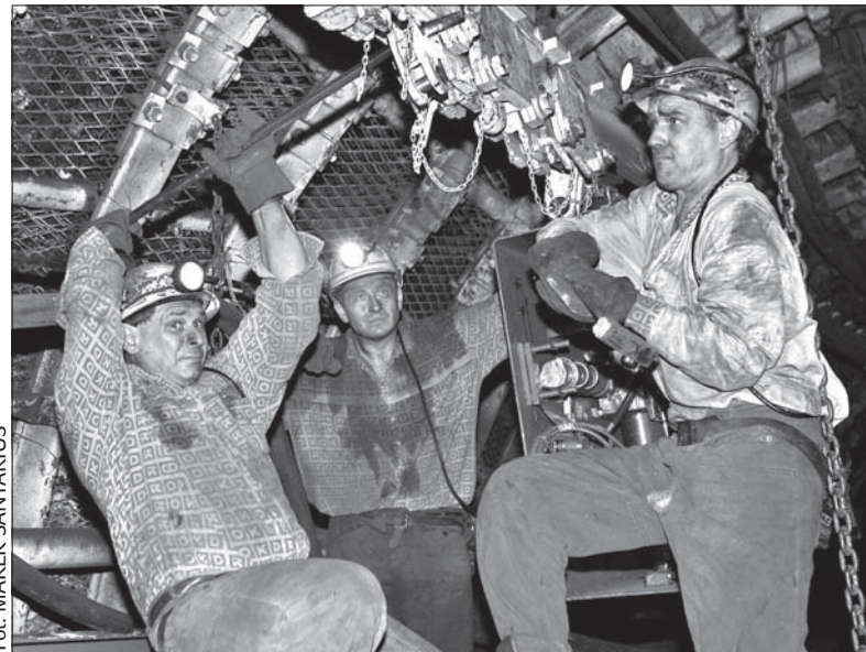
Praca w podziemiach nie należy do łatwych i bezpiecznych.