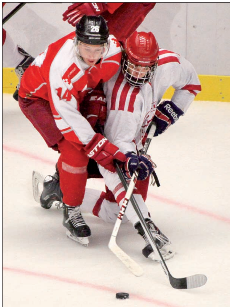
Niektóre wczorajsze pojedynki przypominały sceny baletu „Jeziro Łabędzie”.