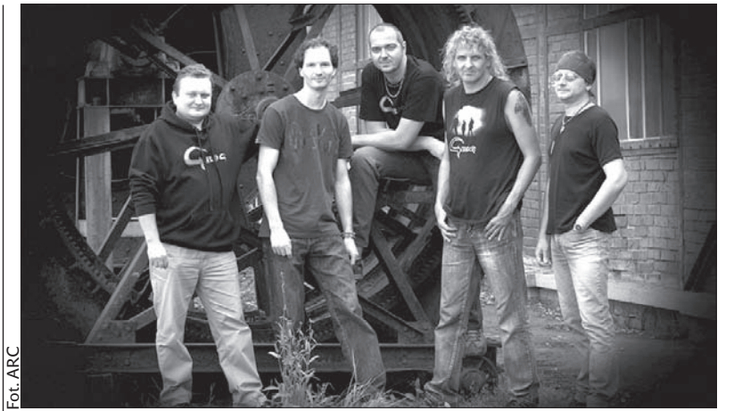
Bogumińska heavy metalowa grupa Grog.

Aranżacja wystawy przybliży proces, jakim jest prowadzenie rozmów, wywiadów i badań ze spotykanymi osobami. Jej zwiedzanie zakłada stopniowe odkrywanie przed badaczem świata twórcy-plecionkarza. Ekspozycja obejmuje kilkadziesiąt barwnych, wielkoformatowych fotografii i około stu eksponatów: narzędzi, form, materiałów. Towarzyszy jej także projekcja filmu dokumentalnego pt. „Co ty pleciesz?” zrealizowanego podczas badań terenowych Stowarzyszenia. (ep)