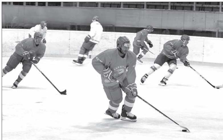
Podczas wczorajszego treningu w Werk Arenie.

31. 7. Trzyniec – Liberec (17.00), 1. 8. Trzyniec – Ołomuniec (11.00), 5. 8. Trzyniec – Mińsk (17.00), 12. 8. Trzyniec – Witkowiec (18.00, Steel Cup), 14. 8. Trzyniec – Koszyce (19.00, Steel Cup), 15. 8. Trzyniec – Czerepovec, 21. 8. Trzyniec – Bern (17.30, Liga Mistrzów), 23. 8. Trzyniec – Stavanger (20.00, Liga Mistrzów), 4. 9. Bern – Trzyniec (19.45, Liga Mistrzów), 6. 9. Stavanger – Trzyniec (17.30, Liga Mistrzów), 23. 9. Trzyniec – Tampere (17.30, Liga Mistrzów), 7. 10. Tampere – Trzyniec (18.30, Liga Mistrzów).