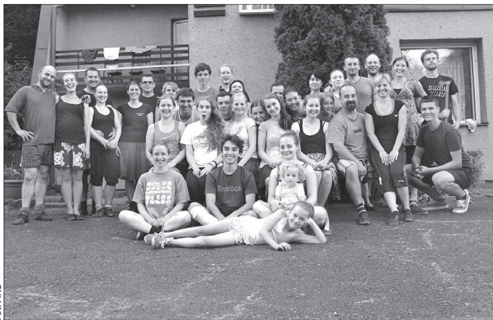
W czasie lipcowego zgrupowania „Bystrzyca” na próbach spotykali się wszyscy tancerze.