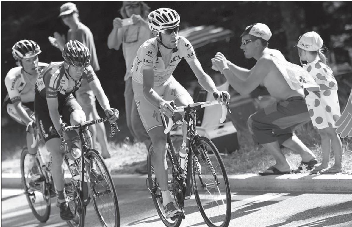
Vincenzo Nibali (z przodu), Leopold Koenig i Rafał Majka na trasie 13. etapu Tour de France.

Przełomem dla Majki był wyjazd do Włoch i starty w ekipie Gragnano Petroli Firenze. Udana występ w włoskich wyścigach zaowocowały współpracą z wpływowym mecenasem włoskiego kolarstwa, Giovan-