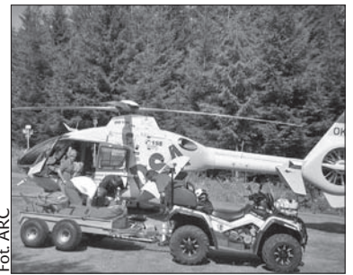
Po jednego z paralotniarzy przyleciał na Jaworowy śmigłowiec.

Chwilę po tej akcji ratownicy wezwani zostali do drugiego wypadku, do którego doszło niedaleko miejsca, z którego paralotniarze startują do lotu z Jaworowego. Tym razem innemu lotniarzowi nie powiodł się start, nie nabrał on odpowiedniej prędkości i spadł z wysokości około 20 metrów. Jak poinformował Svoboda, mężczyzna na chwilę stracił świadomość, GOPR-owcy musieli więc poprosić o pomoc lotnicze służby ratownicze. Rannego przetransportowano śmigłowcem do Szpitala Uniwersyteckiego w Ostrawie. (kor)