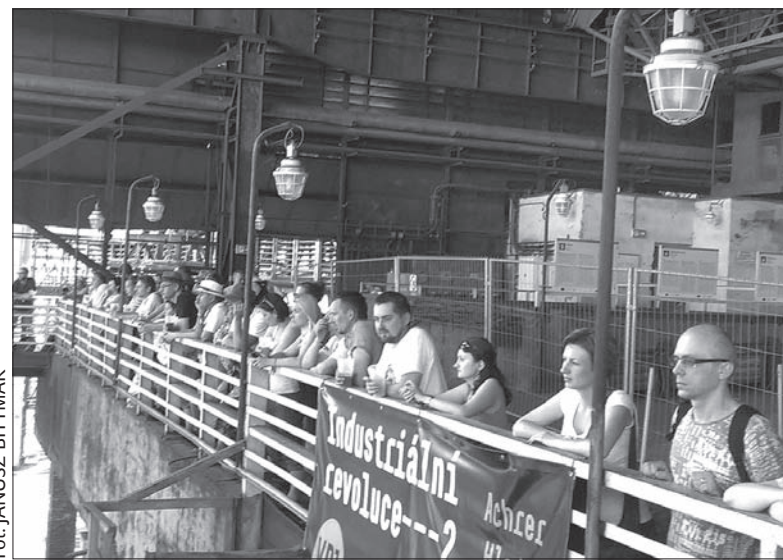
Industrialna atmosfera koncertów.

łak. W tym roku na terenie festiwalu można było spotkać również grupy widzów z Austrii, Holandii czy Niemiec. (jb)