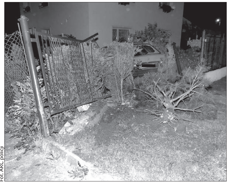
Škoda forman zatrzymała się w ogrodzie.

Kierowca škody forman jechał od strony Czeskiego Cieszyna do centrum Olbrachcic. Na łuku drogi stracił panowanie nad pojazdem i wypadł z drogi. Alkomat wykazał przeszło 2 promile alkoholu. – Młodzieńcowi udzielono pomocy w szpitalu w Hawierzowie. Po opatrzeniu ran został przewieziony do izby wytrzeźwień – poinformowała rzeczniczka policji, Zlataše Viačková. Mężczyzna będzie odpowiadał za spowodowanie zagrożenia bezpieczeństwa w ruchu