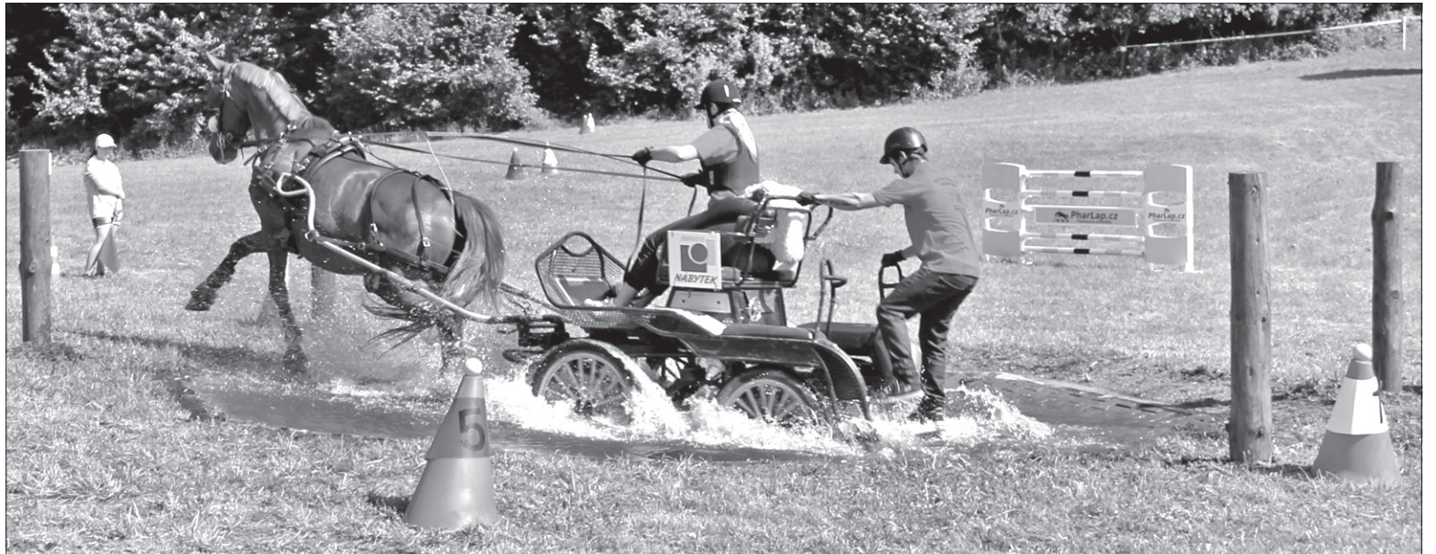
Zaprzęgi miały do pokonania liczne przeszkody.

W roku ubiegłym w zawodach zaprezentowały się dwie „czwórki”, i 16 „dwójek”, w tym roku natomiast zgłosiło się już pięć zaprzęgów czterokonnych i aż 21 dwukonnych – w sumie w zaprzęgach znalazło się ponad 60 koni, a najmłodsza uczestniczka powożąca