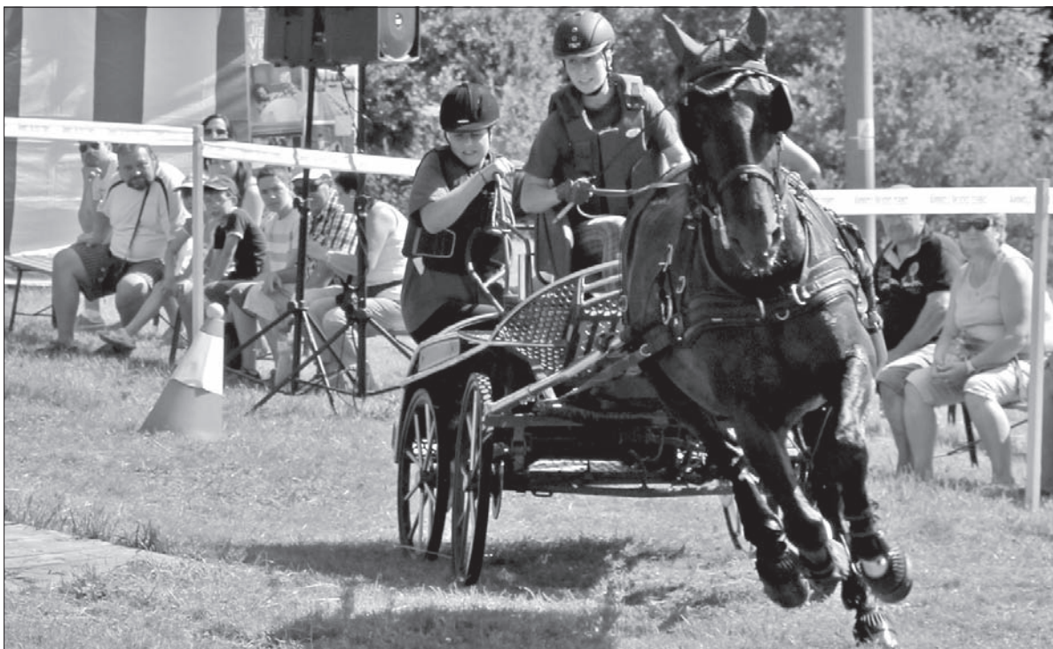
Zaprzęgami powożyły dwuosobowe załogi.