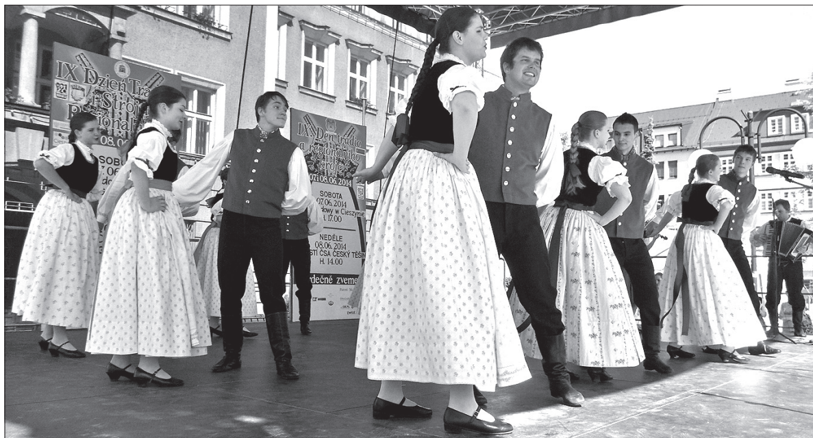
Folklor dolański zaprezentowali w niedzielę na czeskocieszyńskim rynku „Suszanie”.