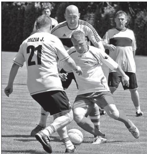
Migawki z meczu Orły Zaolzia – Bielskie Orły.