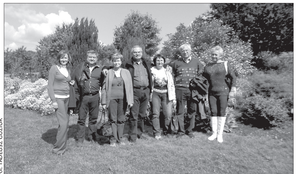
Skrzeczoniacy w Arboretum Wojsławice.