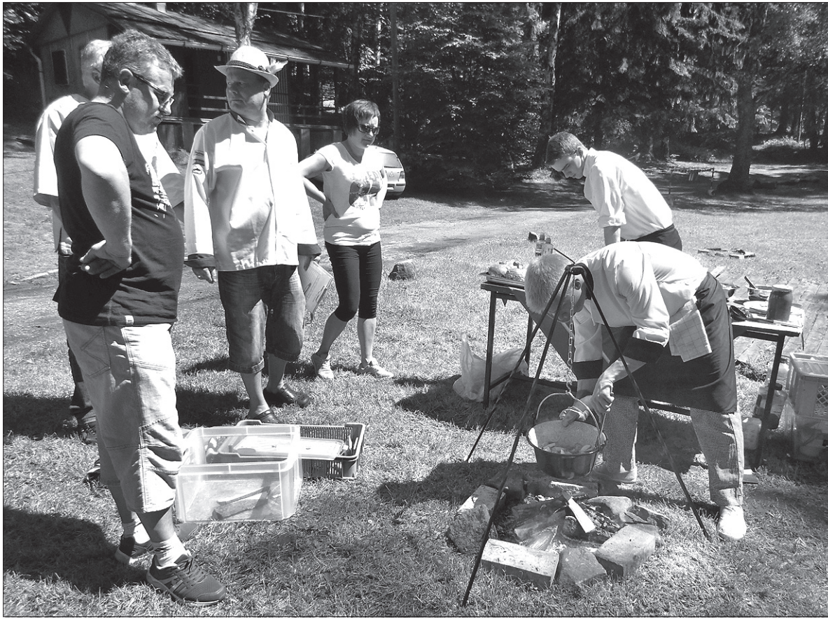
Ekipa młodych kucharzy z Wisły ugotowała na Pasieczkach paprykarz węgierski rybny.

Ekipa z Litwy reprezentowała szkołę gastronomiczną Dieveniškų