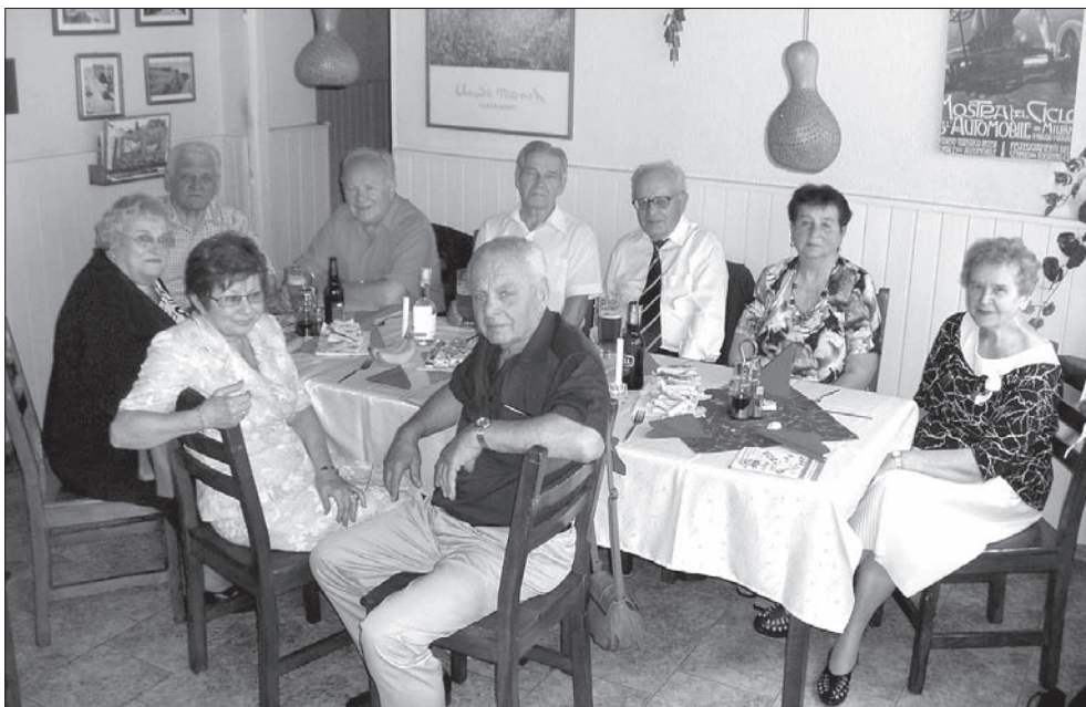
Dziewiątka maturzystów orłowskiego gimnazjum z 1954 roku na swym koleżeńskim spotkaniu w Cz. Cieszyńcu.

Nie bacząc na te okoliczności, absolwenci orłowskiego „gimpla” zachowali optymizm życiowy, trzeźwość spojrzenia i rozwagę, a także sympatię i wierność Śląskowi Cieszyńskiemu, aczkolwiek niektórym przyszło podróżować nad Olzę z Żyliny, Kutnej Hory, czy nawet z Warszawy.