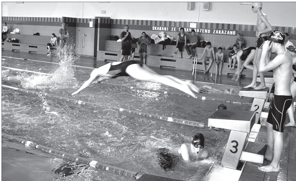
Wyścig sztafet, jak zwykle, dostarczył wielu emocji.

Znacznie liczniejsza, bo aż 12-osobowa była reprezentacja szkoły w Suchej Górnej. – My także zamierzamy