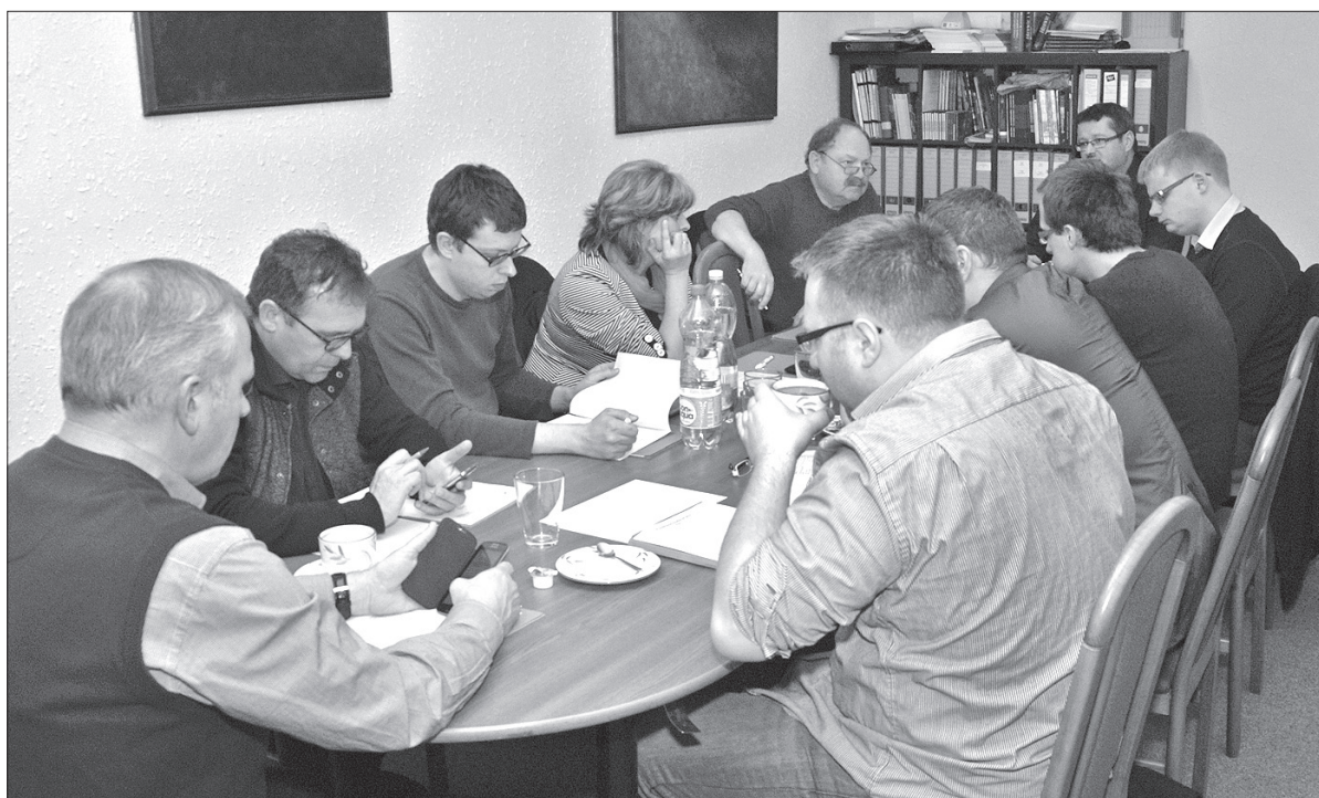
W tym tygodniu Rada Kongresu Polaków dyskutowała nad projektem przyszłorocznego budżetu.

Dla odmiany Komisja Medialna Kongresu proponowała, by na stronie internetowej Kongresu dodać informacje na temat jego historii. Pojawią się na niej również teksty omawiające przepisy czeskiego prawa zezwalające na używanie języka polskiego, a także czeskie prawo dotyczące mniejszości narodowych. – Co najważniejsze, teksty te zostaną przetłumaczone na język czeski, tak by każdy mógł się na nie powołać – wyjaśnił Moliński.