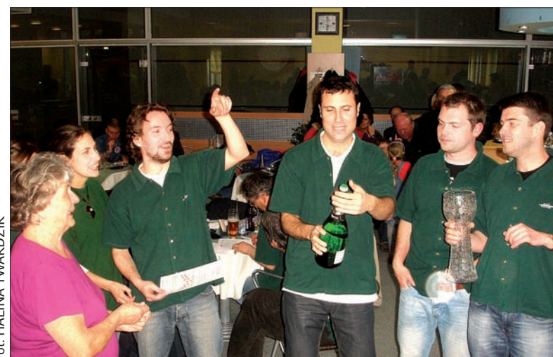
Zwycięska drużyna MK PZKO Czeski Cieszyn-Osiedle I.