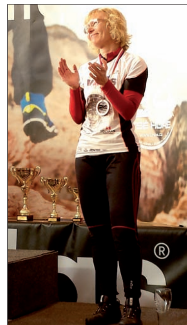
Na podium wyścigu ekstremalnego na Łysą Górę.

Pytam też o lęk wysokości. Czy każdy go odczuwa? – Myślę, że tak. Zawsze mówię, że wszystko jest w głowie. Kiedy człowiek nie może, to dlatego, że głowa nie może, a nie nogi. Z lękiem wysokości jest tak samo. Po prostu trzeba nad nim zapanować, a nie dać się sparaliżować. Lęk wysokości zmusza mnie, żeby lepiej skupić się na drodze, żeby zrobić wszystko, żeby nie runąć w dół. Raz na trasie spotkałam jednak pewną sparaliżowaną strachem kobietę. Utknęła w połowie drogi pomiędzy jednym zejściem po łańcuchach, a kolejnym wyjściem. Nie docierały do niej żadne rozsądne argumenty. Nie wiem, czy w końcu jej towarzyszą podróżnicy udało się ją przekonać do dalszej drogi – zastanawia się moja rozmówczyni.