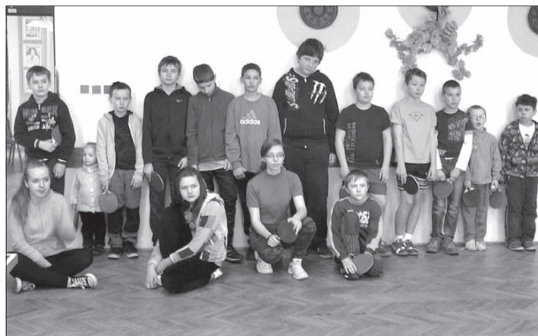
Młodzi uczestnicy turnieju.