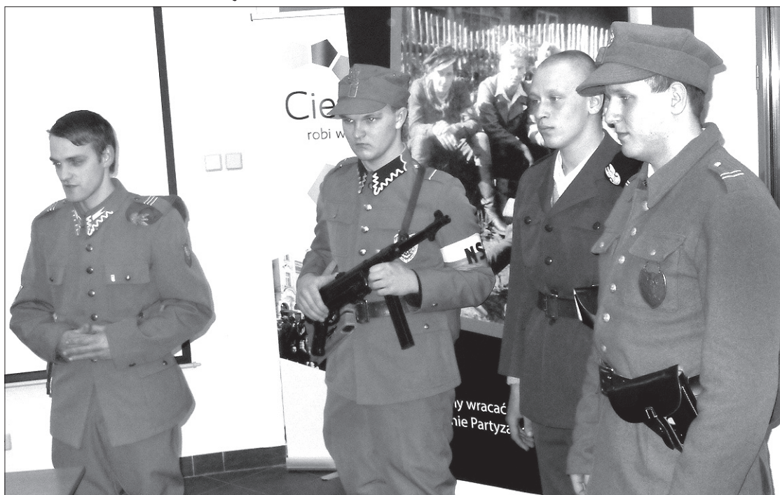
Na spotkaniu w Książnicy Cieszyńskiej zaprezentowała się Grupa Rekonstrukcji Historycznej „Beskidy”, odtwarzająca podziemie niepodległościowe w naszym regionie.