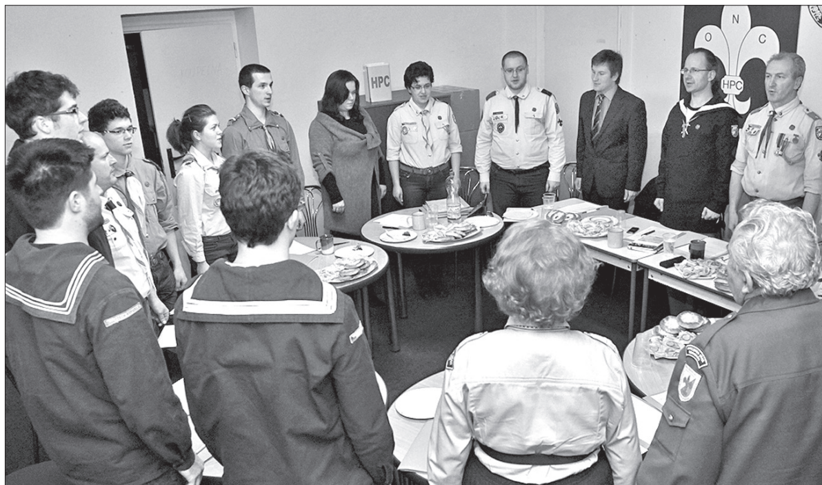
Obrady rozpoczęto od odśpiewania hymnu harcerskiego.