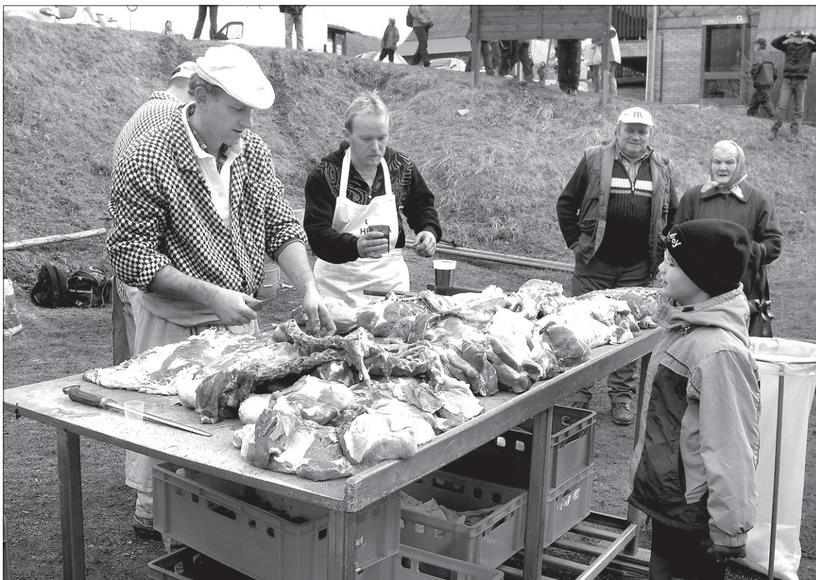
Na miejscu można było skosztować wyrobów ze świniobicia.

wa, a wiadomo, w tym smutnym świecie warto się dobrze zabić, zwłaszcza przed Wielkim Postem – mówił Szpyrc. Przyznał, że podobnej ostatkowej tradycji, jak ta nowa herczawska, u nas raczej nie było. – Były bale ostatkowe i „pochowani basy”. Ale takie korowody masek, przebierańców, to sprawa raczej morawska, czeska, słowacka. Tu u nas ostatki miały charakter skromniejszy, bardziej religijny. Był Tłusty Czwartek, piekło się „krepliki” lub chrust, odkał pamiętam w wioskach są urządzone bale. W środę zaś już szło się w skupieniu do kościoła, bo to przecież Popielec i trzeba błagać Boga o odpuszczenie grzechów, posypać głowę popiołem – dodał.