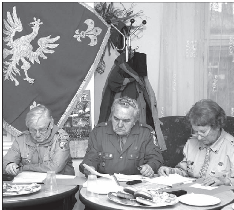
Przedstawiciele Kręgu Seniora „Zaolzie”.

Harcerstwo Polskie w Republice Czeskiej zakończyło dziesiątą kadencję swojej działalności. W piątek w Czeskim Cieszynie odbył się XI Zjazd HPC, który podsumował dwuletnią kadencję, przyjął program działania na kolejny okres oraz wybrał swoje władze.