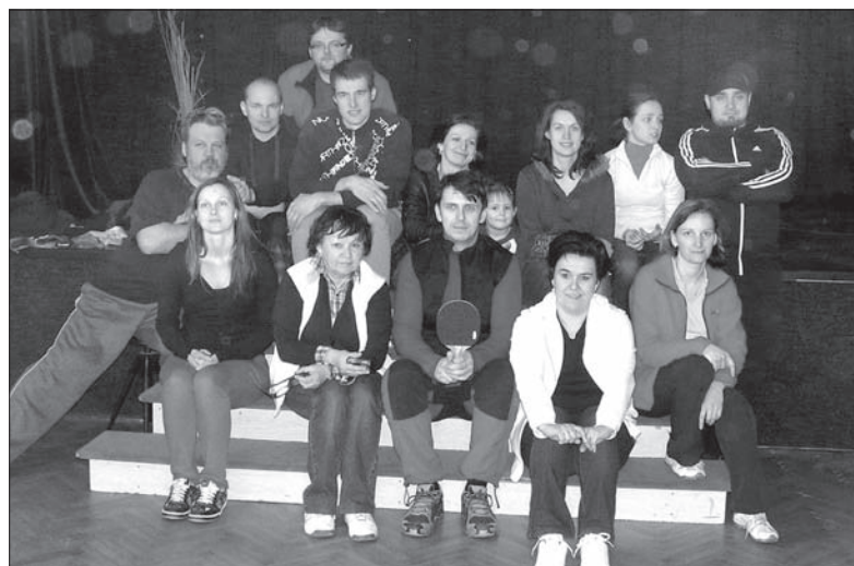
W turnieju świetnie bawili się także dorośli.