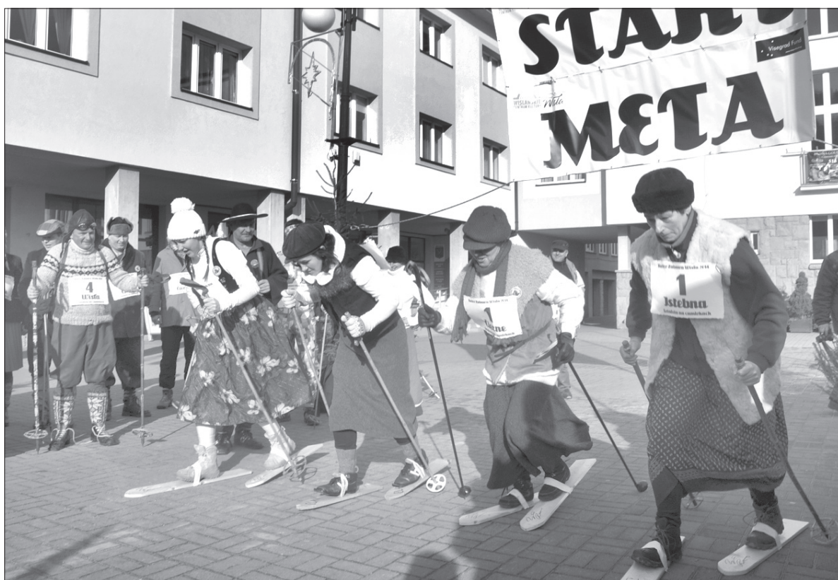
Uczestnikom retro zabawy nie przeszkodził nawet brak śniegu.

Po emocjach na wiślańskim rynku uczestnicy Biegu Retro założyli narty na... plecy i ruszyli w kierunku