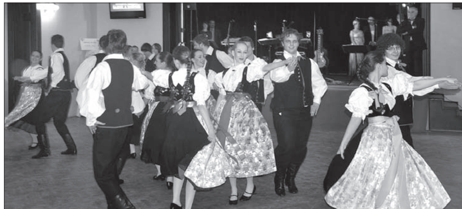
W akcji zespół „Błędowianie”.