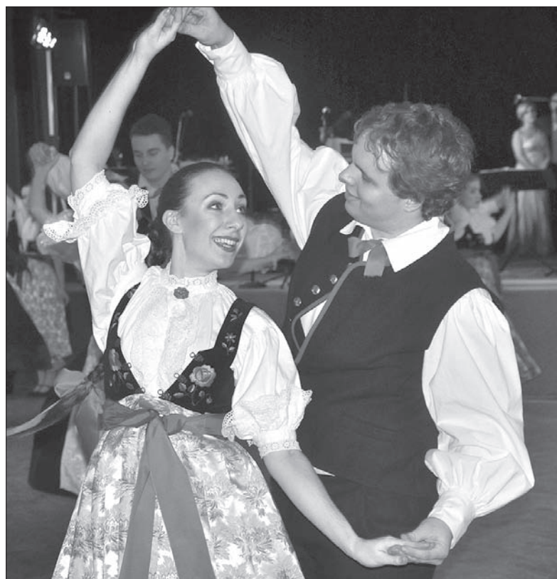
Karnawałową zabawę zainaugurował Zespół Regionalny „Błędowice”.