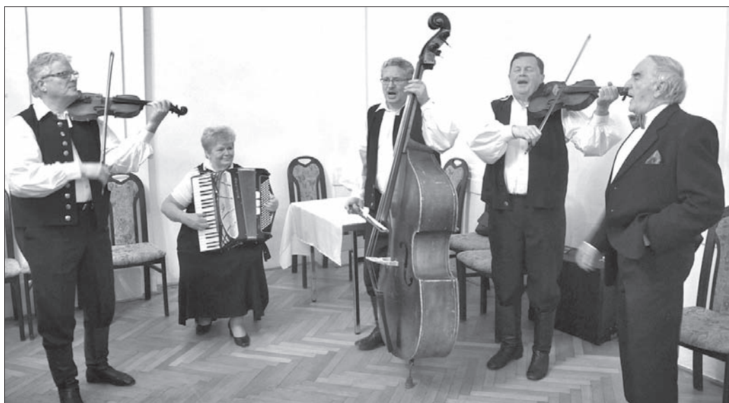
Jak na Bal Świąteczny przystało, nie mogło zabraknąć naszych, cieszyńskich pieśnierek.