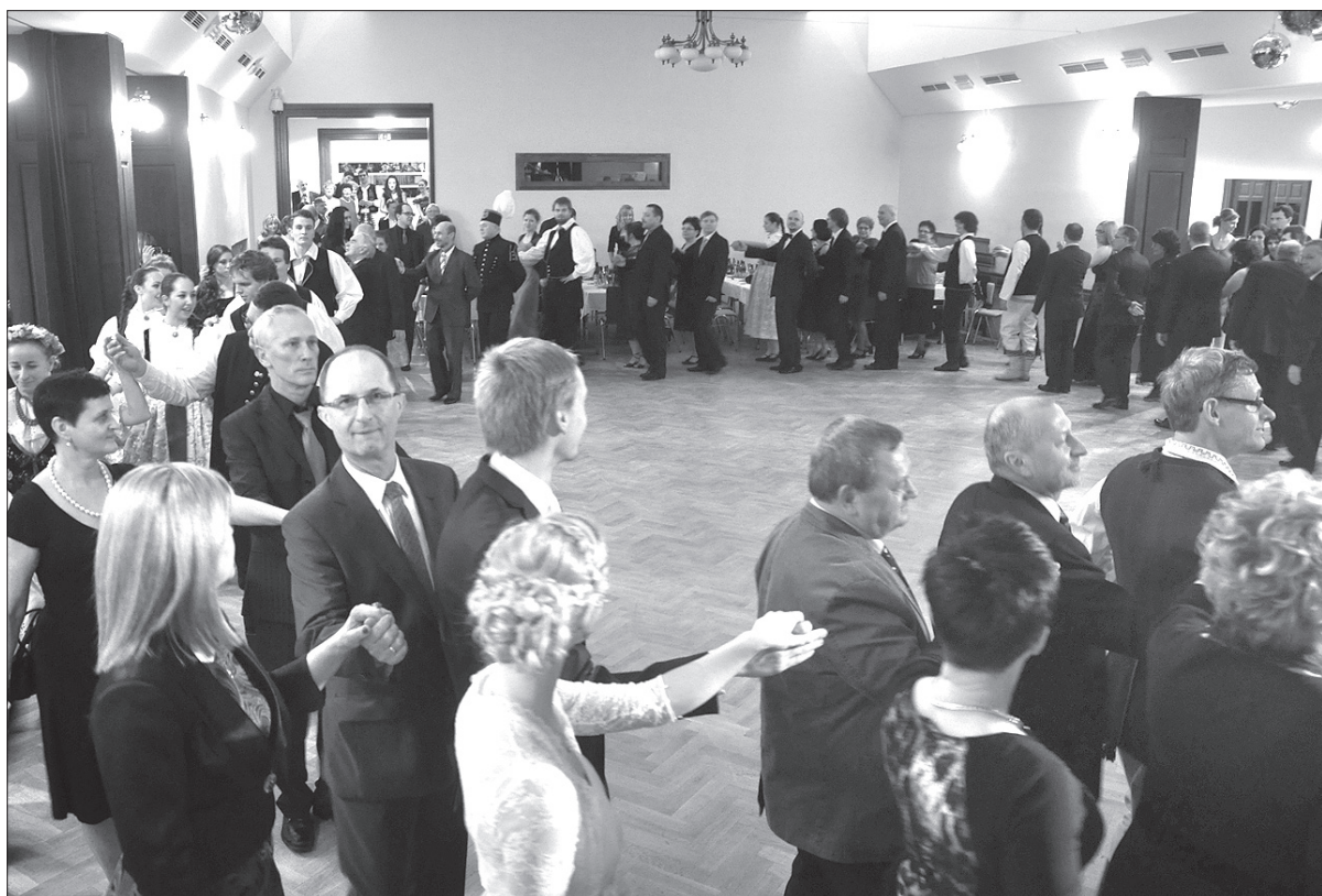
Na Reprezentacyjnym Balu Świątecznym nie zabrakło tradycyjnego poloneza.