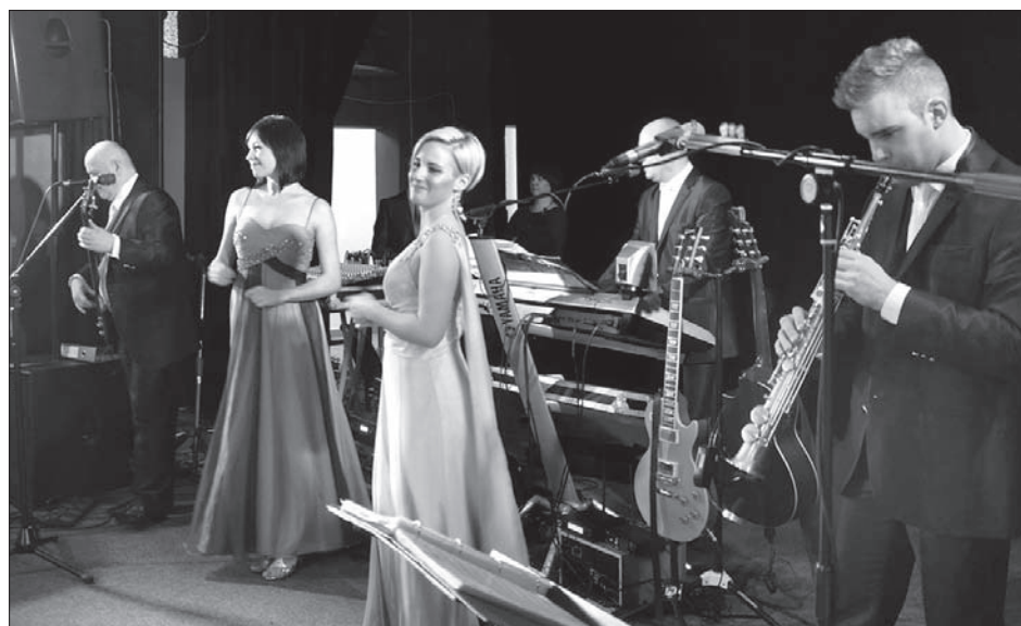
Do tańca przygrywała orkiestra Rivieras.