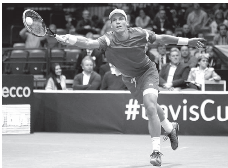
Do zwycięstwa poprowadził Czechów w Ostrawie niezawodny Tomáš Berdych.

Zwycięski weekend w Pucharze Davisa zanotowali też Polacy walczący w grupie I strefy euro-afrykańskiej. Biało-czerwoni pokonali 3:2 Rosjan. Decydujący punkt zapewnił Polakom Jerzy Janowicz, który pokonał