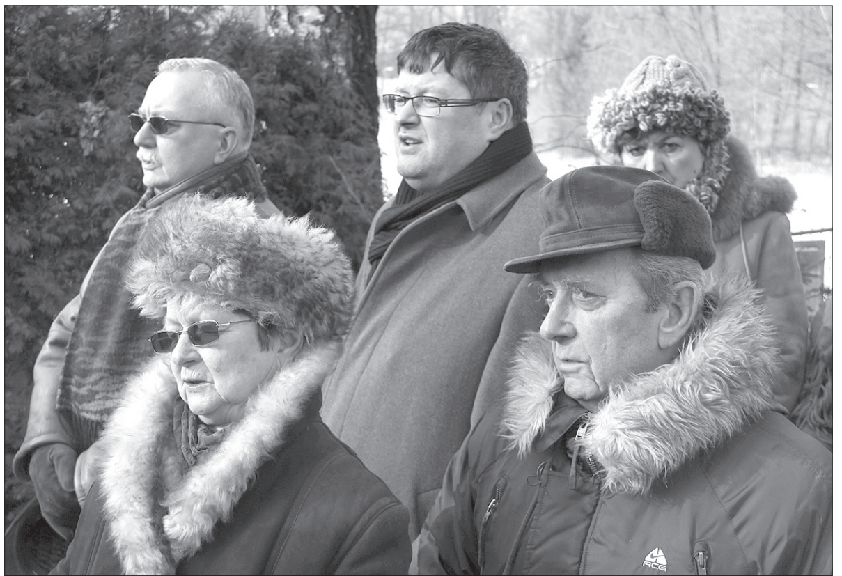
Uroczystość na cmentarzu zakończyła się chóralnym odśpiewaniem „Roty”.