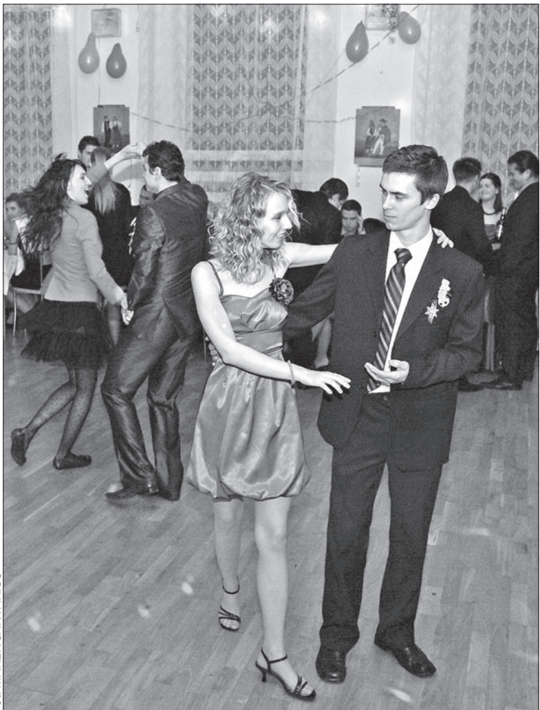
Członkowie Klubów Młodych z różnych zakątków Zaolzia bawili się w nocy z soboty na niedzielę na Balu Młodzieżowym w olbrachcickim Domu PZKO.