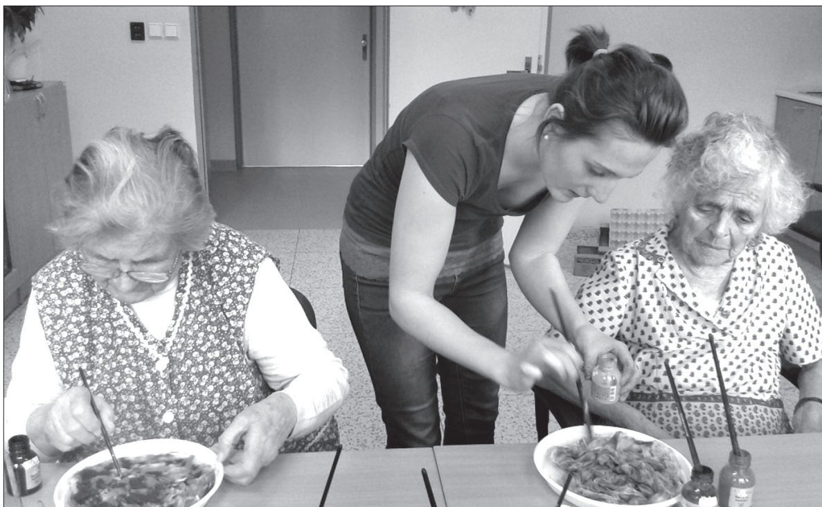
Oddział łóżek socjalnych to nie „przechowalnia” dla seniorów, ale sposób na ich zaktywizowanie.

Oddziału łóżek socjalnych nie należy mylić z domem opieki społecznej czy domem seniora. Stanowi tylko rozwiązanie przejściowe. Bynajmniej nie chodzi jednak o „przechowalnię” dla chorych seniorów. Raczej o formę ich rehabilitacji psychicznej i fizycznej, która odbywa się na podstawie planu indywidualnego, który zostaje opracowany dla każdego pacjenta z uwzględnieniem jego możliwości i potrzeb. Z łóżek socjalnych w trzynieckim szpitalu korzystają nie tylko mieszkańcy miasta, ale również okolicznych wiosek. To przekłada się na