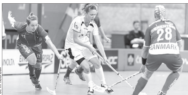
Polki w barażu o 1/4 finału pokonały Danię 7:4.

Faworytem czwartkowego spotkania w Ostrawie jest reprezentacja RC. Czeszki przed dwoma laty wywalczyły w Szwajcarii brązowe medale, a obecnie zajmują 4. lokatę w światowym rankingu. Biało-czerwone, które na poprzednich mistrzostwach zajęły szóstą pozycję, sklasyfikowane są obecnie na 7. pozycji w rankingu najlepszych drużyn narodowych świata. (jb)