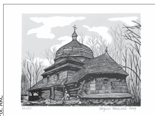
Jedna z prac artysty z Sanoka.

nia z pejzażu drewnianych cerkwi i kościołów, są twórczością rejestruje cenny dorobek przodków, by przekazać pamięć o tych zabytkach następnym pokoleniom.