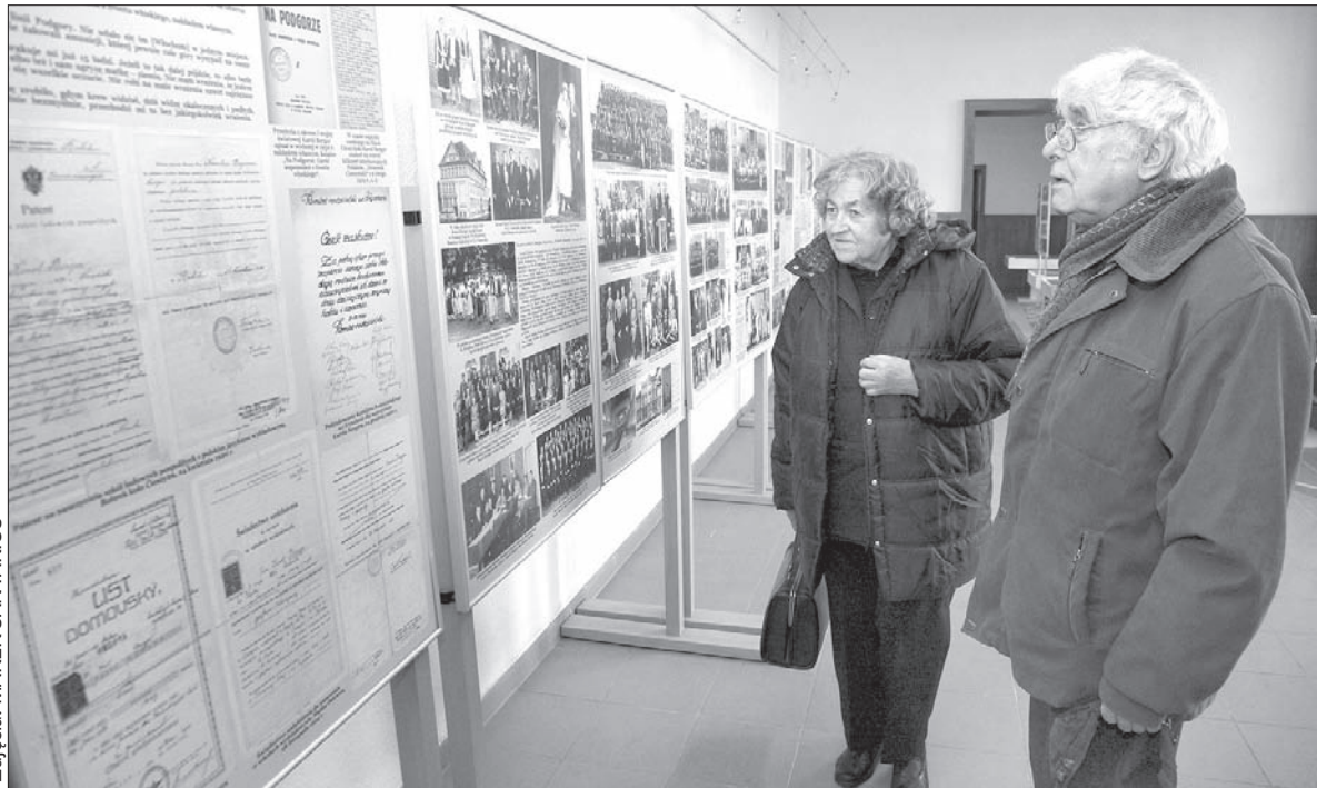
Pierwszego dnia wystawa cieszyła się sporym zainteresowaniem.