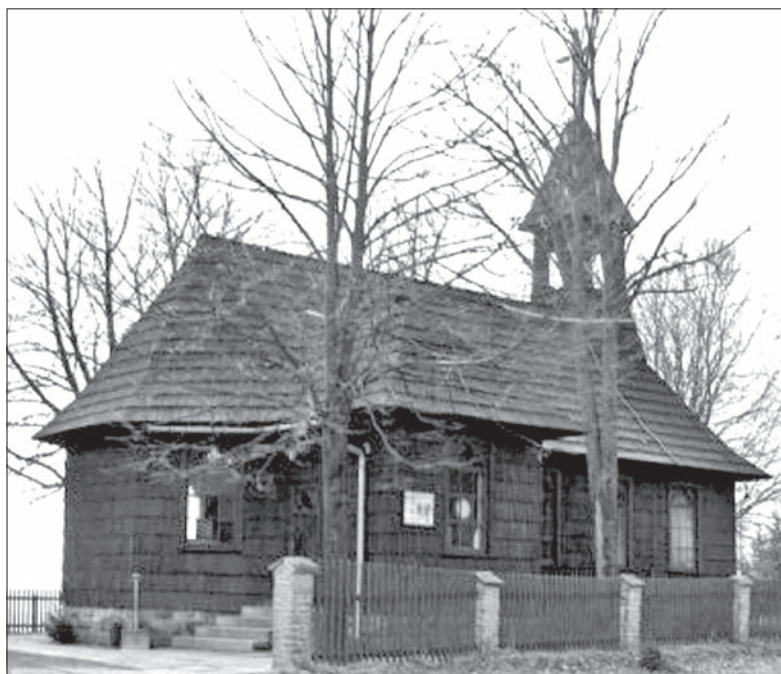
Tak wyglądała świątynia przed spaleniem.

Przez 15 lat nowa świątynia, położona przy czerwonym, niezwykle popularnym szlaku z Przełęczy Kubalonka na Przysłop i dalej na Baranią Górę, pełniła funkcję kaplicy górskiej. W 1972 roku kościółek stał się siedzibą najmniejszej parafii w Beskidach, do której należeli górale ze Stecówki oraz okolicznych przysiółków, między innymi Łączyny i Pietraszonki. To miejsce chętnie odwiedzali także turyści. Wiele osób z całego województwa śląskiego na Stecówce powiedziało sobie sakra-