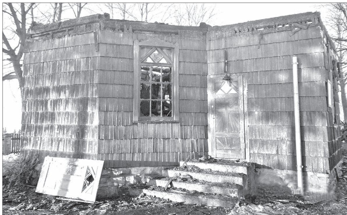
Tyle zostało z kościółka na Stecówce.

dzień: 1 do 2 °C noc: 0 do -1 °C wiatr: 1-2 m/s