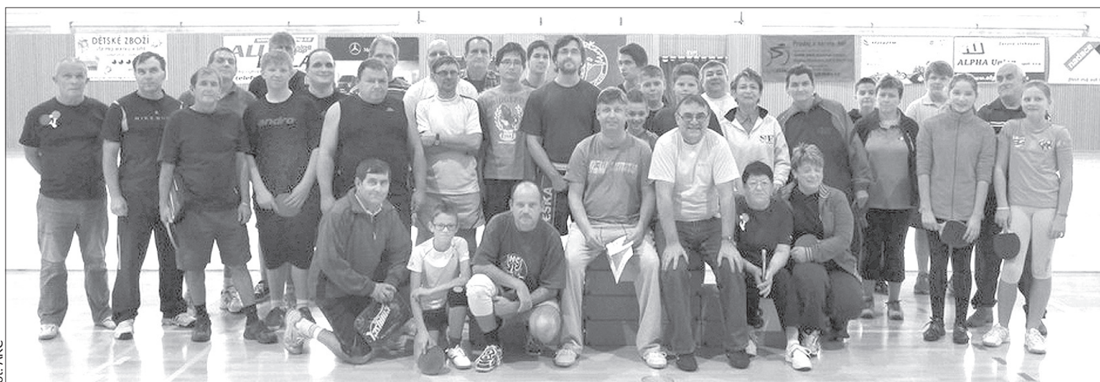
Uczestnicy turnieju w Suchej Górnjej.