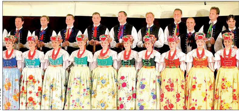
Zespołu „Śląsk” zawsze słucha się z przyjemnością.