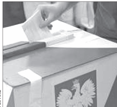
Referendum w Cieszynie? Jeszcze nie wiadomo...

Doświadczenie pokazuje, że zdecydowana większość osób, które biorą udział w referendum głosują za odwołaniem władzy, dlatego