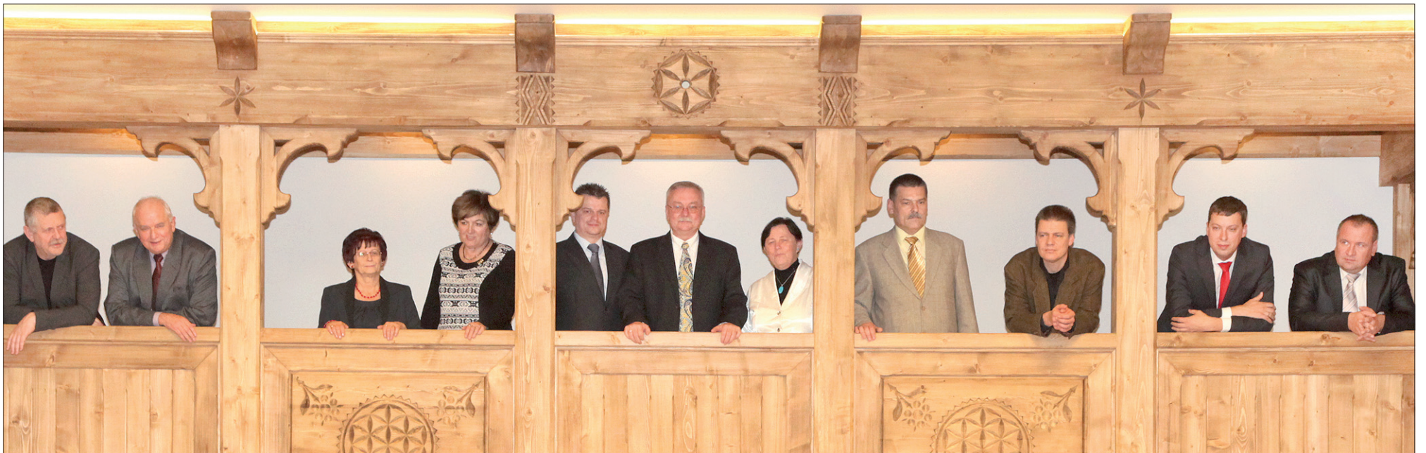
Nowy Zarząd Główny Polskiego Związku Kulturalno-Oświatowego na nowej galerii w Kasowym – Domu PZKO w Mostach koło Jabłonkowa.