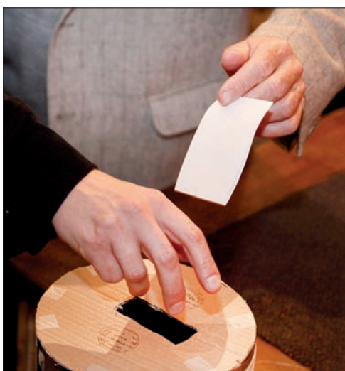
Większość delegatów Zjazdu PZKO wykorzystała prawo wyborcze.