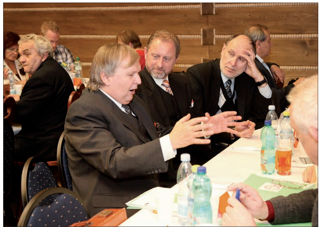
Jak na każdym Zjeździe PZKO, dyskusjom nie było końca.