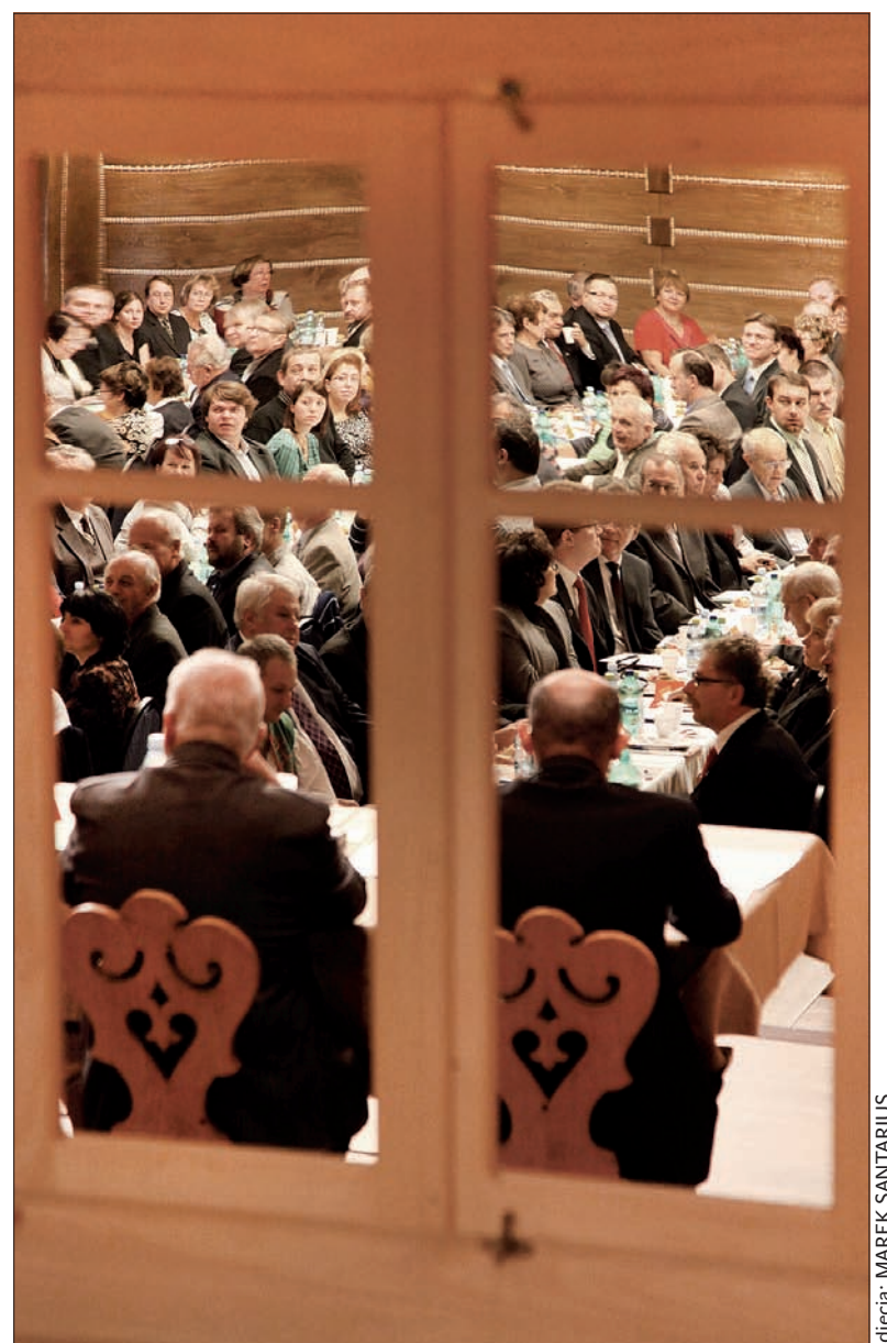
Polski Związek Kulturalno-Oświatowy jest wielkim oknem na świat...