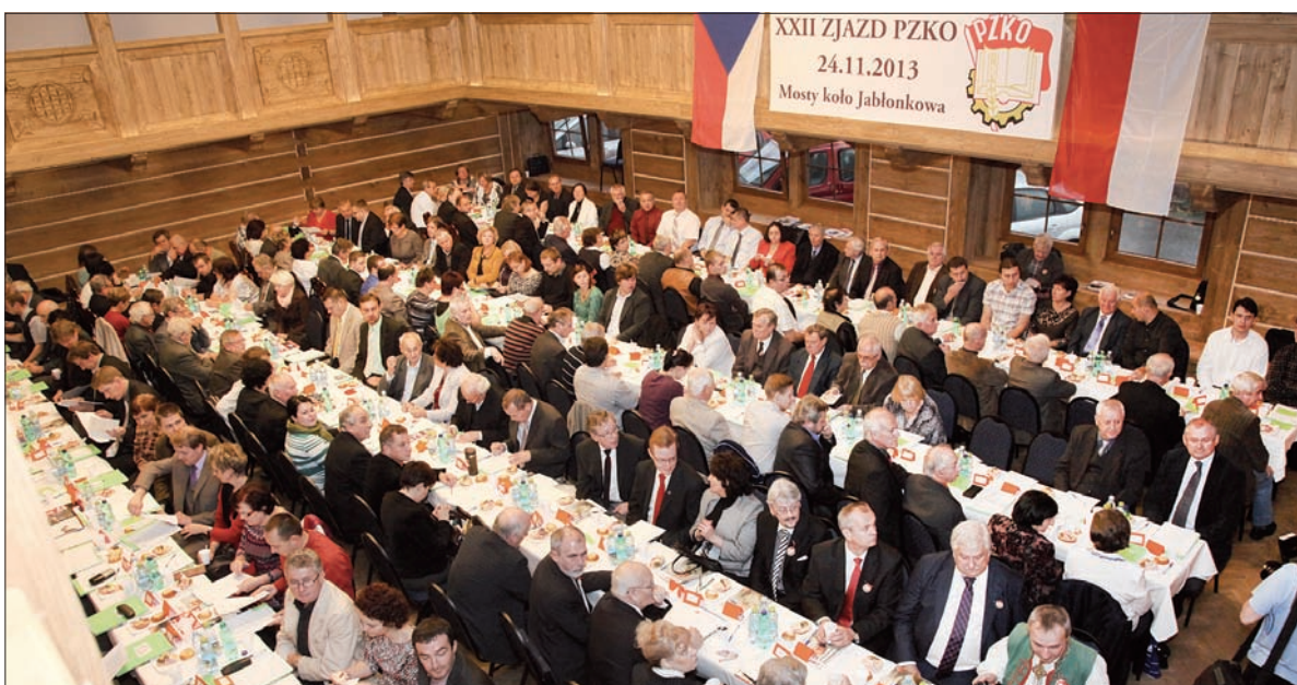
PZKO to największa organizacja w Europie zrzeszająca Polaków poza granicami Ojczyzny.