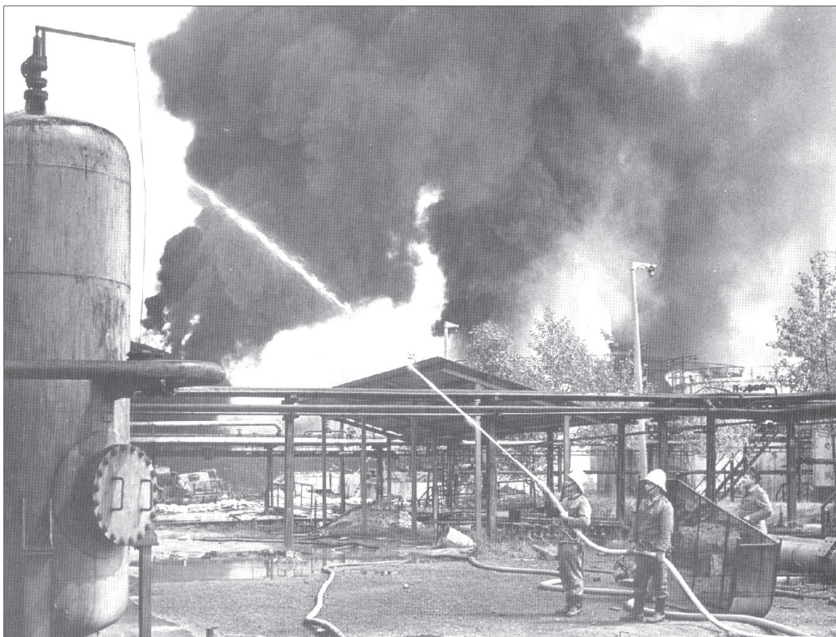
Chłodzenie instalacji gazu.

że był jednym z tych, którzy mieli szczęście i cało uszli z „piekła”. – Miałem 26 lat, rozpoczynałem pracę w zawodowej Straży Pożarnej w Bielsku-Białej. Nigdy wcześniej nie byłem przy tak dużym pożarze, zresztą dla wszystkich uczestników to była pierwsza taka akcja. Okazało się, że był to jeden z największych pożarów nie tylko w Polsce, ale i w Europie. Wówczas nie zdawaliśmy sobie z tego sprawy i wydawało nam się, że za pomocą tego, co mamy, uda nam się ten pożar ugasić. Jednak siła tego żywiołu okazała się niewspółmierna i stanowi do dzisiaj podstawy do szkolenia, do nauki i wyciągania wniosków na przyszłość – opowiadał w Ostrawie. – Udało mi się przeżyć tę akcję, ponieważ kończąc szkołę oficerską, byłem na praktyce w rafinerii nafty. Znałem więc jej teren i w momencie, kiedy nastąpił wybuch, wiedziałem, którędy uciekać. W tym momencie wybór właściwej drogi ucieczki decydował o tym, że albo się przeżyło, albo nie – przyznał pułkownik. Nie ukrywał, że Polska w tamtych czasach dysponowała mizernym wyposażeniem pożarniczym.