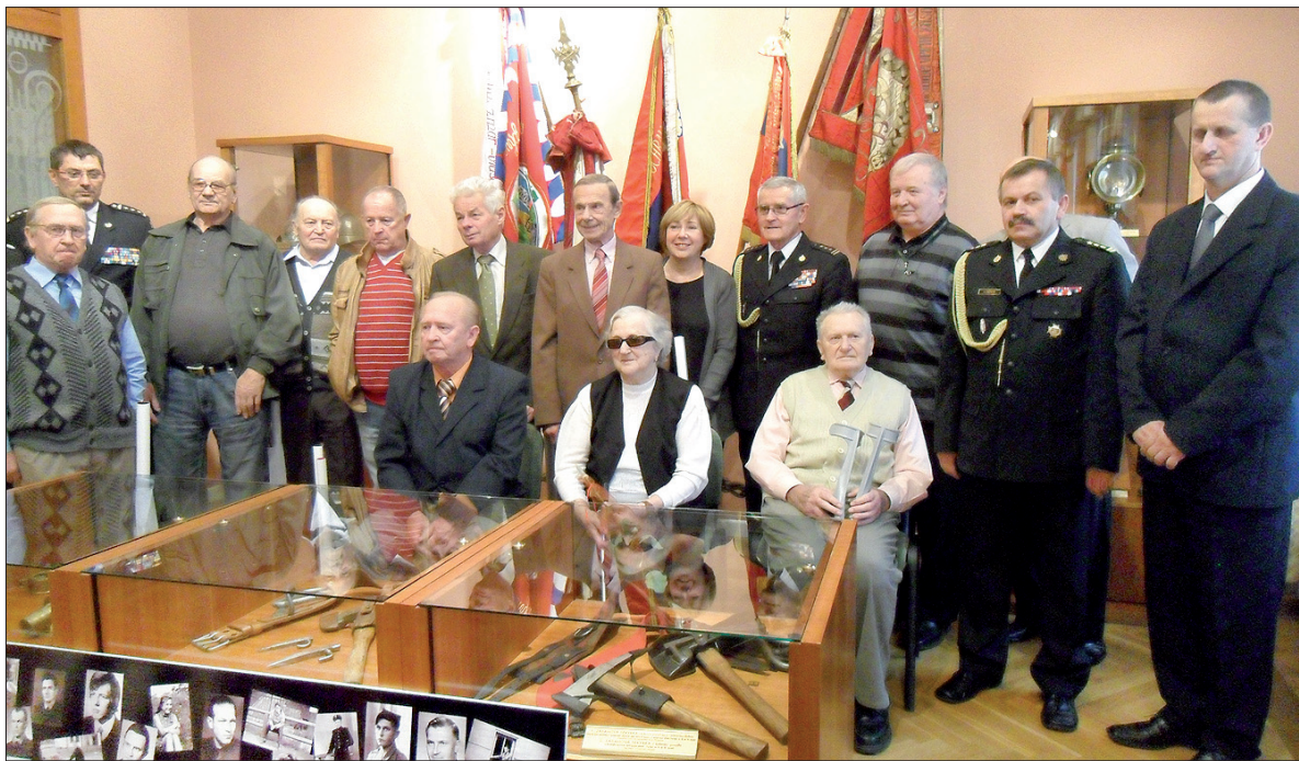
Wspólne spotkanie czeskich strażaków, którzy pomagali gasić rafinerię, z polskimi kolegami i autorem albumu.

Był piękny letni wieczór, sobota 26 czerwca 1971 roku. O godz. 19.50 przez Podbeskidzie przeszła burza. W zawór oddechowy jednego ze zbiorników ropy w czechowickiej rafinerii uderzył piorun. Doszło do zapalenia zbiornika, zapadnięcia dachu i częściowego rozerwania płaszcz. W palącym się zbiorniku znajdowało się blisko 9 tys. ton ropy, w sumie cztery zbiorniki stojące w jednym rejonie zawierały 31 tys. ton łatwopalnej cieczy. Jako pierwsi stanęli do walki z żywiołem strażacy z rafinerijnej jednostki, następnie wezwano załogi z innych fabryk chemicznych