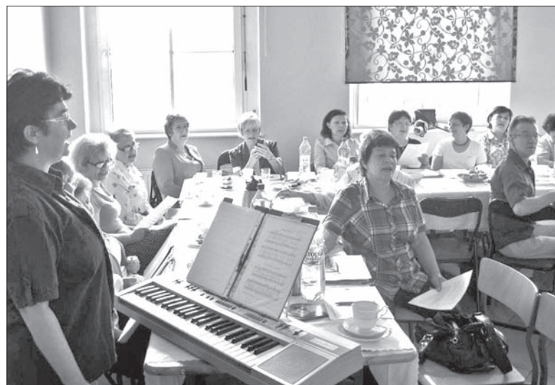
Wspólnie zajęcia muzyczne zbliżyły chórzystów z „Olzy” i „Zaolzia”.

W trakcie spotkania w skrzeckońskim Domu PZKO można było obejrzeć wystawę fotografii związanych z jubileuszami 100-lecia biblioteki i 40-lecia Domu PZKO, a także zakupić „Kalendarze Śląskie 2014”. Odbyło się również miłe spotkanie towarzyskie ze smacznym poczęstunkiem przygotowanym przez członkinię Klubu Kobiet, zaproszono ponadto obecnych na najbliższe wydarzenia – Wigilijkę, która odbędzie się 28 grudnia oraz bal Koła „Od melodii do melodii...”, który zaplanowano na 11 stycznia 2014 roku w sali bogumińskiego zakładu Bochemia. (D.G.)