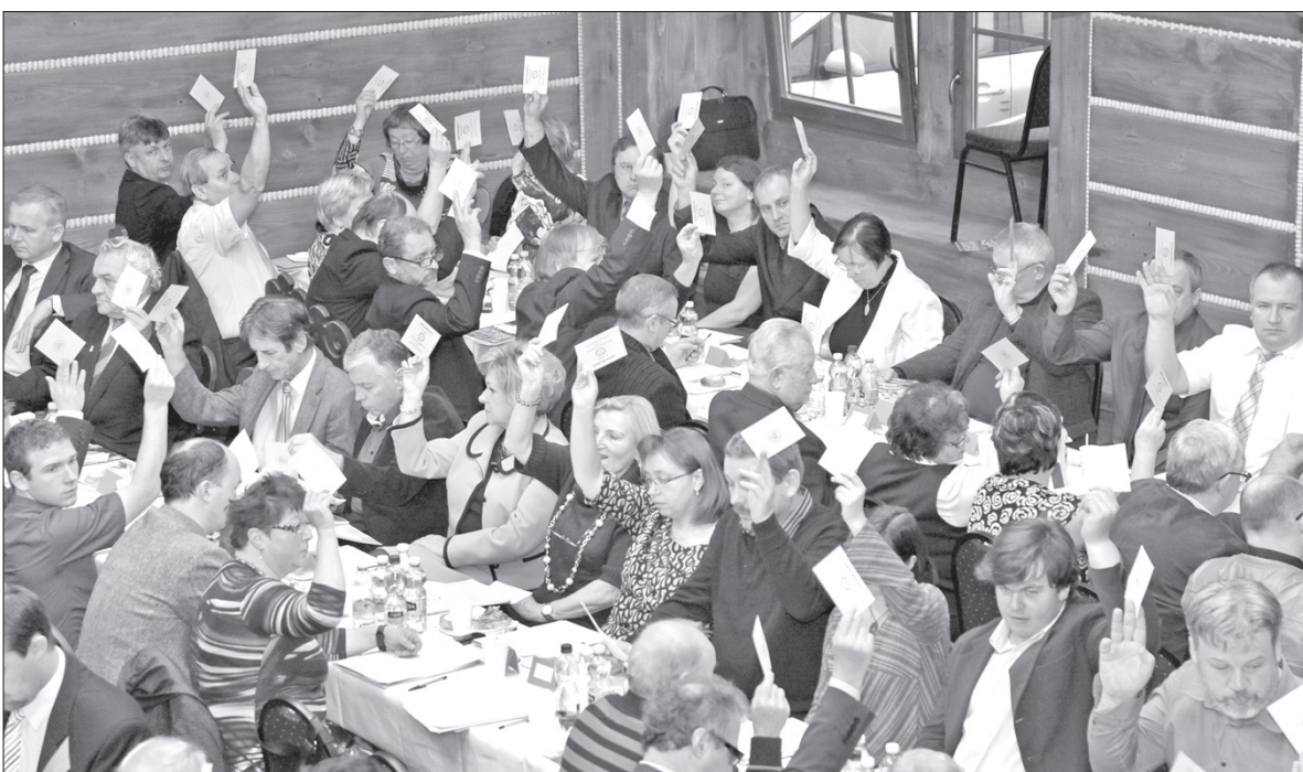
Delegaci na XXII Zjeździe PZKO w Mostach koło Jabłonkowa.