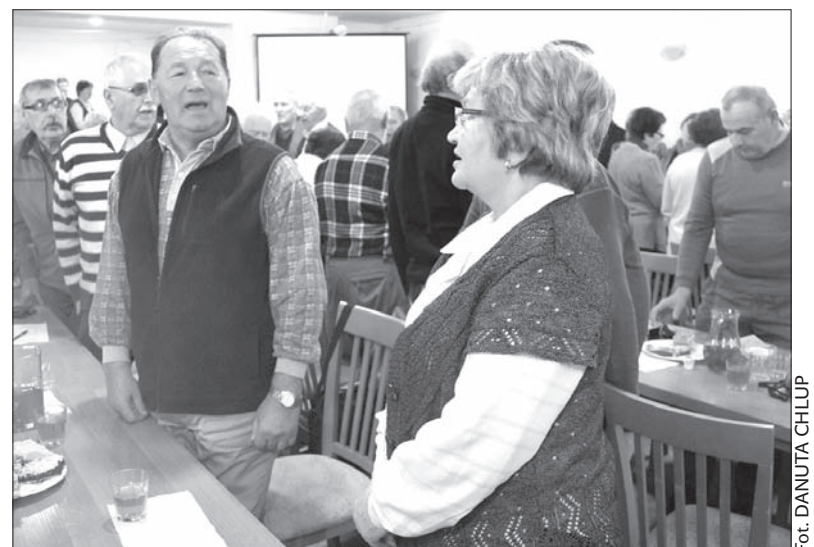
Członkowie „Beskidu Śląskiego” zainaugurowali spotkanie swoim hymnem – pieśnią „Szumi jawor, szumi”.