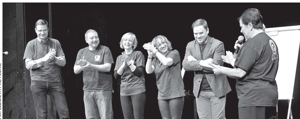
Finał imprezy w Teatrze Cieszyńskim.