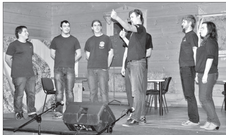
Na scenie wystąpili również absolwenci.

Świętująca jubileusz podstawówka przygotowała prezentację multimedialną o historii miejscowego