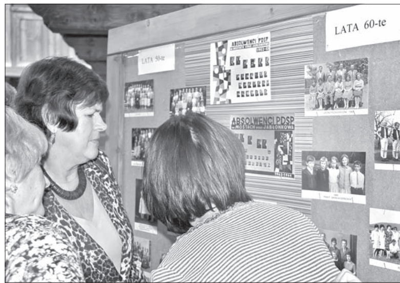
Wystawa przywoływała miłe wspomnienia lat szkolnych.