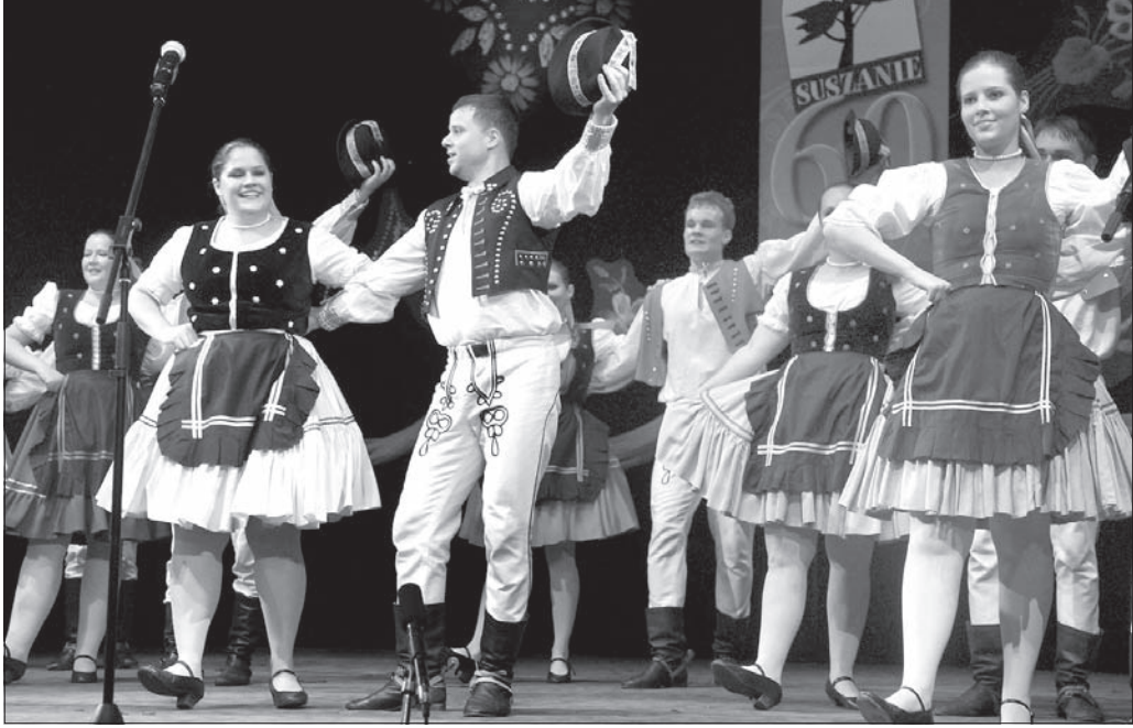
„Suszanie” w aktualnym składzie.

Dwa dni w strojach, dwa dni w tańcu, dwa dni na scenie. Tak przeżyli miniony weekend obecni i byli członkowie Zespołu Pieśni i Tańca „Suszanie”, świętując jubileusz 60-lecia istnienia. Jak przystoi na zespół działający w ramach Miejscowego Koła Polskiego Związku Kulturalno-Oświatowego, uroczystości jubileuszowe zespół rozpoczął dostojnym polonezem.