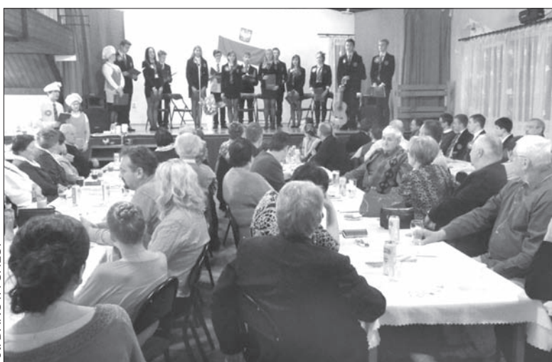
Gośćmi sobotniego spotkania na Kościelcu z okazji Święta Niepodległości byli uczniowie z zaprzyjaźnionego z naszym regionem chorzowskiego liceum.

W Cieszynie obchody święta rozpoczęło o godz. 10 nabożeństwo ekumeniczne w intencji Ojczyzny w kościele Jezusowym. Godzinę później rozpoczęła się manifestacja patriotyczna na Placu Wolności przy Pomniku Niepodległości obok Liceum im. M. Kopernika. Jej uczestnicy