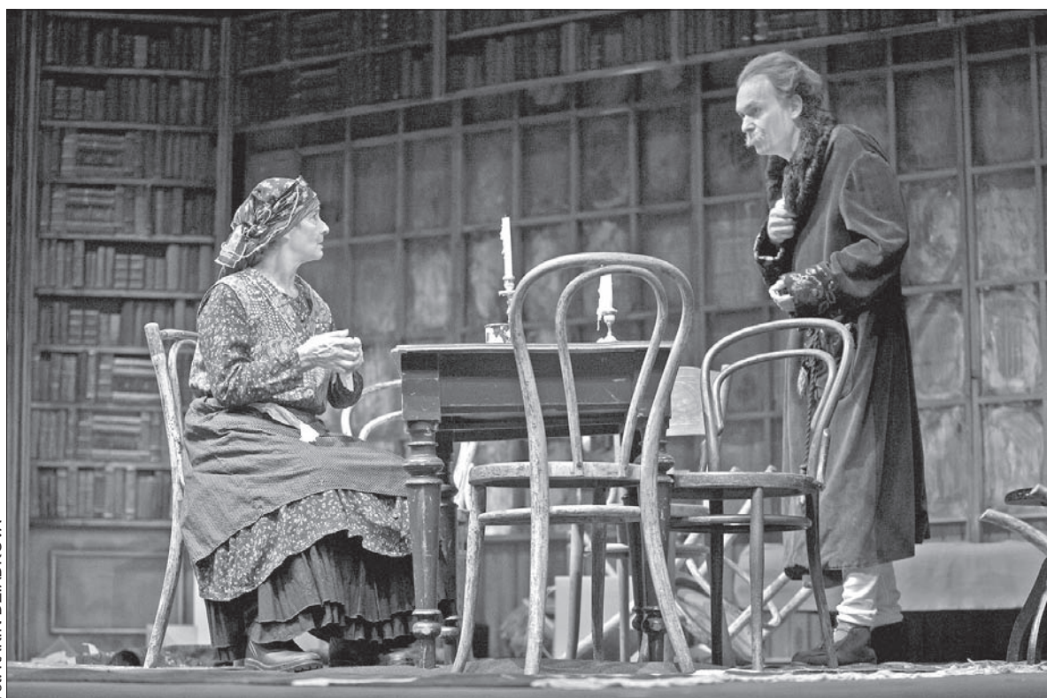
Scena ze zwycięskiego spektaklu „Rosyjskie konfitury”.