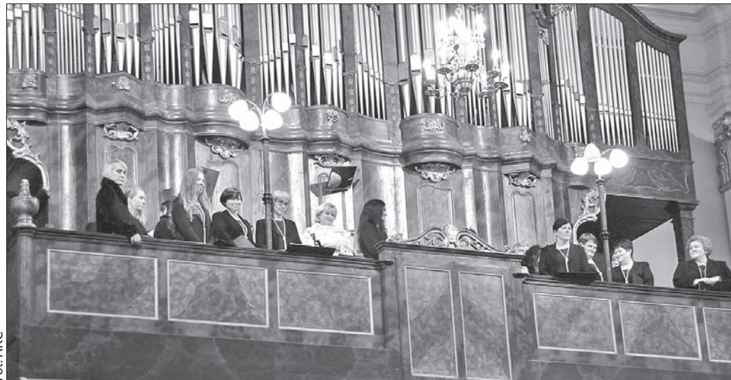
Organy w kościele Jezusowym wymagają pilnego remontu.

– Na renowacji organów staramy się zdobyć pieniądze z zewnątrz. Napisaaliśmy specjalny pro-