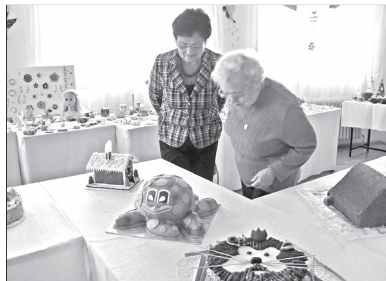
Ciekawe, jak powstał taki tort?

Co można było zatem obejrzeć? Robótki malowane, haftowane, z koralików i kamieni, wyroby ceramiczne. Obrazki, ozdóbki, upominki. A także wyroby o tematyce bożonarodzeniowej, wieńce adwentowe, świeczniki, ozdoby, które można było na miejscu zakupić. Osobne miejsce zajmowały kolorowe torty. Każdy z nich to osobne dzieło sztuki i inny pomysł. Były więc lalka Barbie, smok, samochód czy domek z