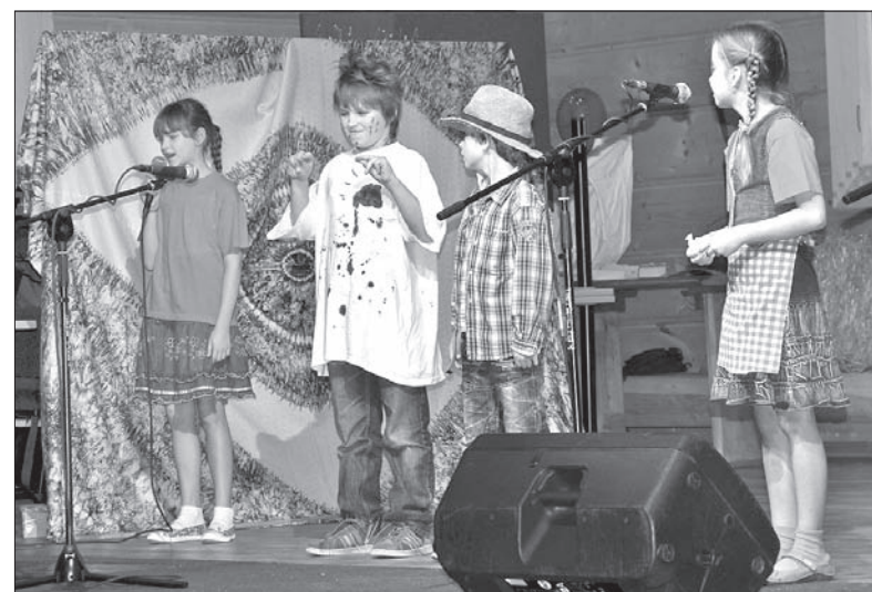
Wierszyk o brudasiu w wykonaniu uczniów mosteckiej szkoły.

Od dziesięciu lat polska szkoła w Mostach tworzy z przedszkolem jeden podmiot prawny, od kilku lat jest już tylko szkołą małoklasową.