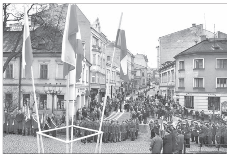
Na koniec uczestnicy patriotycznej demonstracji przeszli pod Pomnik Legionistów.