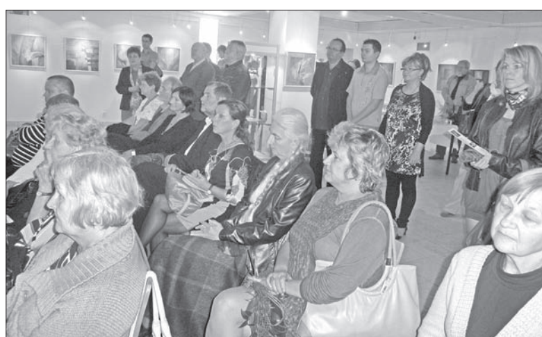
Goście wernisażu w Sali Wystaw im. Josefa Mánesa.