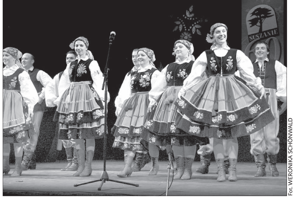
Byli członkowie w strojach łowickich.