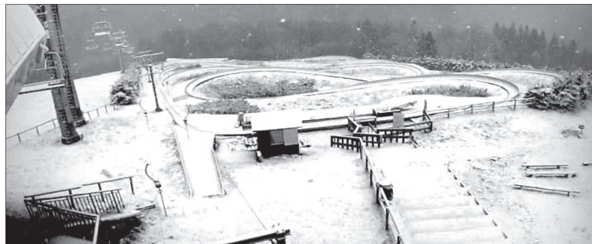
Wczoraj w Beskidach pojawił się biały puch. Od kilku godzin Czantorię pokrywała cienka warstwa śniegu. To pierwsze opady w tym sezonie. Uważajmy na drogach, niebawem śnieg może pojawić się na naszych ulicach. To ostatni dzwonek, by wymienić opony. A czy u was też zrobiło się już biało? (ox.pl)