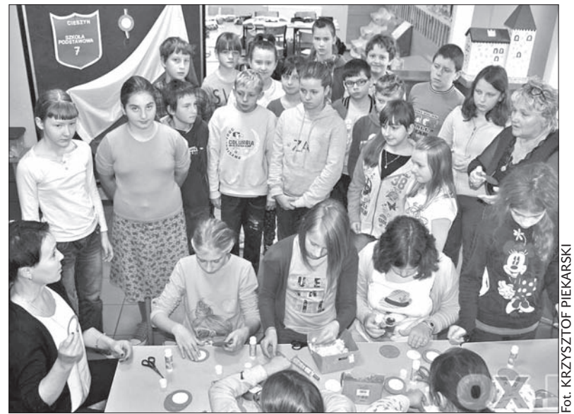
Dzieci przygotowują kotyliony.