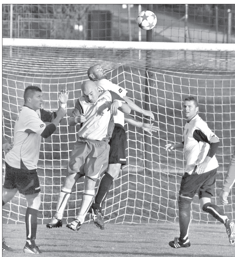
Piłkarze Olbrachcic poczuli się jak w bajce.

Lokaty: 1. Szonów 25, 2. Olbrachcice 24, 3. Stonawa 20, ... 10. Lutynia Dolna 14, 13. Bystrzyca 8, 14. ČSAD Hawierzów 6 pkt. (jb)