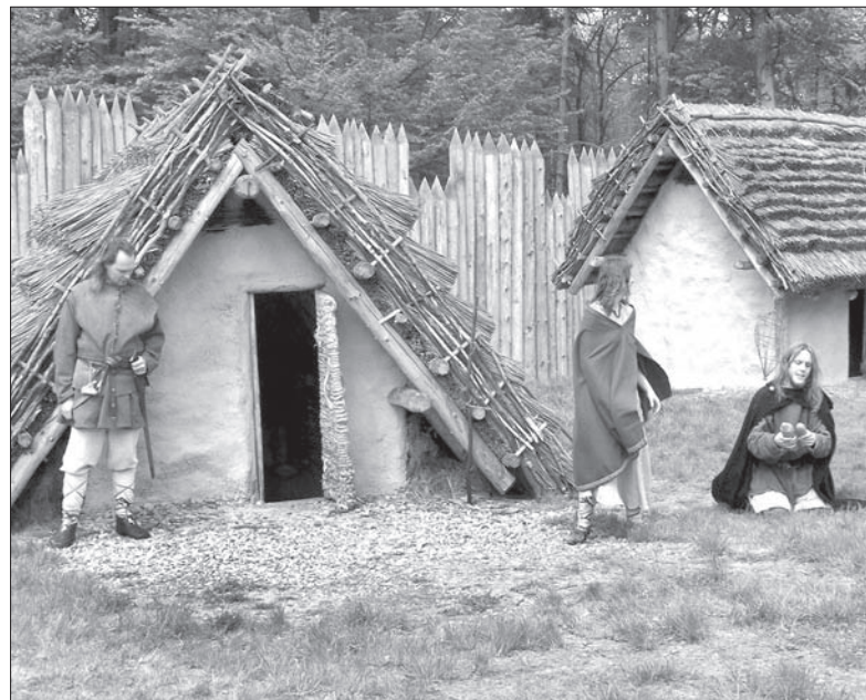
Wśród projektów-szczęściarzy, które dostaną szczodre dofinansowanie z funduszy europejskich, jest na przykład Archeopark w Kocobędzu-Podoborze.

eparku w Kocobędzu-Podoborze powstanie przy wejściu nowy, wielofunkcyjny budynek, wybudowana zostanie kładka łącząca go z grodziskiem, pojawią się też dwie nowe repliki słowiańskich zabudowań mieszkalnych i mały park linowy, a także nowy parking. Na pieniądze mogą liczyć także park leśny przy sanatorium w Klimkowicach czy ścieżka edukacyjna we Frenszacie pod Radhoszczem. Wśród rezerwowych jest na przykład rozbudowa parku w sanatorium w Jabłonkowie i remont Katedry Bożego Zbawiciela w Ostrawie. (ep)