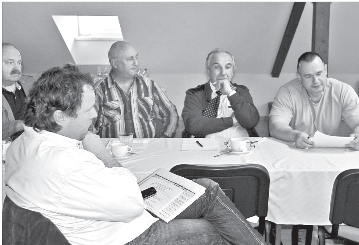
Okrągły Stół w ZG PZKO w Czeskim Cieszynie.

gotowanie tematów i podtematów oraz tematów długofalowych i krótkofalowych, a następnie zajęcie się poszczególnymi tematami w grupach.