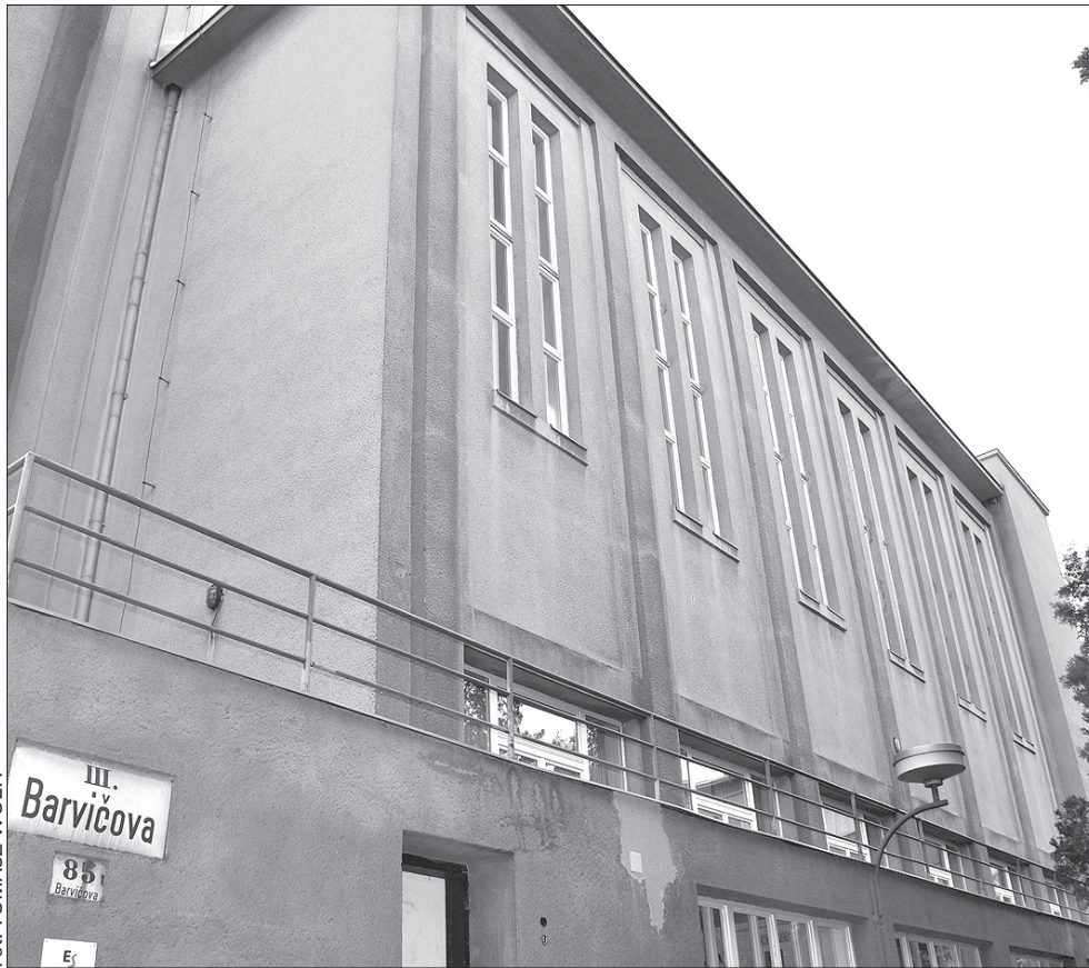
W tym budynku mieścił się podobój w Brnie.

Powstanie podoboju Brunn wiązało się z przeniesieniem Akademii Technicznej SS i Policji z Berlina do Brna, co nastąpiło latem 1943 r. Zadaniem tej instytucji było szkolenie kadr technicznych na potrzeby SS oraz konstruowanie nowoczesnej broni. Polecenie jej utworzenia wydał 12 grudnia 1941 r. SS-Reichsführer Heinrich Himmler. Początkowo Akademia Techniczna SS i Policji mieściła się w Berlinie. Stolica III Rzeszy narażona była jednak na coraz częstsze ataki lotnictwa