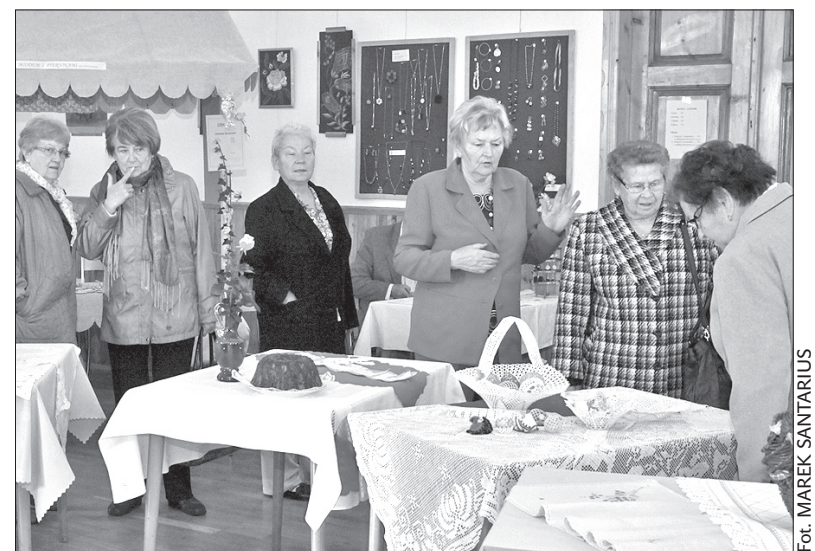
Z olbrachcickiej wystawy.

Jarmark jesienny w Łomnej Dolnej odwiedziło w tym roku niemal 7 tysięcy osób, nie tylko z najbliższej okolicy.