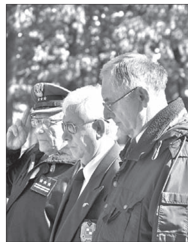
Uroczystość przed pomnikiem.

W ramach Pikniku Spadochroniarskiego można było zobaczyć sprzęt wojskowy oraz powietrzne akrobacje. Niestety pogoda pozwoliła na oddanie tylko trzech skoków. (wot)