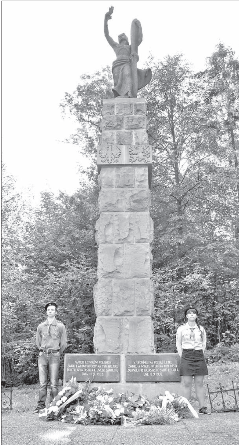
W trakcie imprezy młodzi harcerze pełnili wartę honorową.