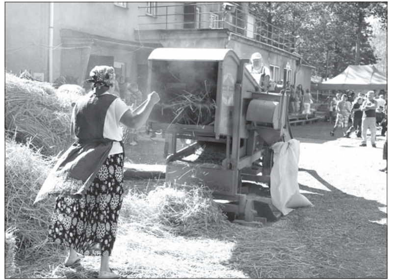
Po ubiegłorocznym młóceniu pszenicy cepami, w tym roku mieszkańcy Piosku pokazali, jak wygląda praca młockarni.

Imponujący pochód dożynkowy wyruszył sprzed kościoła ewangelickiego i dotarł do miejscowego kompleksu sportowego.