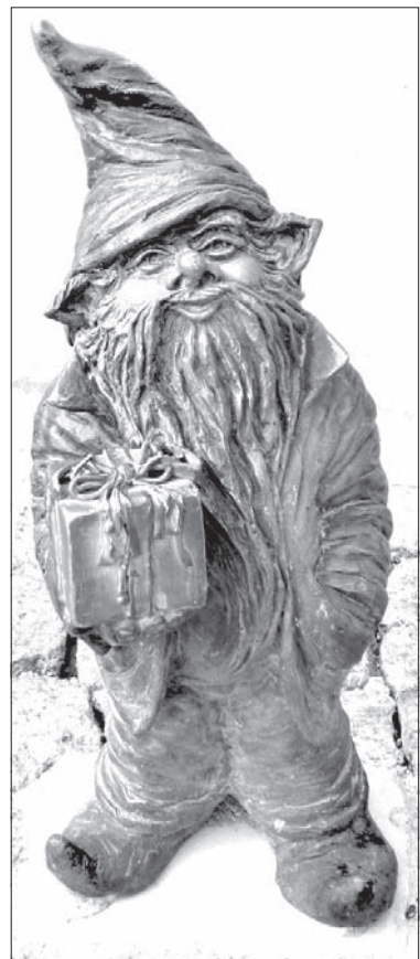
Krasnale wpisali się w krajobraz Wrocławia.

Pod koniec sierpnia MK PZKO w Ligotce Kameralnej zaprosiło nas na wycieczkę. Dzięki dotacji finansowej z gminy Ligotka Kameralna na autobus, mogliśmy pojechać trochę dalej, tym razem aż do Wrocławia. Takiej okazji się nie odrzuca, więc wyruszyliśmy. Jednym z interesujących miejsc, koło którego przejeżdżaliśmy, było jedno z najstarszych śląskich miast – Racibórz, znany z fabryki cukierniczej „Mieszko”. Równocześnie dowiedzieliśmy się, że jest to jedno z miast z najniższym wskaźnikiem bezrobocia. Mogliśmy też z ciekawością obejrzeć dwujęzyczne tablice miejscowości, polsko-niemieckie. O tym, że zbliżamy się do celu, informował nas widok na najwyższy budynek w Polsce – Sky Tower, wznoszący się na wysokość 212 m. Wreszcie dotarliśmy do celu. Wrocław, leżący nad Odrą i jej czeremba dopływami, z tego powodu często nazywany jest Wenecją Północy. Plasuje się na czwartej pozycji w Europie pod względem liczby mostów. Wyprzedzają go tylko Amsterdam, Wenecja i Petersburg. Wrocław jest też czwartym miastem pod względem liczby ludności w Polsce, w stolicy Dolnego Śląska mieszka