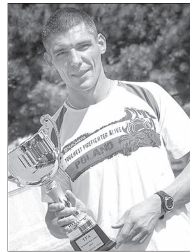
„Najtwardszy Strażak” z pucharem.

i dwa razy plasując się na drugim miejscu. – W tegorocznych zawodach pucharowych wzięło udział 114 strażaków z RC, Słowacji i Polski.