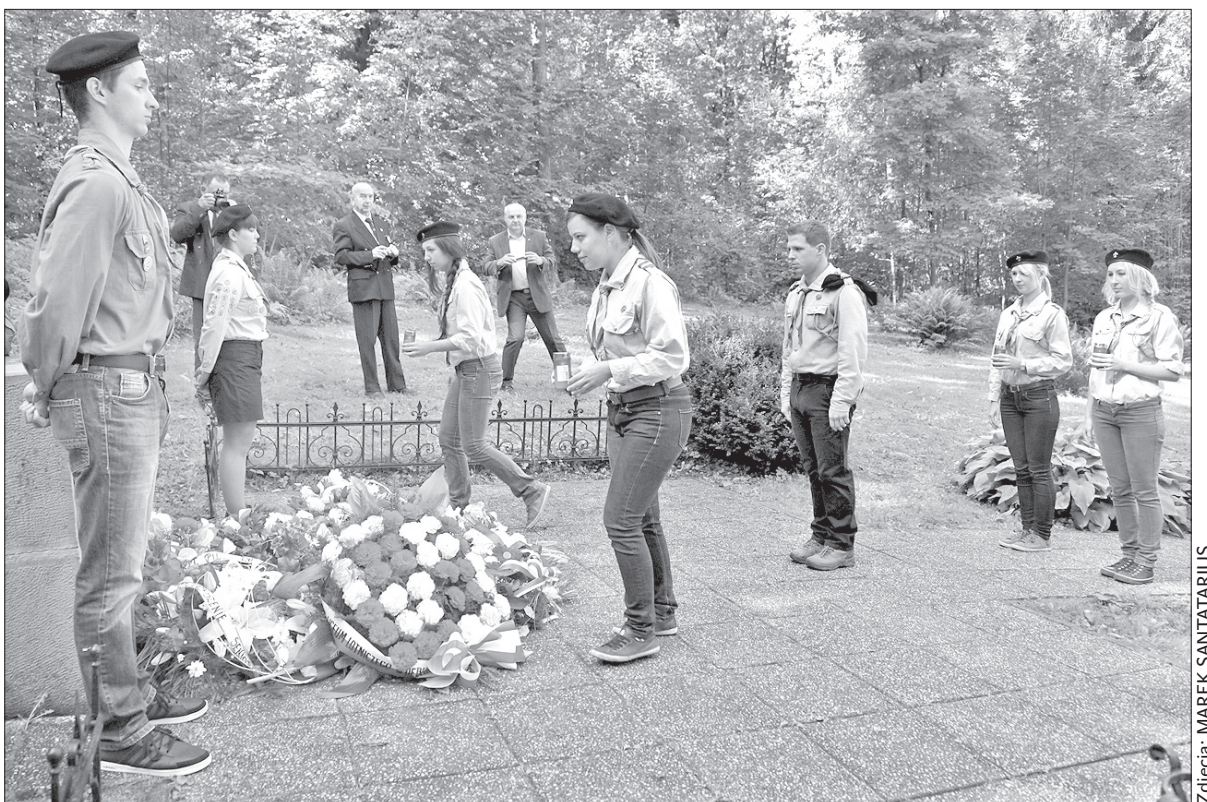
Wieniec złożyły m.in. delegacje z różnych szkół.

Właściwe obchody 81. rocznicy tragedii polskich bohaterów przestworzy zaplanowane są na jutro. – Na 11 września przygotowujemy dzień otwartych drzwi. Zapraszamy wszystkich zainteresowanych do zwiedzenia izby pamięci, złożenia kwiatów. W Domu Polskim Żwirki i Wigury będziemy od godz. 10.00 do 19.00, a o 16.00 odbędzie się msza w intencji ofiar katastrofy z 1932 roku. Po nabożeństwie zapraszamy do Domu Polskiego na kawę lub herbatę. Przyjedzie wielu sympatyków lotnictwa i weteranów – dodał Smugała. (ep)