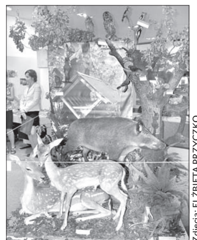
Zwierzęta w orłowskim muzeum wyglądają jak prawdziwe.

W części „leśnej” zaprezentowane są na przykład danielę, dziki, a także gniazda z ptakami, łasice, czy jeże. W ekspozycji poświęconej stworzeniom żyjącym nad wodą i w wodzie pokazane są m.in. żabki, ptaki czy