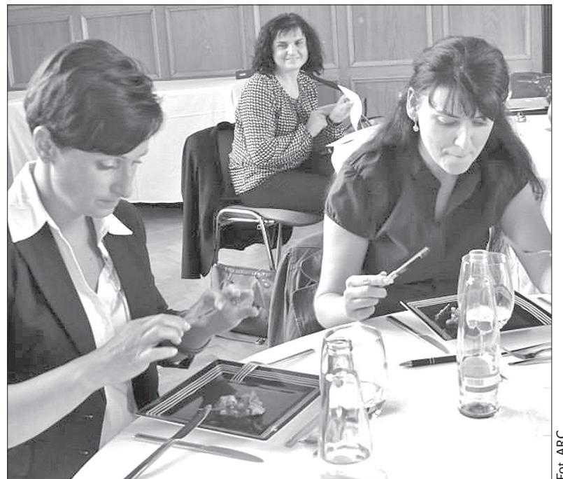
Komisja oceniała w środę smak regionalnych potraw.

Wielkim finałem tegorocznego konkursu będzie festiwal gastronomiczny na zamku w Bruntalu, zaplanowany na 29 września. (ep)