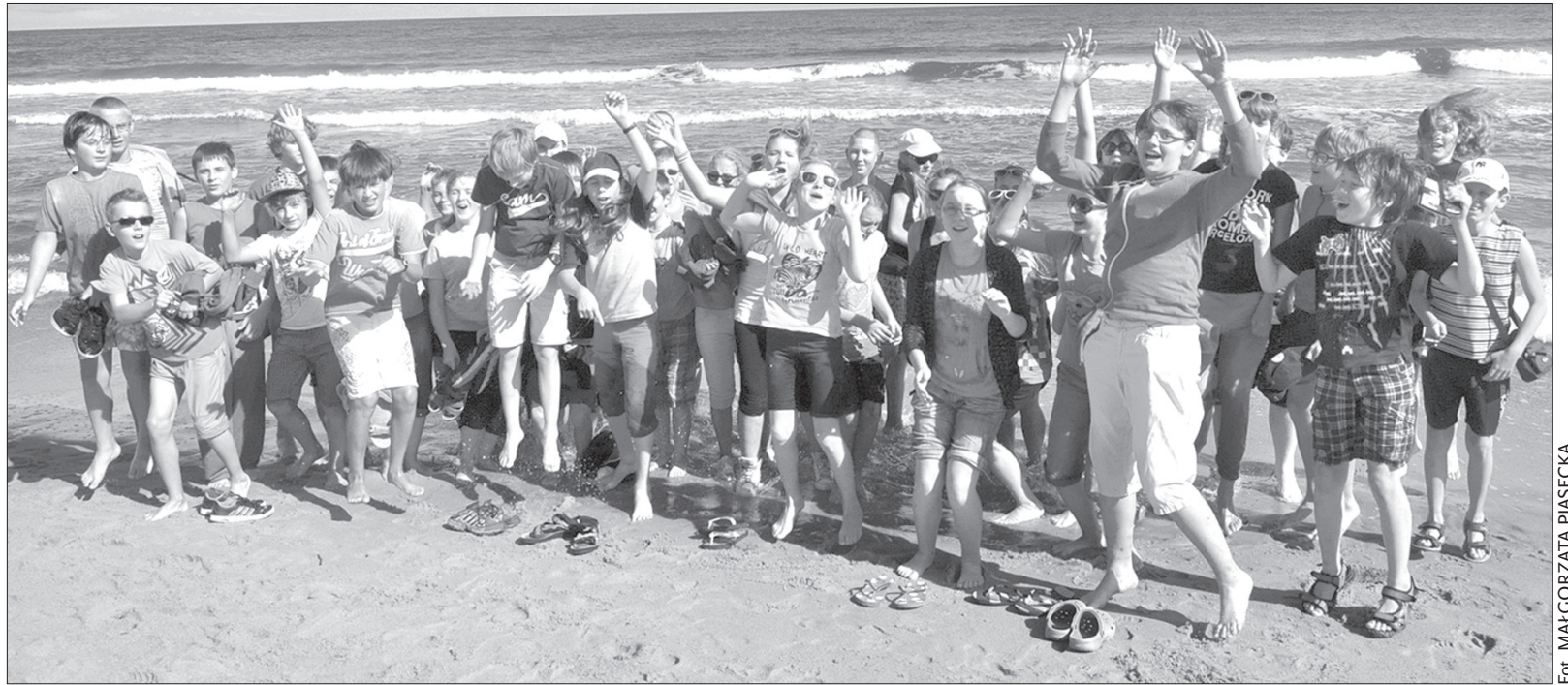
Pierwszy dzień Zielonej Szkoły i pierwszy kontakt z morzem.