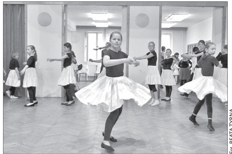
Dziewczeta z ubiegłorocznej najstarszej grupy.